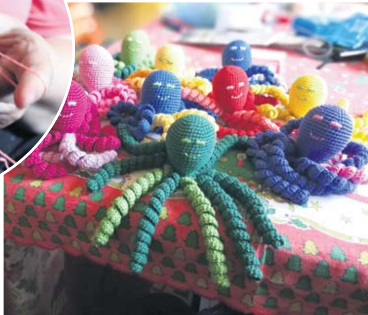
U četiri mjeseca Marija je izradila čak 40 hobotnica

Hobotnice prije nego upoznaju svoje bebe prolaze pranje i sušenje