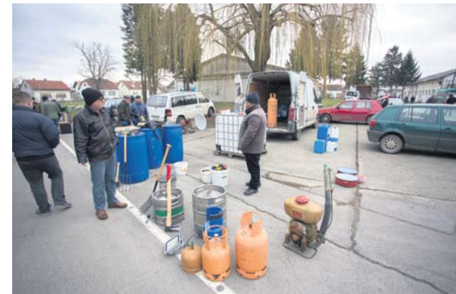
Po povoljnim cijenama mogu se kupiti i plinske boce

doći, upozoravaju nas posjetitelji. - E, moj sinko, rado bih popila kavu ili nešto toplo pojedla, ali restoran na ovom prostoru zatvoren je već mjesec dana. Ne možemo nigdje obaviti ni nuždu, a kamoli nešto popiti ili pojesti - kazala nam je jedna starija gospođa želeći ostati anonimna da joj netko ne bi zamjerio zbog ove izjave. Prodavači na sajmu o vremenskim prilikama ne trebaju brinuti, jer dolaskom još hladnijeg vremena organizatori buvljaka iz Poslovnog parka Virovitica preselit će sajam na zatvoreni dio Gradske tržnice. Ondje postoji i javni toalet, a i ugostiteljski objekti su blizu. No, nakon povratka na prostor bivše vojarnе i prodavači i kupci nadaju se da će i tamo moći koristiti iste pogodnosti.