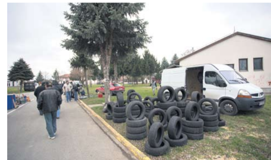
Velika ponuda na sajmu je i ponuda autoguma svih profila