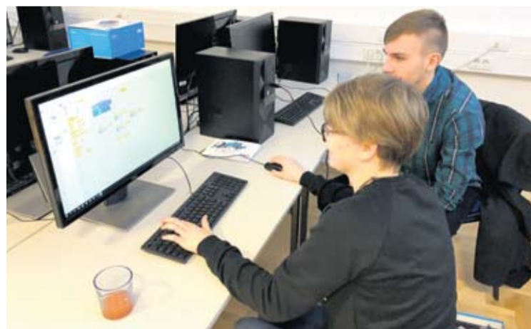
Srednjoškolci su učili programirati

● Polaznici su naučili kako napraviti aplikacije u kojima sami ubacuju različite funkcije, da se na pritisak tipke ili kada se protrese mobilni uređaj događa neka-