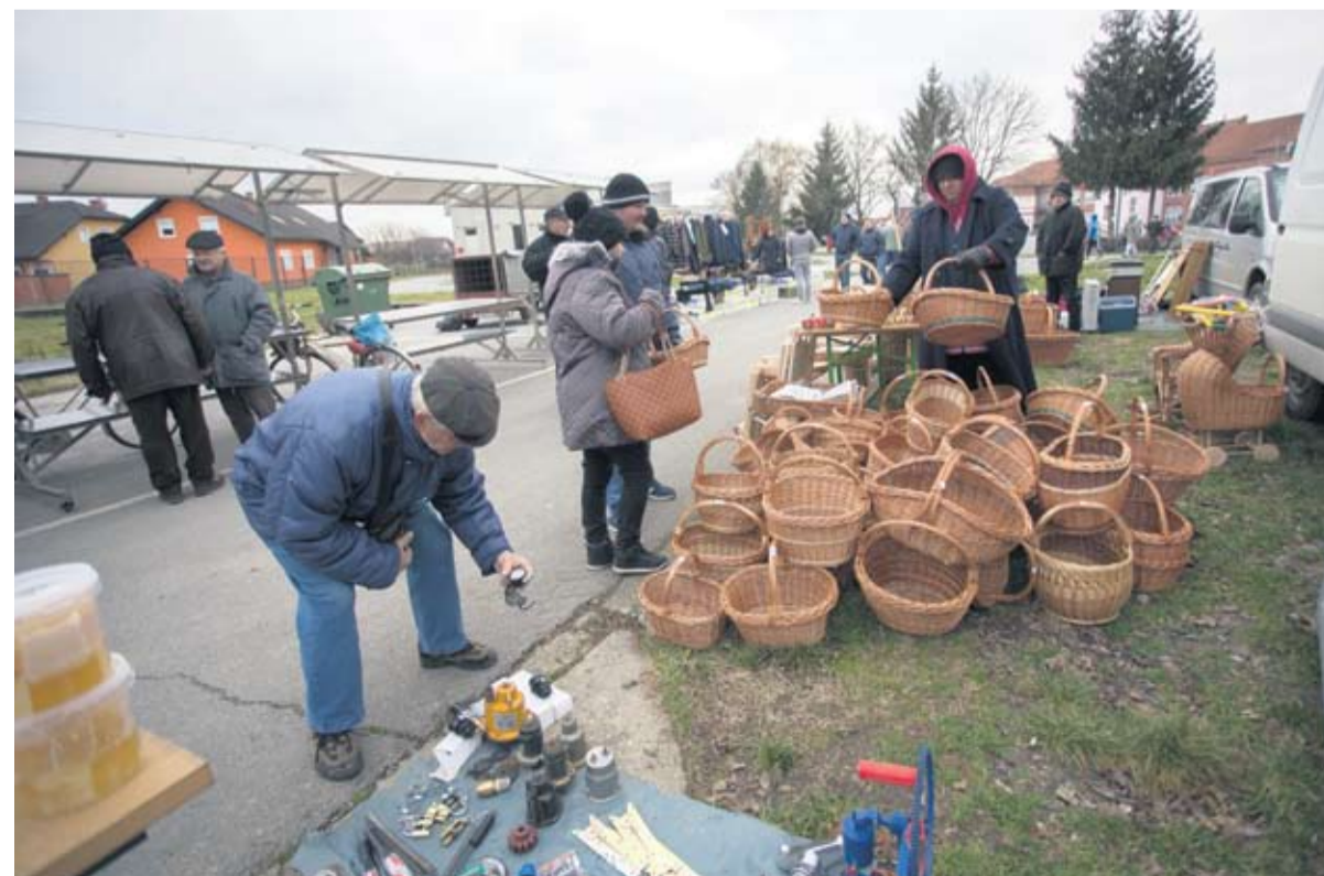
Ručno izradene košare uvijek na meti kupaca