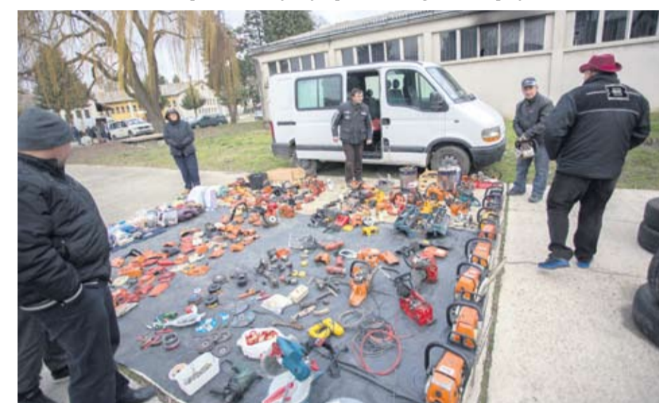
Na buvljaku uvijek velika ponuda polovnih motornih pila i dijelova za nju