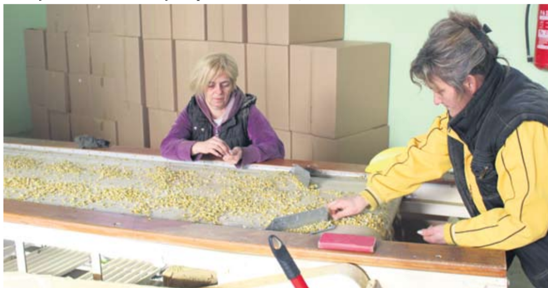
Prerada ljekovitog bilja - kamilica jedna od najvažnijih kultura tvrtke