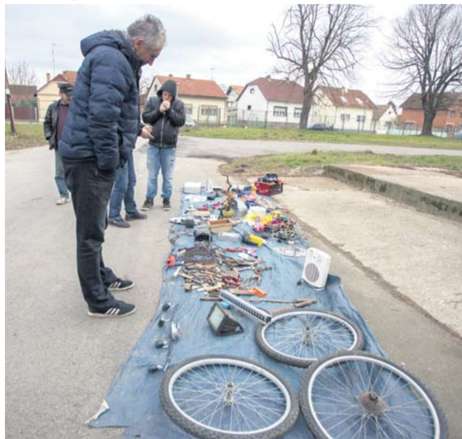
Pozornost kupaca privlače i dijelovi za bicikle

● Na sajmu se mogu pronaći razni alati, glazbeni instrumenti, plinske boce, razni ukrasni predmeti, rabljena i nova odjeća, polovne i nove autogume svih dimenzija. Velika je ponuda, ali i potražnja za autodijelovima i dijelovima za motorne pile