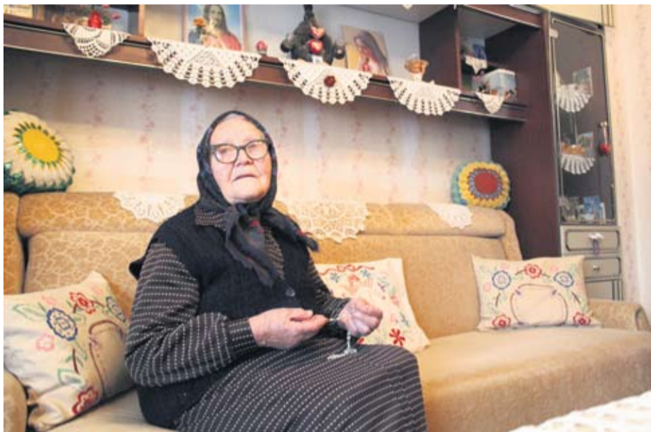
Molitva krunice obavezna je prije spavanja

● Nikada mi u životu nije bilo teško, a najveća su mi radost moja djeca i cijela obitelj. Meni je sve dobro, zadovoljna sam i sretna, poručila je slavljenica, koja je s obitelji u Viroviticu došla za vrijeme Domovinskog rata iz Slankamena, u kojemu je rođena i odrasla