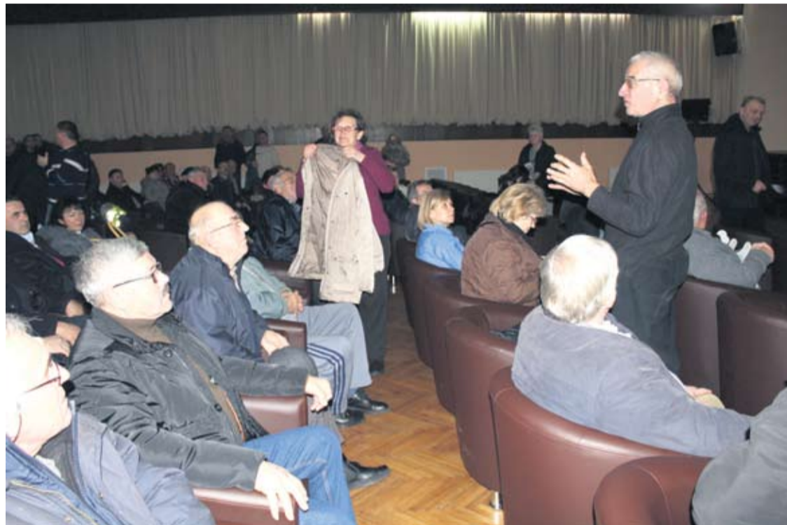
Sa sastanka Udruge malih dioničara - udjelničara tvrtke Tvin d.o.o.

● Predstavници odvjetničkih timova naglasili su kako im je cilj postizanje pozitivnih promjena u poslovanju tvrtke te da svaki udjelničar može po svojoj savjesti raspolagati sa svojim udjelima u Tvinu, odnosno da sami mogu odlučiti o daljnjoj sudbini tvrtke