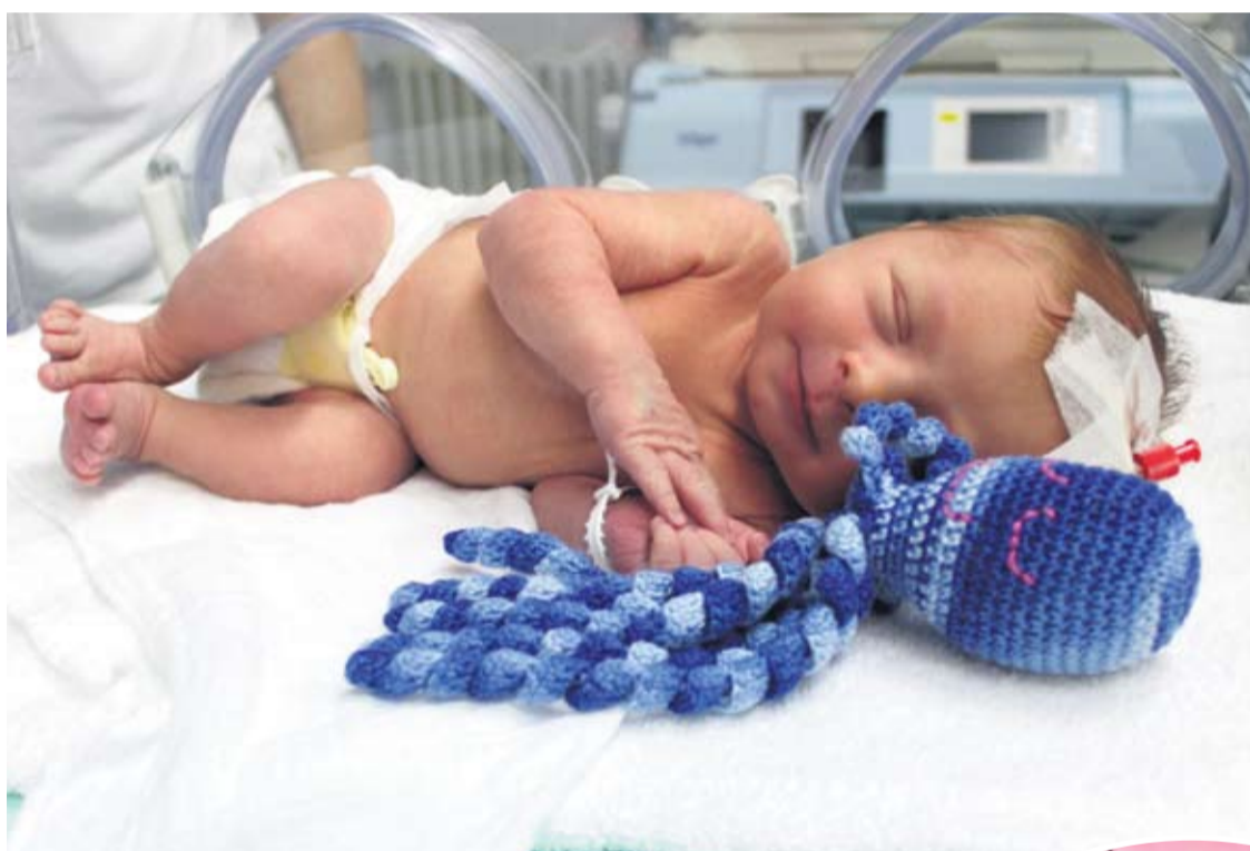
Čari ručno pletene hobotnice osjetio je i maleni David u virovitičkoj Općoj bolnici

Upravo su se Hobbyce pokazale kao prave "čuvarice" jer njihovi krakovi bebe podsjećaju na pupčanu vrpcu i tako ih asociraju na majku i na sigurnost koju su imale u majčinom trbuhu. - Bebe se ručicama omotaju oko krakova i umire se, disanje im se stabilizira, a upravo je mirnoća važna kako bi lakše napredovali - objašnjava Jelena Adamović, medicinska sestra na neonatologiji Opće bolnice Virovitica. Ona je jedna od osoba koja s malenima proživljava te najteže dane, a kaže kako blizina hobotnice na iznenađujući