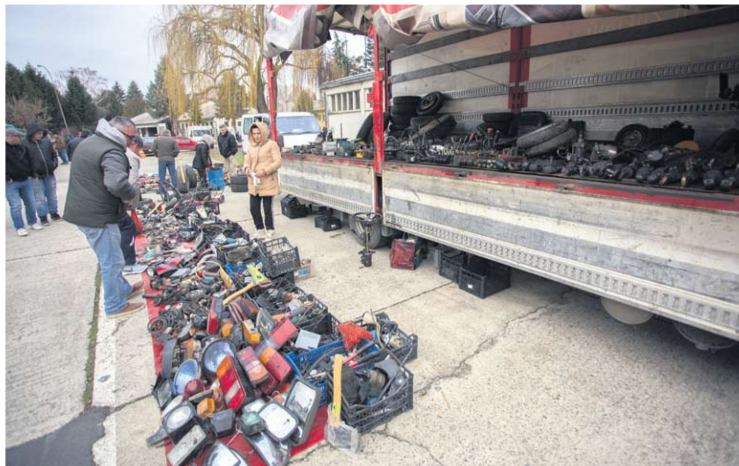
Najveća ponuda na sajmu je polovnih auto dijelova

i nove automobilske gume svih dimenzija. Velika je ponuda, ali i potražnja za autodijelovima i dijelovima za motorne pile. - Nekih dijelova za starije modele automobila na policama trgovina nema, a ovdje se uvijek nešto može pronaći - kazao nam je Marijan iz Kloštra Podravskog, koji sa sajma radostan kući nosi ventilator za svog limenog ljubimca.