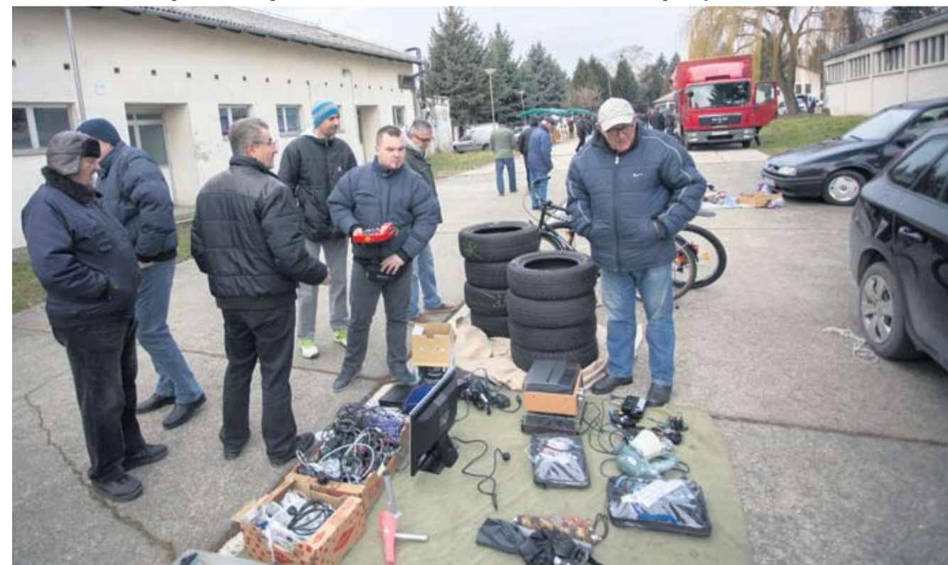
Veliko zanimanje i za elektroničke dijelove