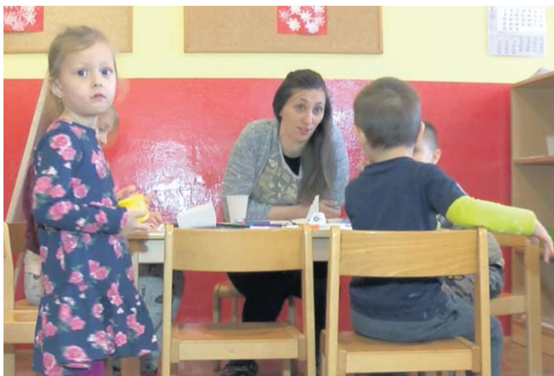
Vrtić pohađa dvadeset mališana

"Suncokret" iz Slatine Snježana Dupan-Lovrić naglasila je kako je vrtić prije dva mjeseca obilježio 10 godina rada te kako mu je otvaranje ove podružnice u školi u Mikleušu najbolja čestitka i rođendanski poklon za njegov jubilej. Župan Igor Andrović naglasio je kako je otvaranje ovog vrtića jedinstveni primjer spoja privatnog i javnog sektora, a na dobrobit stanovništva ove male općine te cijele županije. - Ovo je primjer da osim na gospodarskom i turističkom putu, možemo i moramo raditi i na obrazovanju. Sa sigurnošću mogu reći da smo na dobrom putu i po tome među boljima u Hrvatskoj - rekao je, između ostalog, I. Andrović. Saborska zastupnica Vesna Bedeković istaknula je kako ovim primjerom spoja javnog i privatnog sektora Virovitičko-podravska županija pokazuje kako i dalje prednjači u odnosu na županije u regiji, a posebno po ulaganju u cjelokupni odgojno-obrazovni sustav. Službeno otvaranje zaključio je saborski zastupnik Josip Đakić rekavši da ovaj vrtić pomaže u pronatalitetnoj politici cijele županije. - Glede nataliteta u cijeloj Hrvatskoj, brojke su zastrašujuće. Primjerice, naša županija ima otprilike 10-15 tisuća stanovnika manje jer više ljudi umire nego što ih se rađa i zato su ovakvi primjeri svijetli i poticajni za sve nas - zaključio je Đakić.