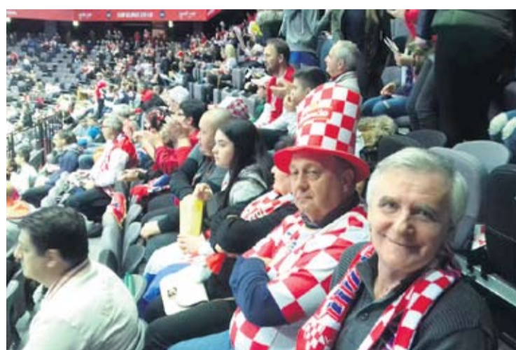
Virovitički navijači na svojim mjestima u dvorani

Sve je bilo spremno za najveći sportski susret dana, susret vječnih rivala Hrvatske i Srbije. U svim sportovima njihovi susreti uvijek izazivaju dodatni naboj u gledalištu. Dvorana je bila ispunjena do posljednjeg mjesta. Rasvjeta prigušena, a u pozadini čula se službena himna prvenstva. Nema navijača koji se nije naježio odmah po ulasku u Spaladium Arenu, a ni igrača koji u toj situaciji nije dobio poriv dati sve od sebe i učiniti