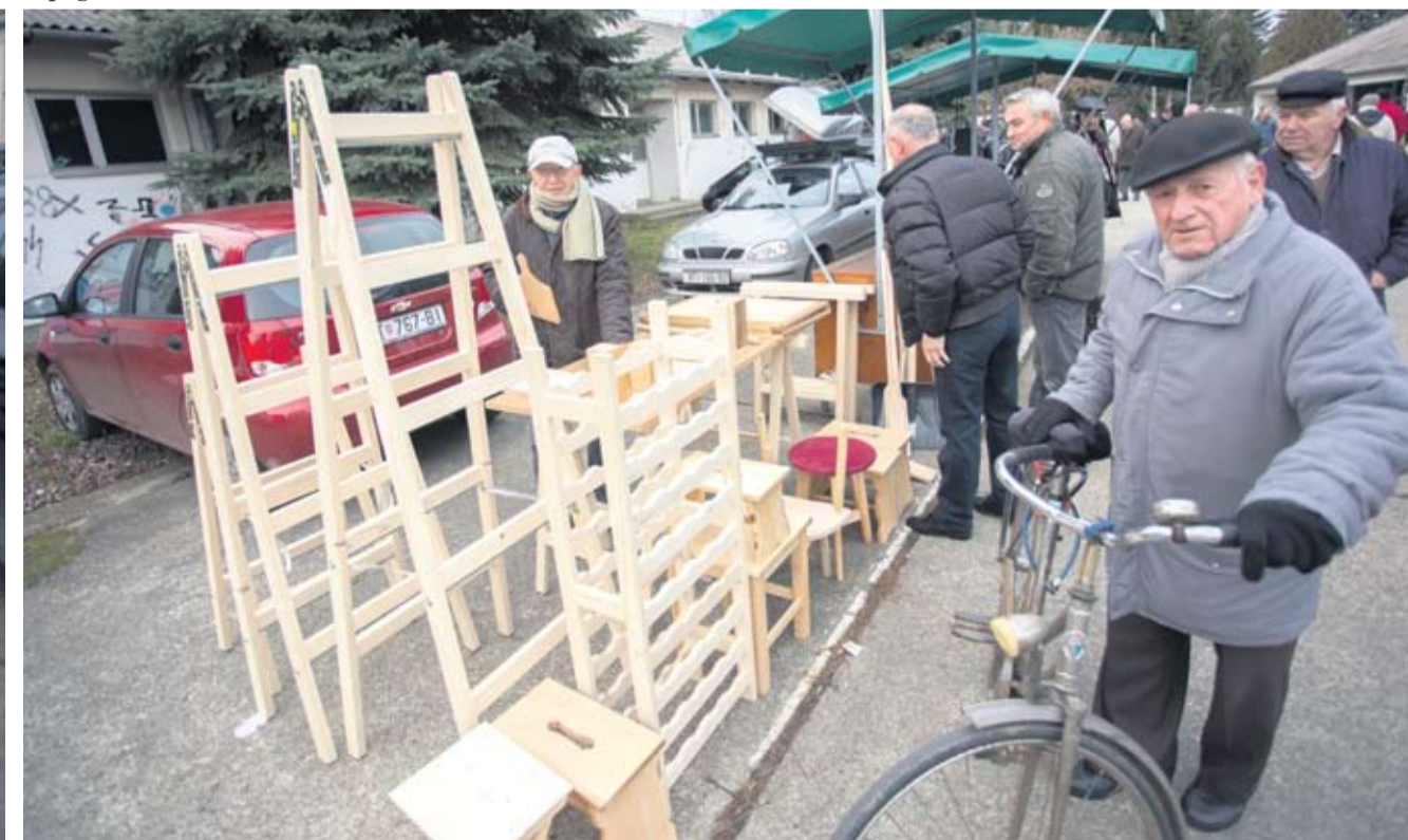
Ručno izradeni radovi uvijek privlače pozornost kupaca