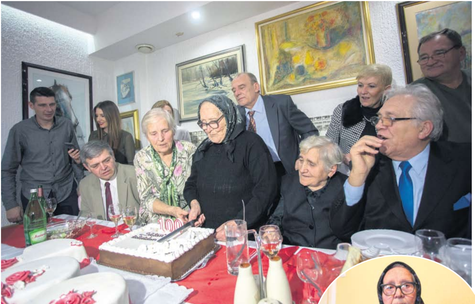
Stoti rođendan svojoj Mili poželjeli su mnogobrojni članovi obitelji