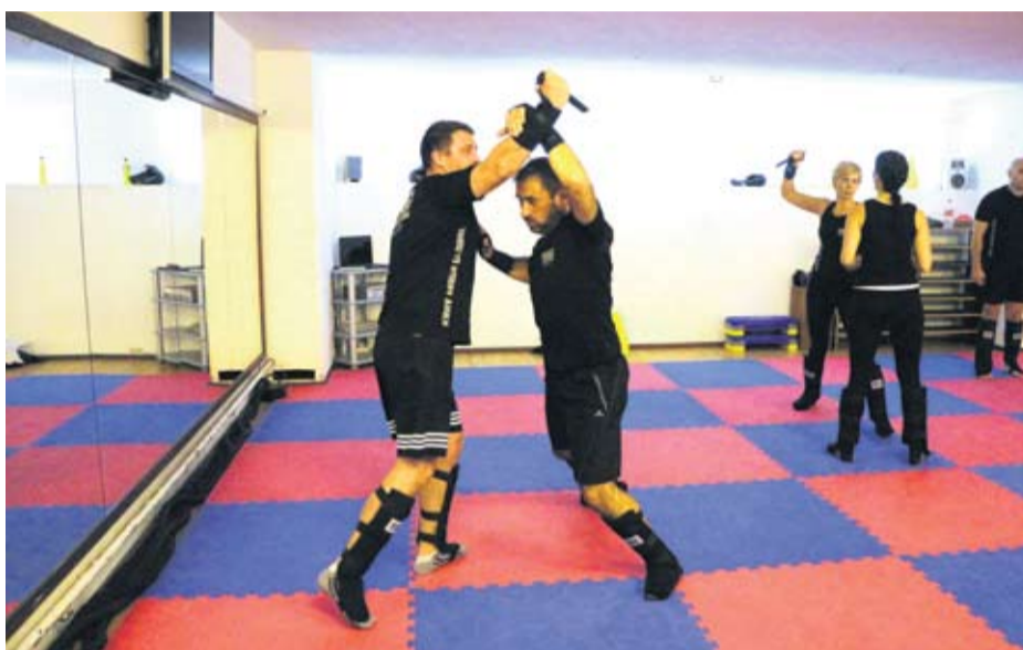
Krav Maga podiže samopouzdanje, formu, reakciju

- Sve je dopušteno, čak i one najbrutalnije stvari, poput udaraca u najosjetljivija mjesta: oči, grkljan, ispod pazuha, genitalije, koljena. Dozvoljeni su i ugrizi, ubodi prstima u oči. Sve je dopušteno kako biste sačuvali svoj život i iz borbe izašli sa što manje ozljeda - kaže instruktor Nikola. Disciplina koja je utemeljena u dalekom Izraelu, nastala pod pritiskom realnih