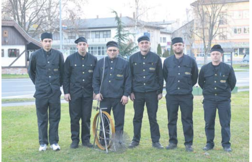
Dimnjačari obrta Dimko d.o.o. rade na četiri županije

o vrsti goriva za loženje, dimnjaci danas rade od šamotnih, keramičkih i inoks materijala. Osim toga, iz svog iskustva dimnjačari ističu kako su često svjedoci neispravne montaže, nagorjelih dimnjaka, neprilagođenih tavan-skih prostorija i posebno neispravnih kondenzacijskih ložišta, poput plinskog. Sve su to posljedice nesavjesnih građana koji ne slušaju savjete dimnjačara ili smatraju da je obvezni redovni pregled – nepotreban. Sa željom da uštede građani nerijetko angažiraju i privatne majstore ili službe da, primjerice, posao zamjene ložišta ili gradnje dimnjaka obave “na crno”. Iako je taj potez jeftiniji, rezultat može biti poguban ne samo za ljude, nego i za životinje i materijalna dobra. “Ljudi u crnom” stoga upozoravaju da je