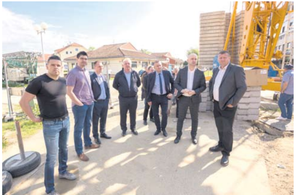
U obilasku bolnice

• Uskoro ćemo nabaviti i uređaj za magnetsku rezonancu (MR) koji će također pomoći da pacijenti koji se liječe u virovitičkoj bolnici imaju kvalitetnu skrb. Dakle, i po tom pitanju ne brinemo se samo za građane većih gradova, nego i za uvjetno rečeno ruralna područja, poručio je T. Tolušić