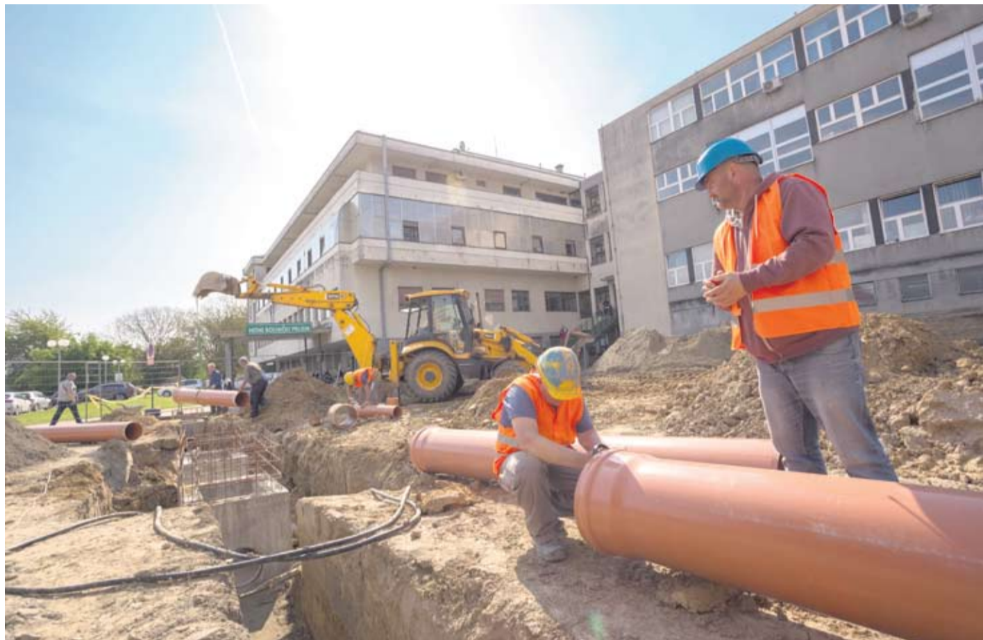
Radovi napreduju prema planu

Grad Virovitica izlaže na javni uvid Prijedlog Programa raspolaganja poljoprivrednim zemljištem u vlasništvu države na području grada Virovitice. Javni uvid bit će moguć svakim radnim radom od 9 do 13 sati od 25. travnja do 9. svibnja u prostorijama Grada Virovitice, Trg kralja Zvonimira 1, I. kat, soba br. 125. Zainteresirane osobe mogu dati prijedlog Programa najkasnije do isteka javnog uvida. O svim prigovorima odlučivat će Gradsko vijeće Grada Virovitice u roku od 30 dana. Prigovori na Prijedlog Programa raspolaganja poljoprivrednim zemljištem u vlasništvu Republike Hrvatske na području grada Virovitice moraju biti čitko napisani, uz ime, prezime, i adresu podnositelja, te se dostavljaju u pisarnici Grada Virovitice, Trg kralja Zvonimira 1, Virovitica, zaključno s 9. svibnja 2018. godine.