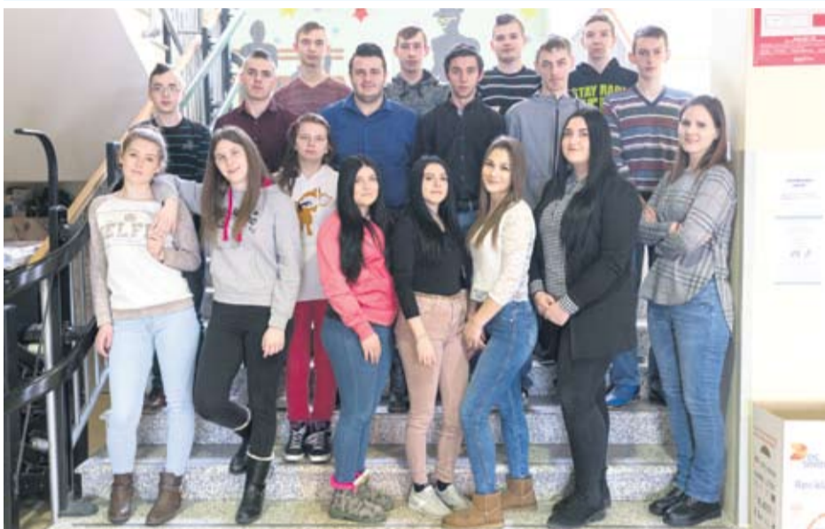
Strukovna škola Virovitica - III. g konobari i slastičari