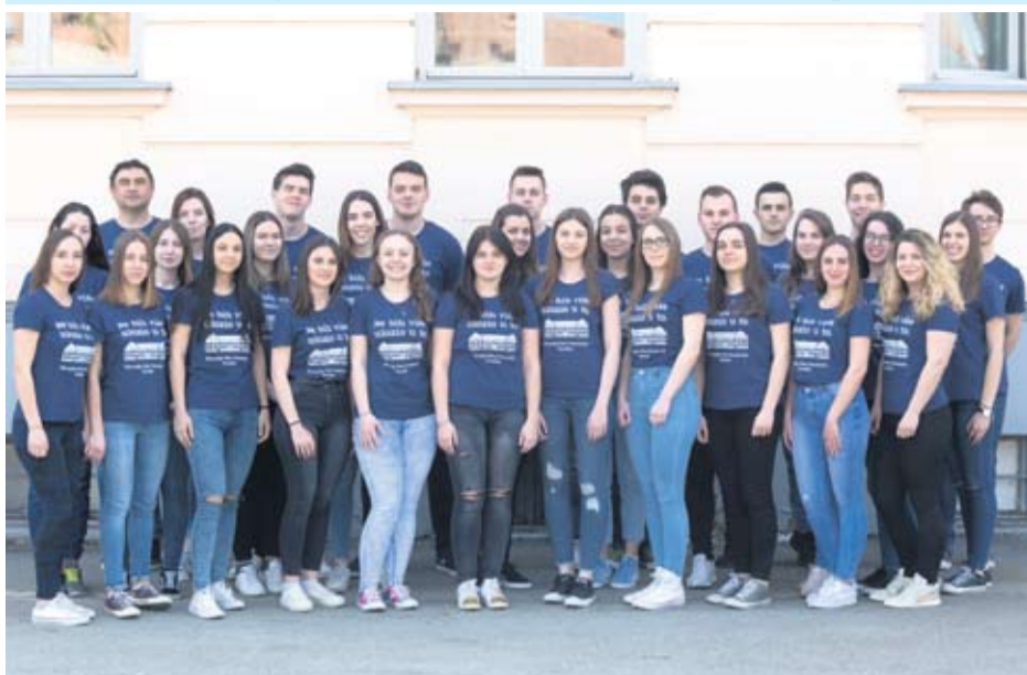
Gimnazija Petra Preradovića Virovitica - IV. a opća