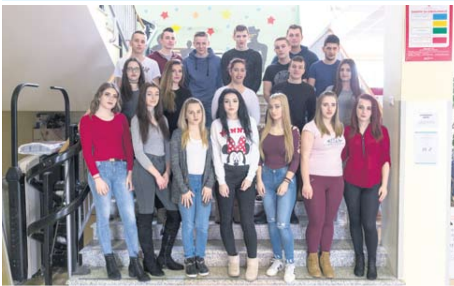
Strukovna škola Virovitica - III. e prodavači