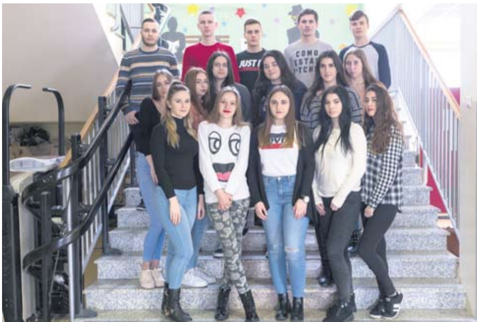
Strukovna škola Virovitica - IV. b ekonomisti