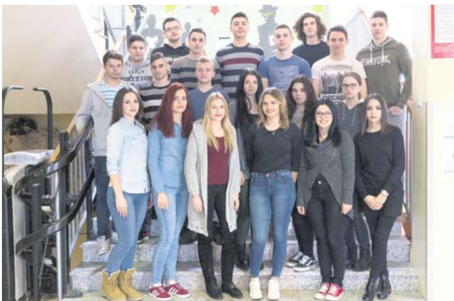
Strukovna škola Virovitica - IV. d turističko-hotelijerski komercijalisti