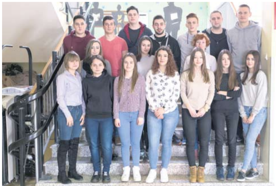
Strukovna škola Virovitica - IV. c komercijalisti