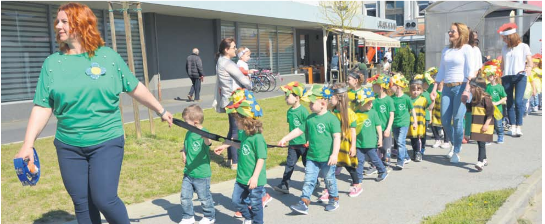
FESTIVAL PROLJEĆA PITOMAČA 2018.