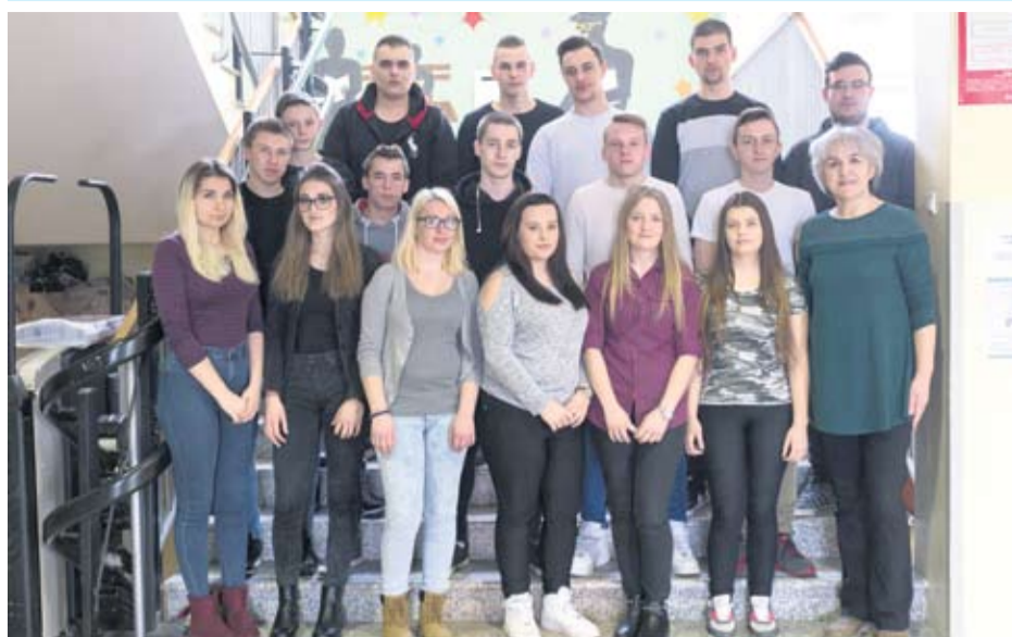
Strukovna škola Virovitica - III. f kuhari