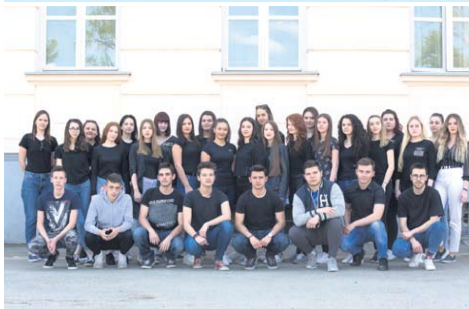
Gimnazija Petra Preradovića Virovitica - IV. b opća