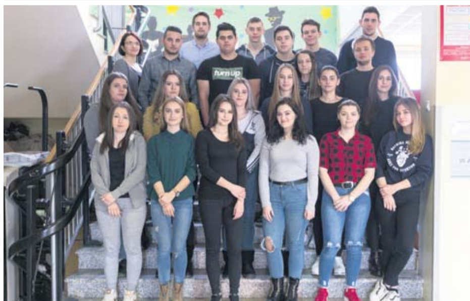
Strukovna škola Virovitica - IV. a ekonomisti