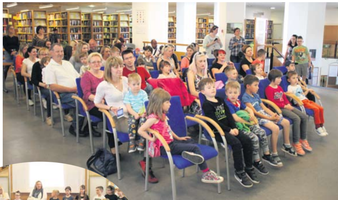
Noć knjige okupila brojne zainteresirane

● Ovogodišnja tema manifestacije je literatura u odnosu na nove tehnologije pa smo i mi svoj program prilagodili tome, rekla je prof. Višnja Romaj