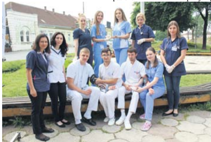
Međunarodni dan sestinstva obilježio se i akcijom ispod gradskog sata

- Ovo je dan kada imamo priliku podići svijest javnosti o tome što, koliko i u kakvim uvjetima radimo. Malo nas je u odnosu na zapadne zemlje, potplaćeni smo pa sve više medicinskih djelatnika iseljava - rek-