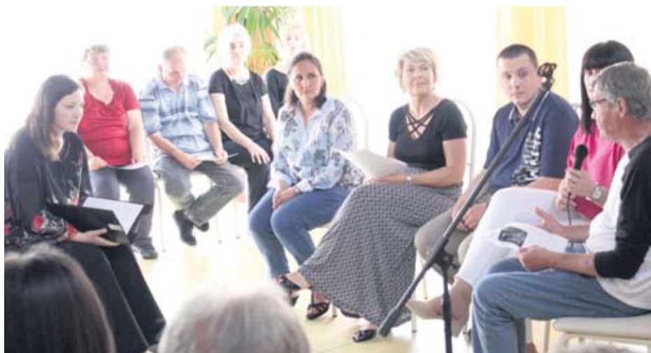
MEĐUNARODNI DAN OBITELJI U DOMU ZA ODRASLE BOROVA

Uz sve navedene obveze ovaj dvojac sudjeluje i u organizaciji sportskog spektakla Papuk extreme challenge u Orahovici, sve popularnijem sportskom događaju koji na kvaliteti raste i zahvaljujući njihovim rezultatima.