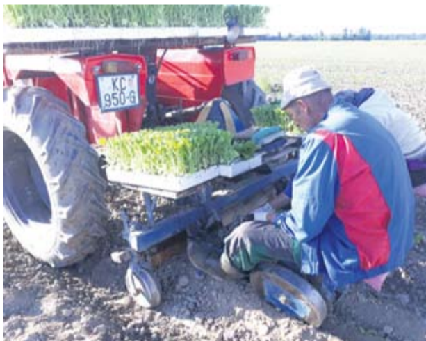
Sezona sadnje duhana je pred završetkom

ARBORETUM LISIČINE MEĐU NAJMLAĐIMA JE U HRVATSKOJ I SKRIVA BLAGO OD ČAK 520 BILJNIH VRSTA