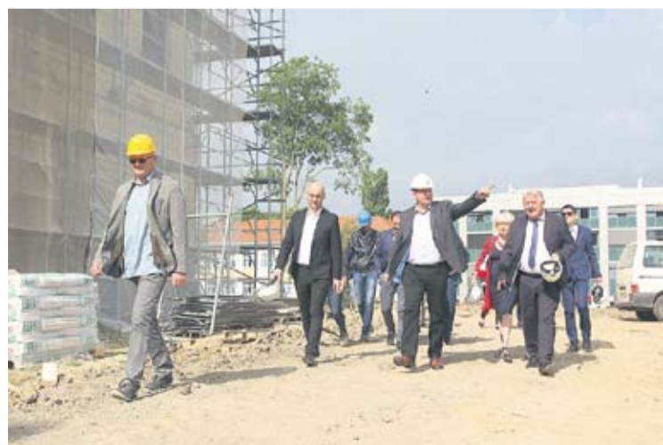
Obilazak radova na području grada