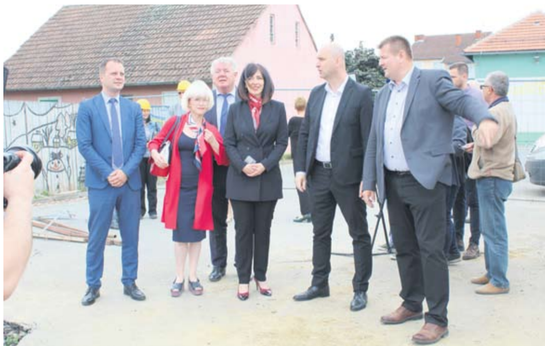
Ministrica Divjak upoznala se s projektom izgradnje COOR-a

ponuditelja Domogradnja d.o.o. i Brana d.o.o., a za sportsku dvoranu Zajednica ponuditelja Izgradnja Futura d.o.o. i Zagrebgradnja d.o.o. iz Donjeg Stupnika. Trodijelna dvorana,