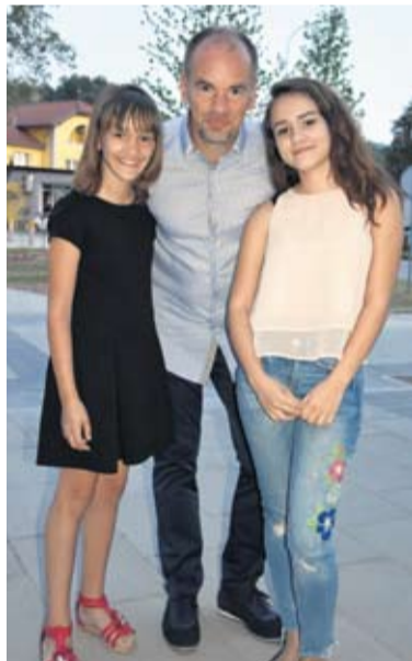
Tata i njegove kćeri koje uživaju u eurovizijskom tjednu kod kuće

- A što se tiče moje najbolje pjesme, pa ima ih puno, počevši od „Hold me now“ Johnnija Logana, „Gente