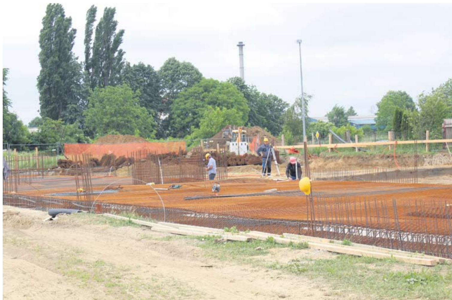
Radovi na izgradnji nove zgrade COOR-a

● Uvjeren sam da će novi Centar, odnosno osiguravanje prostornih uvjeta, pored educiranih ljudi koji rade s djecom s teškoćama u razvoju, pridonijeti podizanju razine cijele usluge, kazala je ministrica Blaženka Divjak u Virovitici