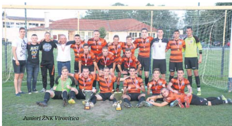
Juniori ŽNK Virovitica