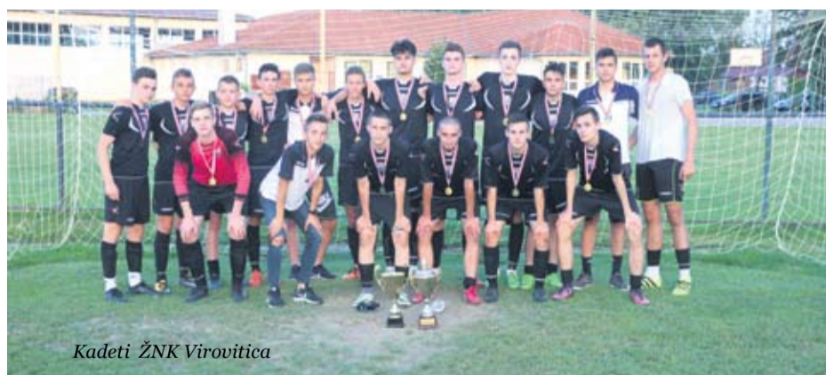
Kadeti ŽNK Virovitica