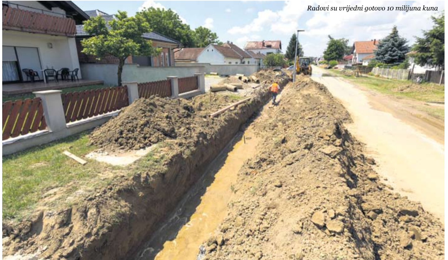
Radovi su vrijedni gotovo 10 milijuna kuna

Ministarstvo graditeljstva i prostornoga uređenja odobrilo je Gradu Virovitici u sklopu Javnog poziva za sufinanciranje izrade prostornih planova jedinica lokalne i regionalne samouprave u 2018. godini izradu Urbanističkog plana uređenja Novo groblje. Projekt je prijavila Razvojna agencija VTA, a Gradu je za isti odobreno 21.750,00 kuna. Radi se o proširenju i modernizaciji virovitičkog Gradskog groblja, a cilj je postići preglednost prostora, riješiti nedostatak grobnih mjesta te poboljšati funkcioniranje prometne infrastrukture.