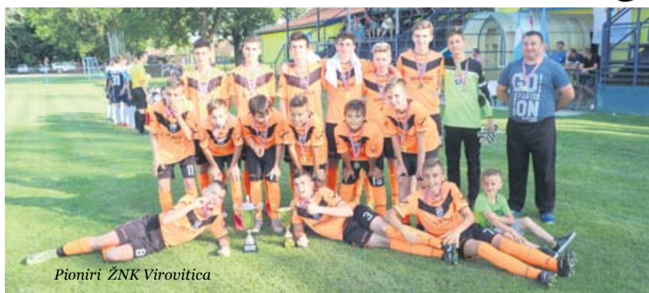
Pioniri ŽNK Virovitica

Prošlog tjedna na stadionu „Želimir Romić“ u Gornjem Bazju odigrane se finalne utakmice Županijskog nogometnog kupa za mlade uzrasne kategorije. U svim kategorijama pobijedili su nogometaši Virovitice.