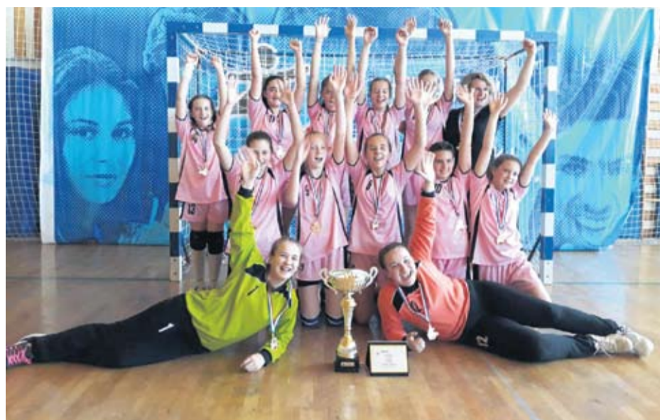
Rukometašice IBM-a prvakinja Hrvatske