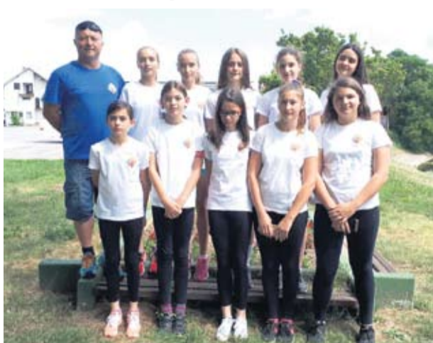
Atletičarke IBM-a prvakinja Hrvatske

Mlade rukometašice tako su nakon klupske državne završnice i na školskoj završnici pokazale da pripadaju vrhu ženskog ru-