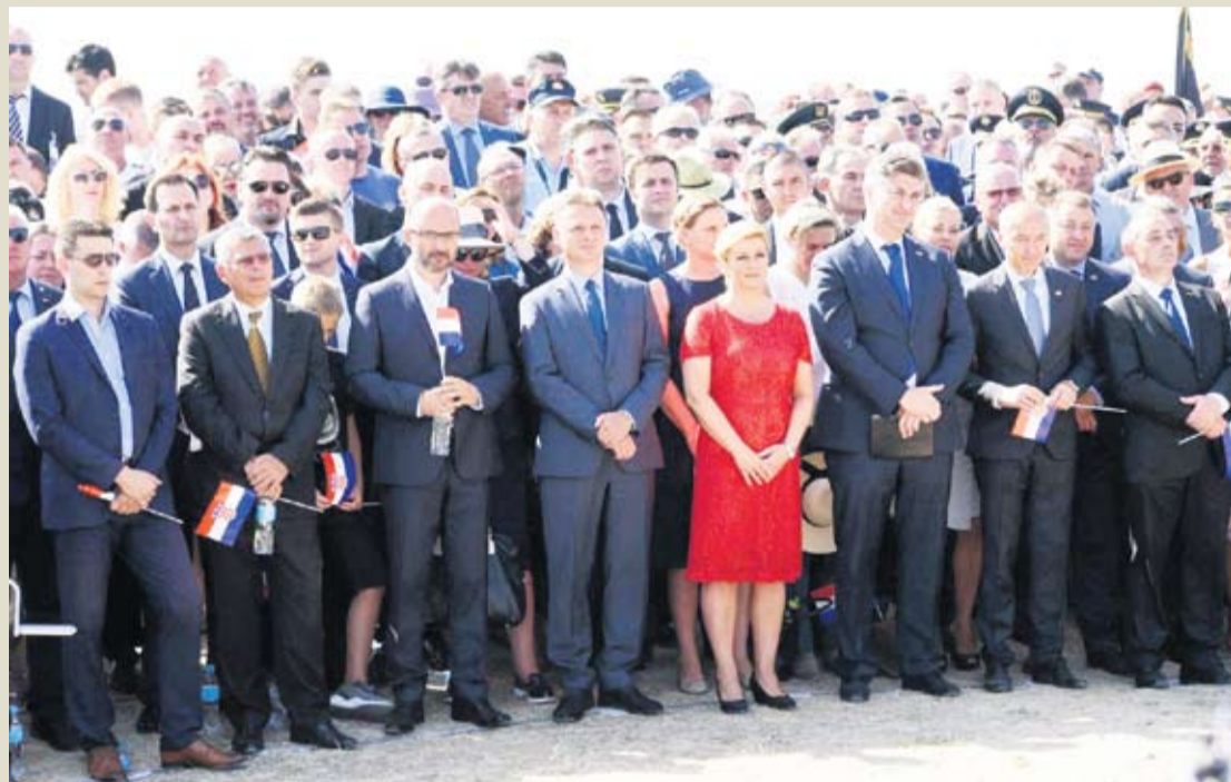
U Kninu uvijek i najviši državni dužnosnici

Pogibija ove šestorice pripadnika elitnih postrojbi HV-a, od kojih su trojica bila iz istog sela, bila je težak udarac za njihove suborce i obitelji, ali i za cijeli virovitički kraj. Olujom su hrvatske postrojbe oslobodile okupirani teritorij RH u sjevernoj Dalmaciji, Lici, Banovini i Kordunu (ukupno oko 10.500 km 2 ) i izbile na državnu granicu te omogućile Armiji Bosne i Hercegovine da razbije srpsku opsadu Bihaća.