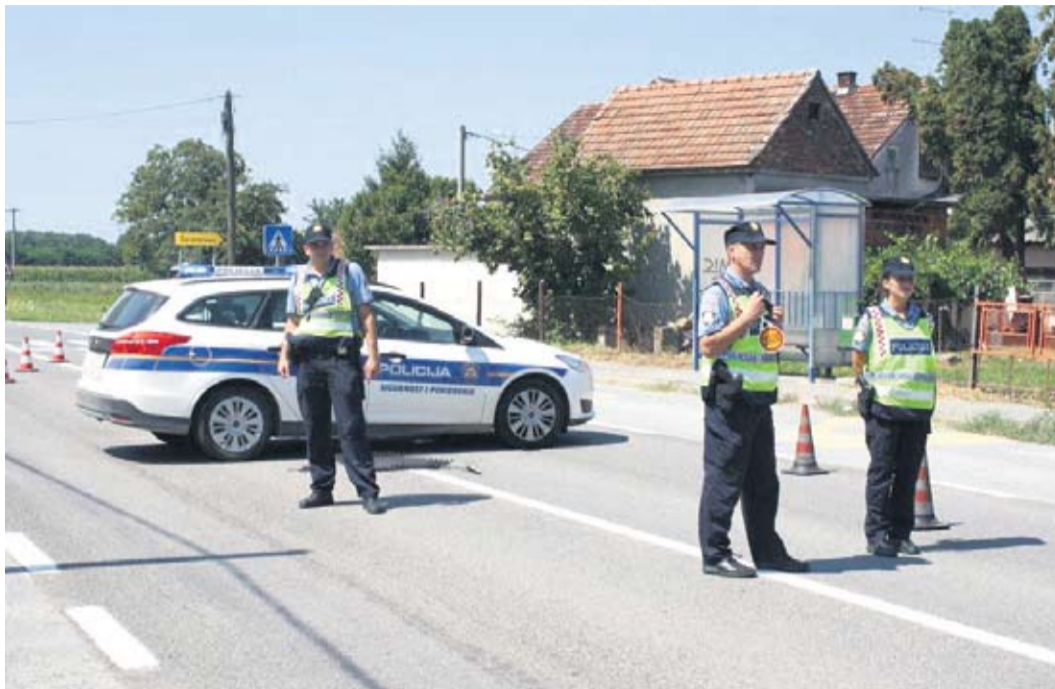
U akciji prekogranične potjere uspješni i djelatnici PU Virovitičko-podravске

U navedenoj vježbi sudjelovali su policijski službenici Virovitičko-podravске i Somogy županije. Simulirano je