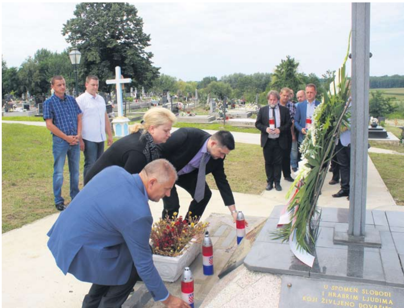
Odavanje počasti poginulim hrvatskim braniteljima

– Na području općine najviše me veseli projekt izgradnje dječjeg vrtića. Najveći projekt, koji Županija na ovoj općini provodi je izgradnja sustava navodnjavanja Novi Gradac-Dečkovac. Ovaj sustav navodnjavanja doprinijet će bržem razvoju poljoprivrede na području vaše općine i omogućiti proizvodnju dohodovnijih kultura nego što su se proizvodile do sada - kazao je između ostaloga župan Igor Andrović. Čestitku domaćinima uputio je i saborski zastupnik Josip Đakić. – Kao saborski zastupnik uvijek ću biti na usluzi vašoj općini jer se u slozi i zajedništvu mnogo toga može učiniti – istaknuo je J. Đakić i iskoristio priliku da javno čestita Vatrenima na povijesnom rezultatu, srebru na Svjetskom nogometnom prvenstvu. Uz članove Općinskog vijeća i predstavnike udruga, svečanoj sjednici prisustvovali su zamjenici župana Marijo Klement i Darko Žužak, gradonačelnik Virovitice Ivica Kirin i njegov zamjenik Damir Marenić.