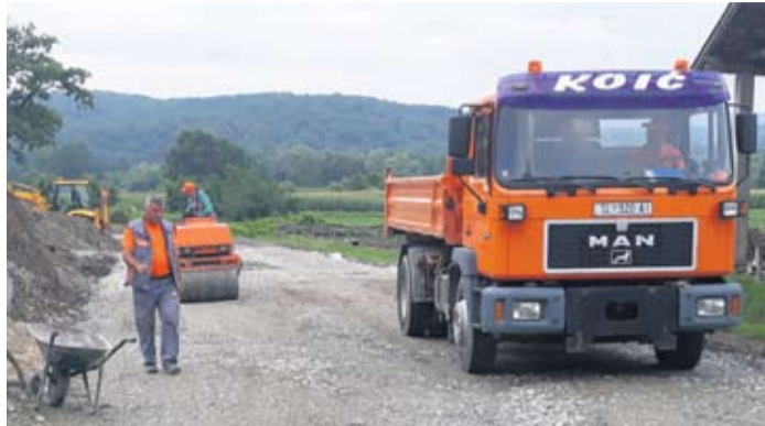
Radovi traju na pristupnoj cesti, parkiralištima i kući oprostaja

- U suradnji sa županijskom Razvojnog agencijom VIDRA prijavili smo projekt Ministarstvu poljoprivrede, odnosno Agenciji za plaćanje u poljoprivredi, ribarstvu i ruralnom razvoju. Radi se o projektu poboljšanja infrastrukture, točnije o izgradnji i rekonstrukciji dijela ceste u Četkovcu prema pilani Jaklić i OPG-u Tonc. Vrijednost same investicije je 364.000 kuna, a ukupni trošak cijelog projekta, dakle s projektnom dokumentacijom, iznosi 370.000 kuna. Sredstva smo dobili u stopostotnom iznosu i mogu reći da je ovo projekt od velikog značaja