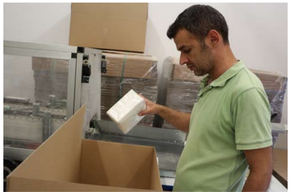
U tvrtki zbog obima posla razmišljaju o uvođenju još jedne smjene