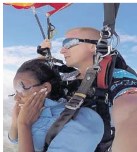
Nezaboravan pogled s 4000 m visine