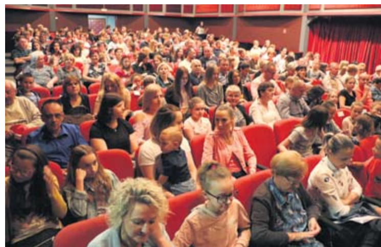
Mnogobrojna publika uživala je u predstavama