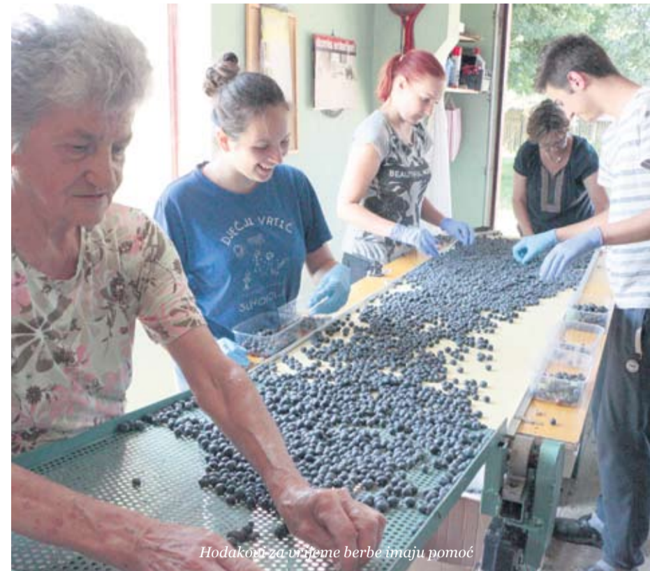
Hodakovci za vrijeme berbe imaju pomoć