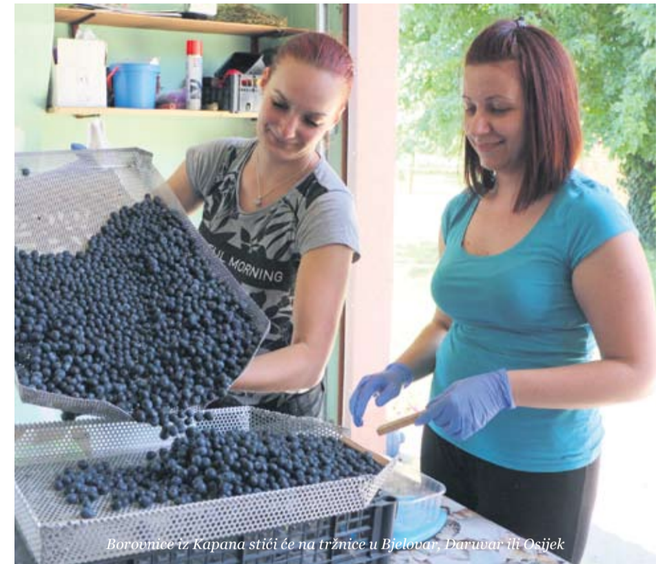
Borovnice iz Kapanu stižu na tržnice u Bjelovar, Daruvar ili Osijek