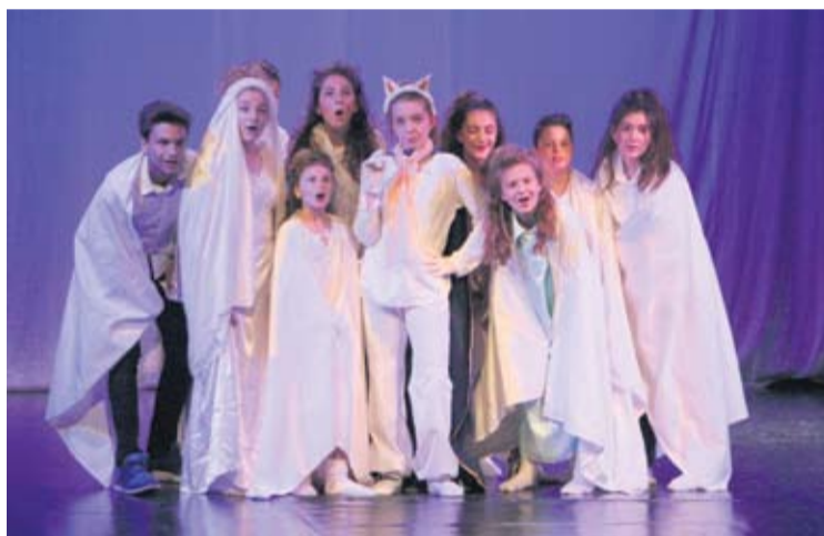
Duhovi vanzemaljci oduševili publiku