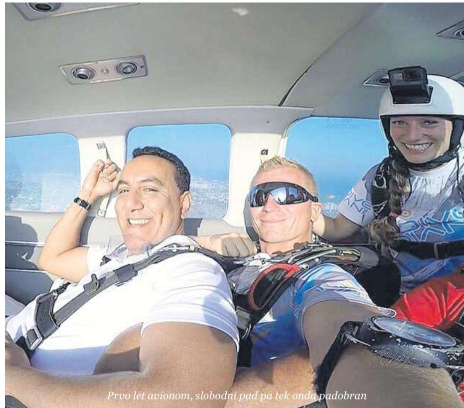
Prvo let avionom, slobodni pad pa tek onda padobran