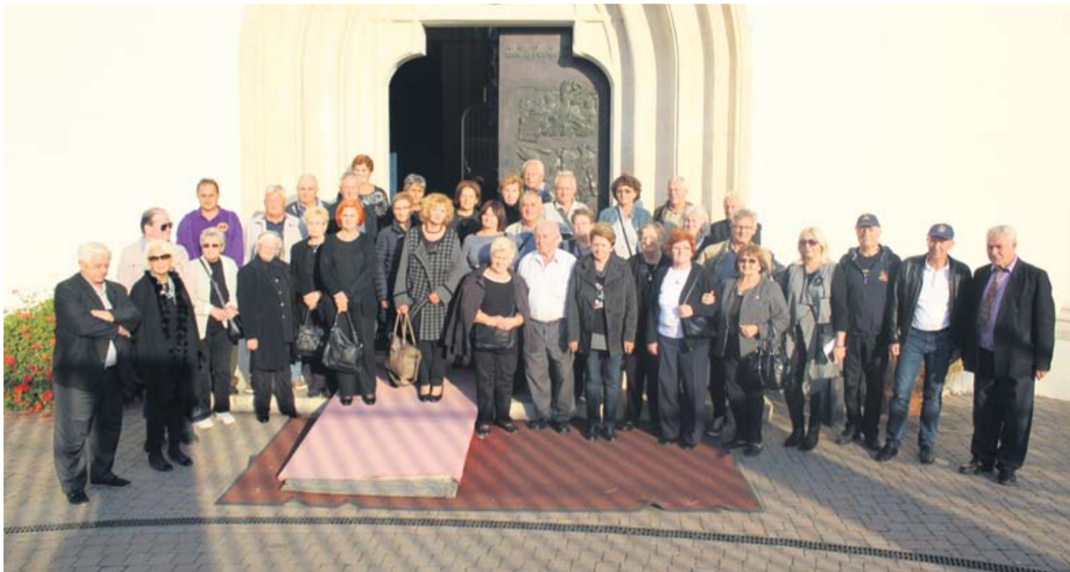
Susretima roditelji čuvaju uspomenu na svoje najmilije