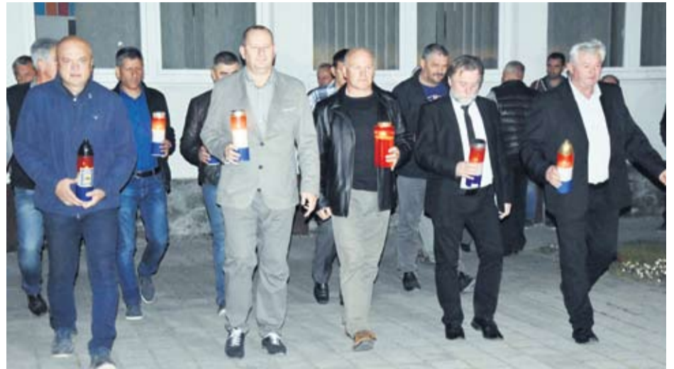
Sjećanje na žrtve Domovinskog rata

Svečanost je otvorio predsjednik Udruga hrvatskih branitelja Domovinskog rata Policijske