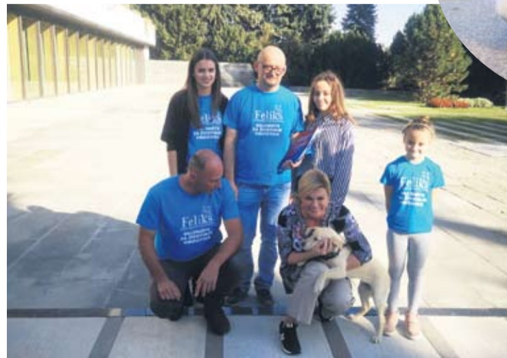
Volonteri virovitičkog Skloništa dovezli su Kiku Predsjednici

trunku pažnje – poručuju volonteri te dodaju da svaka priča ima dobre i loše strane. Njihova je jasna - ako ovaj predsjedničin potez potakne i dvoje ljudi da se umjesto kupovine odluče na udomljavanje, spasit će time čak četiri nesretne duše: dvije će njuške dobiti dom, a dvije će biti spašene s ulice i zauzeti njihovo mjesto u skloništu. Kako kažu, cilj im je cijelo društvo potaknuti na razmišljanje o zaštiti životinja i udomljavanju i svaki udomitelj je dobrodošao.