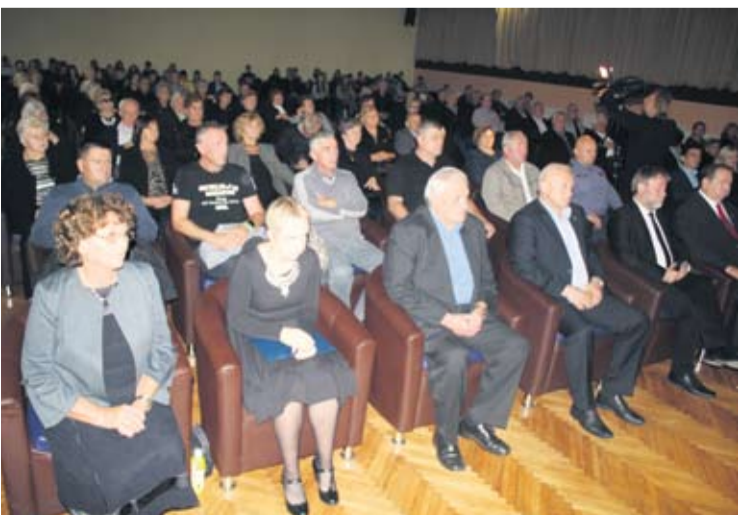
Sa susreta i tribine u Virovatici

MJEŠANKU IZ VIROVITIČKOG SKLONIŠTA ZA ŽIVOTINJE U SRIJEDU JE UDOMILA PREDSDJEDNICA KOLINDA GRABAR-KITAROVIĆ