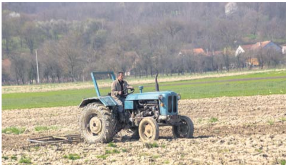
Ratari mogu biti zadovoljni

● Ova godina, kako je više puta bilo i istaknuto, bila je vremenski vrlo nepredvidiva. Unatoč tome, godina je bila zadovoljavajuća, a za neke poljoprivrednike, koji većinom uzgajaju kukuruz, i vrlo dobra - kaže Z. Pleša.