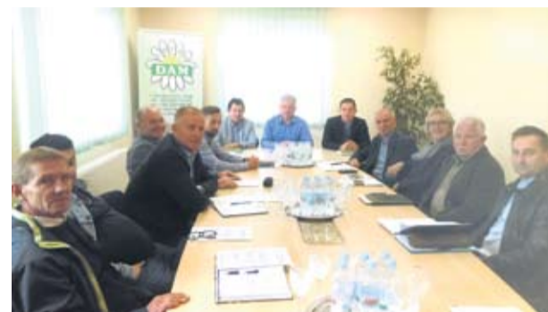
Strukovna grupa agrara

jedan od najvećih, rješava se ulaganjem u najsuvremeniju poljomehanizaciju, ali se time i povećavaju proizvodni troškovi, istaknuli su članovi Strukovne grupe. Nedostaje radnika u proizvodnji duhana, vinogradarstvu, povrtlarstvu te drugim granama poljoprivrede. Uz navedeno, među najvećim