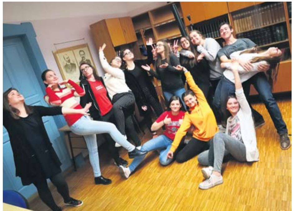
Zabavno, poučno, inspirativno je na satu dramske

Opće gimnazijsko usmjerenje ima do 17 predmeta, a ovo je jedan od sati gdje mogu pokazati svoju kreativnost i na trenutak zaboraviti na probleme i gradivo koje moraju učiti jer drama uz sve to nema ni pisanih zadaća. Profesorica ih ocjenjuje prema dvama elementima – iskaz i pokret. – Iskaz podrazumijeva njihovu sposobnost osmišljavanja priča, odnosno njihovu kreativnost, improvizaciju i sadržajnu razinu nastupa, dok je pokret način izvedbe, odnosno fizički aspekt samog javnog nastupa – zadovoljno objašnjava profesorica kojoj je ovo terapijski predmet na kojem, nakon predavanja gramatike i pravopisa, nastoji opustiti učenike i razviti im ljubav prema