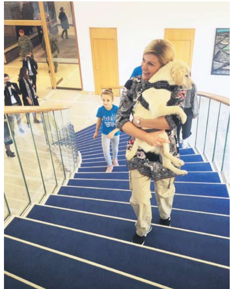
Predsjednica je Kiku u zagrljaju povela Pantovčakom

● Otkako su saznali da Kika dolazi, svi na imanju s radošću su je iščekivali, svi je žele čuvati, napravili smo detaljan raspored, tako da ni u jednom trenu neće biti sama – najavila je predsjednica Kolinda Grabar-Kitarović.