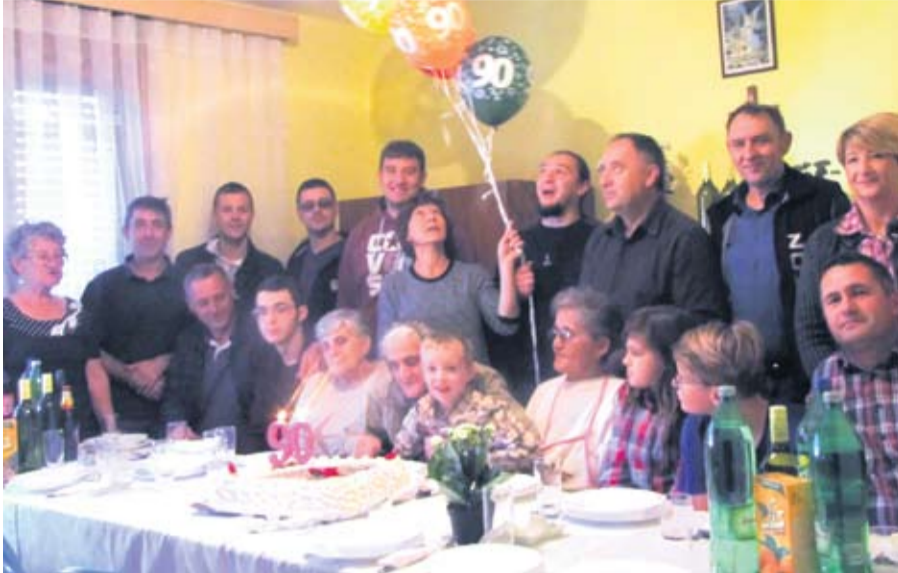
Vesela proslava 90. rođendana