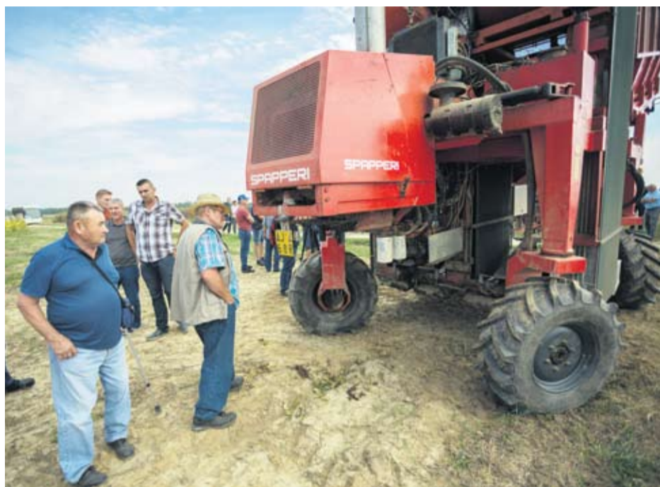
Kooperanti su zainteresirani za strojni berač