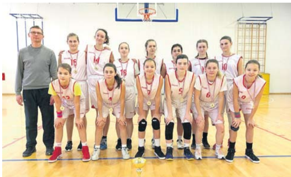
ŽKK Virovitica U-17.

Županijski rukometni savez, uz kup natjecanje u seniorskoj konkurenciji, organizirao je ligu za mlađe uzraste u konkurenciji djevojčica, Memorijalni turnir u mini rukometu Vilim Tičić te je pomogao klubovima u organizaciji sličnih turnira za mlađe uzraste. U suradnji s Hrvatskim rukometnim savezom u idućoj sezoni planiraju još nekoliko uspješnih akcija. Jedna je uspješna rukometna godina iza nas.