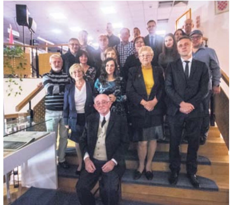
Sproslave obljetnice - umirovljeni i sadašnji djelatnici ICV-a

Nastavljamo ulagati u infrastrukturu, gospodarstvo, kulturu i znanost, a sve na dobrobit naših stanovnika. Na kraju, svim sugrađankama i sugrađanima želim radostan i blagoslovljen Božić, uz obilje mira, ljubavi, zdravlja i osobnog zadovoljstva te sretnu i uspješnu novu 2019. godinu.