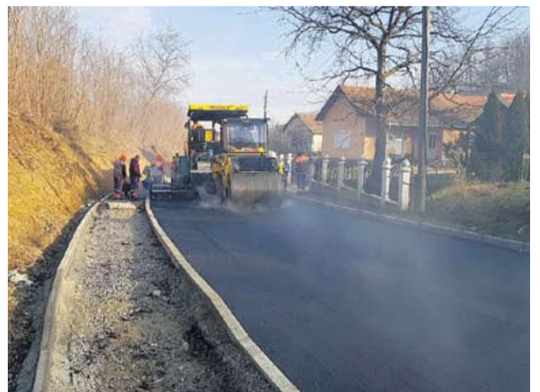
REKONSTRUKCIJA ULICE SV. KRIŽA U MILANOVCU