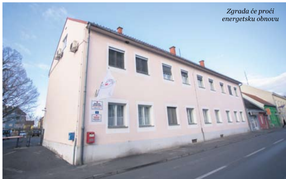
Zgrada će proći energetska obnova

obuhvaćaju izvedbu toplinskog izolacijskog sustava za fasadu, izvedbu završnog sloja fasade i toplinskih mostova, zamjenu postojeće stolarije novom PVC stolarijom i ugradnju zaštite od sunca, ugradnju kondenzacijskih kotlova te toplinske pumpe za pripremu potrošnje tople vode – istaknula je ravnateljica GDCK-a Virovitica Željka Grahovac.