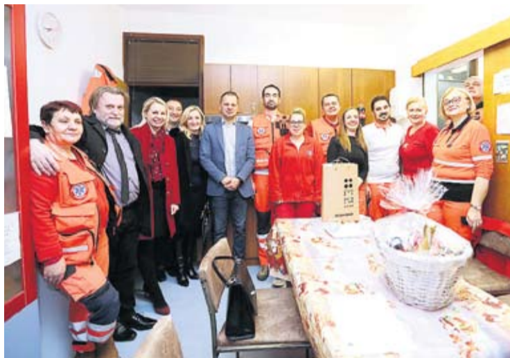
Gradski i županijski predstavnici s hitnim službama

– Svašta smo prošli u svojim životima, a kada smo se upoznali shvatili smo da je to - to. Iako smo već deset godina u vezi, dugo smo čekali da dobijemo papire za razvode i to se u 2018.