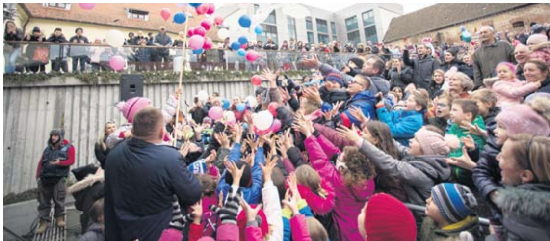
Slatku Novu dočekali su najmlađi u dvorištu palače Pejačević