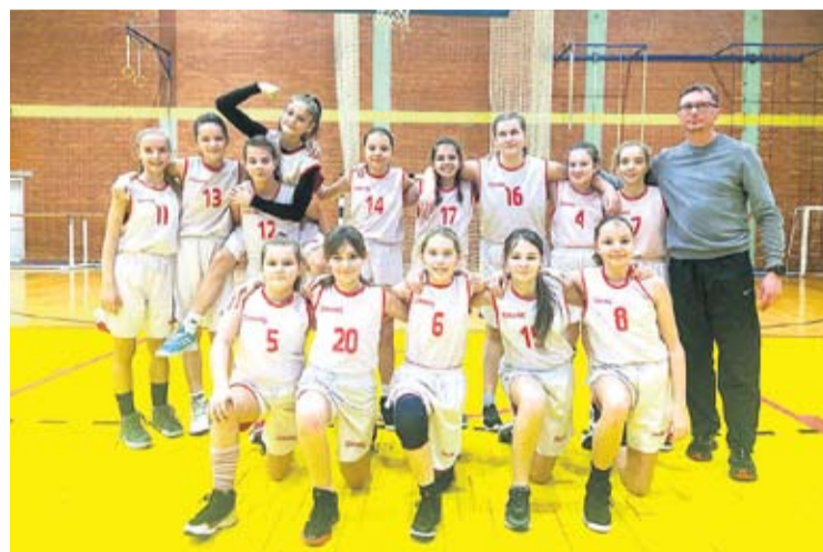
Klub niže uspjehe

je na državnoj razini. Štose tiče županije, tu i nemamo baš neku konkurenciju jer jedino čačinačka Mladost još radi s nešto mlađim djevojčicama – kazao je Robert F. te istaknuo fantastično sedmo mjesto u državi prije dvije godine te peto mjesto na državnoj razini protekle godine u selekciji U-11, ali izrazio i veliku želju da barem jedna ili dvije djevojčice završe na popisu reprezentativki što je, sudeći po radu u