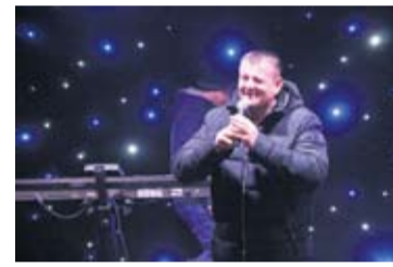
Gradonačelnik zaželio sve najbolje