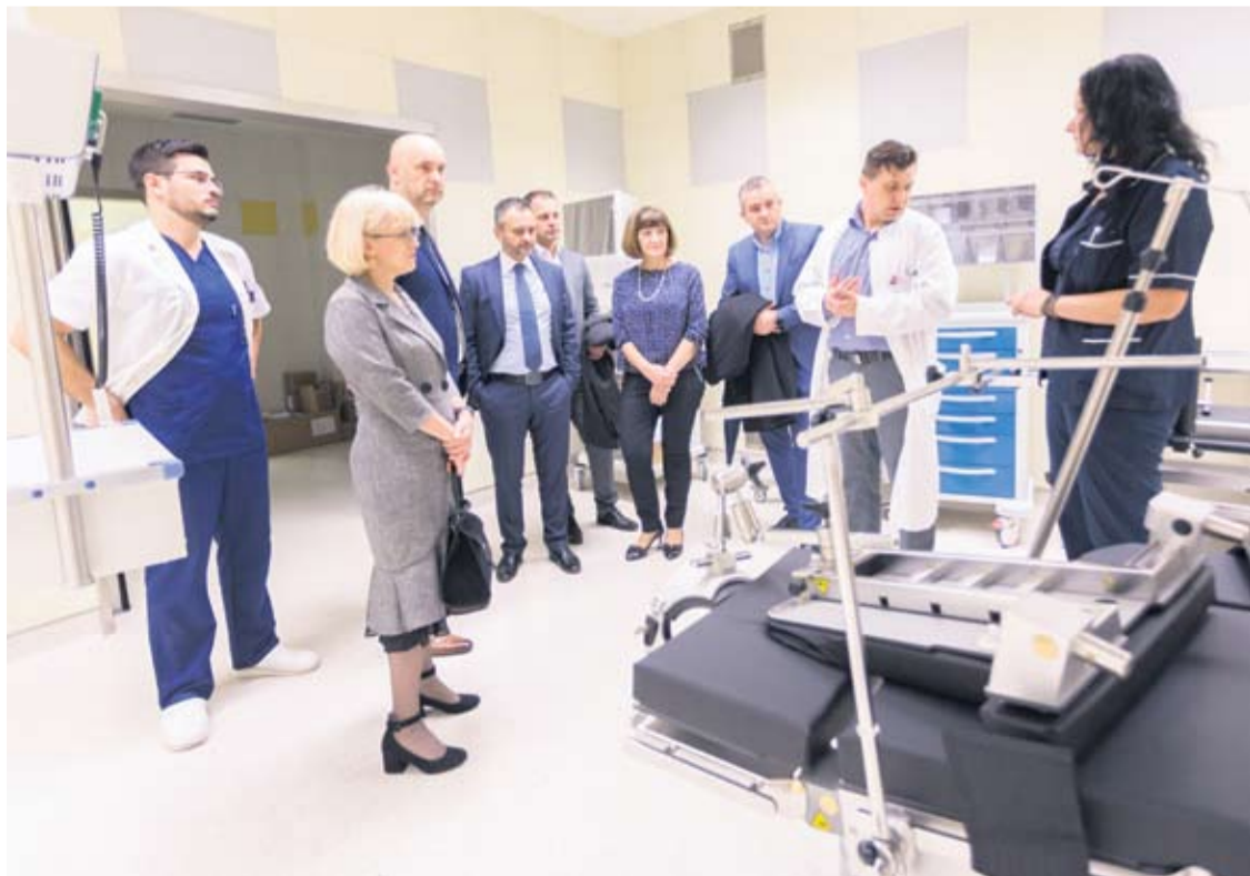
Kvalitetna oprema obradovala je liječnike