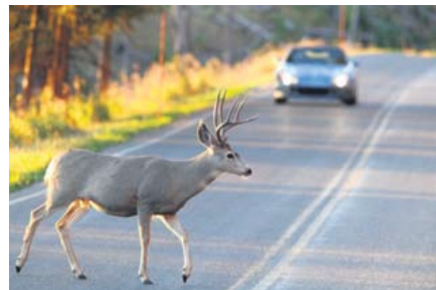
PITOMAČA I ŠPIŠIĆ BUKOVICA