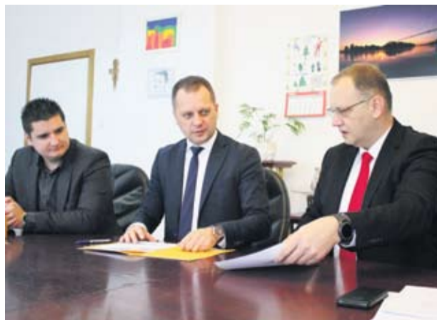
Kreditiranjem do lakše sjetve

– Osluškujući potrebe naših poljoprivrednika, a kako smo već i najavili i za što smo u proračunu Županije osig-