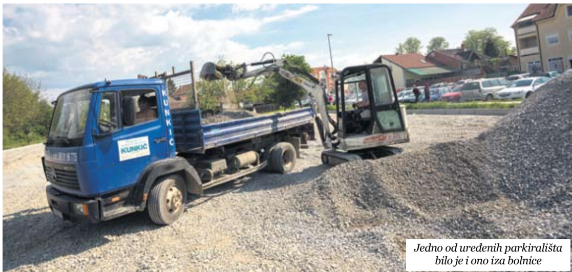
Jedno od uređenih parkirališta bilo je i ono iza bolnice

ukupno trebalo biti njih 120 – ističe M. Mustač. Od većih i već dogovorenih investicija, u planu je i novo kroviste Gradske tržnice, vrijedno oko 800.000 kuna, budući da je postojeće dotrajalo. Pet novih krovista te novu fasadu dobit će i zgrade na području grada. Ni ove godine tvrtka neće zaobići kino – za ljubitelje filmova planirana je kupnja novih, pravih „kino-stolica“, vrijednih oko 300.000 kuna, čime će se zamijeniti postojeća sjedala i gledateljima omogućiti još veći užitak u projekcijama.