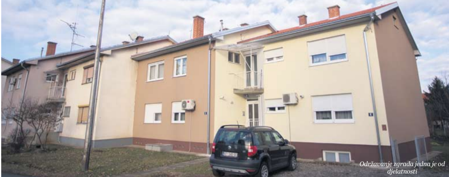
Održavanje zgrada jedna je od djelatnosti