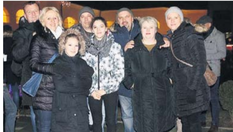
Dobro društvo, vesela atmosfera i domaće delicije prava su kombinacija za novogodišnje slavlje