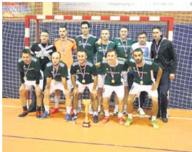
Prvoplasirana momčad Naturavita iz Pitomače

U Pitomači je nastavljena tradicija održavanja malonogometnih turnira u organizaciji Sportske zajednice općine Pitomača i Nogometnog kluba Pitomača. Tijekom vikenda u prosincu prvo su odigrane utakmice po skupinama: osamnaest momčadi bilo je podijeljeno u četiri skupine. Prvaci skupina dikretno su se plasirali u četvrtzavršnicu, dok su se drugoplasirane i trećeplasirane ekipe razigravale za ulazak među osam najboljih. Ovogodišnji turnir donio je niz uzbudljivih i zanimljivih utakmica, posebice u eliminacijskom dijelu natjecanja. U prve tri utakmice četvrtzavršnice rezultat je bio neizvjestan do posljednje minute. Igrači Caffe bara Apis nadjačali su virovitičku postavu iz Caffe bara Lav s 2:1. U najuzbudljivijoj utakmici večeri momčad Vulkanizera Jakupec bila je bolja od Letećih medvjedića iz Bušetina, pobijedivši s 4:3. Domaća Naturavita tek je u posljednjim minutama susreta svladala Top Consult rezultatom 2:1. U posljednjem susretu večeri Vina Koren bila su puno bolja od Piccolo Monda s 5:1. U prvom polufinalnom sus-