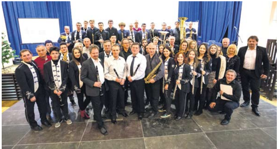
Aktivna Gradska glazba Virovitica nastupom uljepša svaku manifestaciju

• Tih 15 godina, gledano u dirigentskim godinama, zbilja je puno. Neki orkestri često mijenjaju dirigente. Sretan sam što mogu vidjeti i sudjelovati u tome da Gradska glazba još uvijek živi i da ima ljudi koji vole dolaziti svirati.