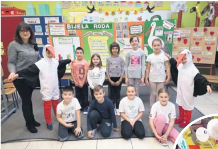
Učenici su neumorno radili na projektu „Bijela roda“