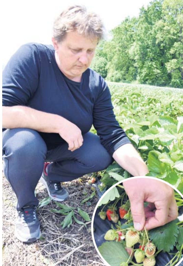
Vesna želi za stradalim urodom

- Čuli smo da je u Lonjskom polju bilo mraza, a budući da je amorfa naša sljedeća paša, bojimo se da bi i na njoj moglo biti štete jer je neotopna na mraz. No, još je rano o tome govoriti, vrijeme će pokazati što će biti s amorfom –