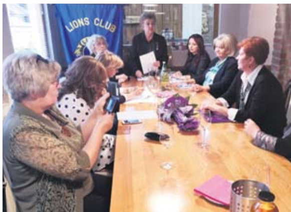
S izborne skupštine