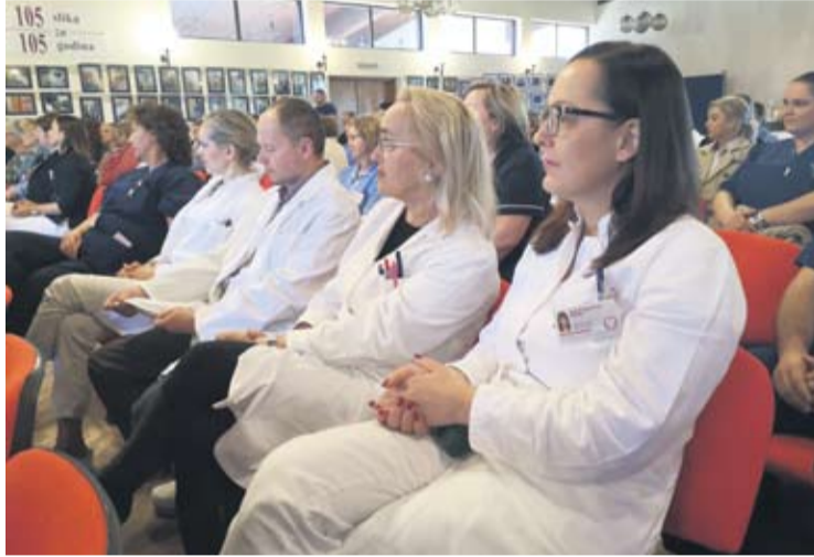
S obilježavanja Međunarodnog dana sestrinstva