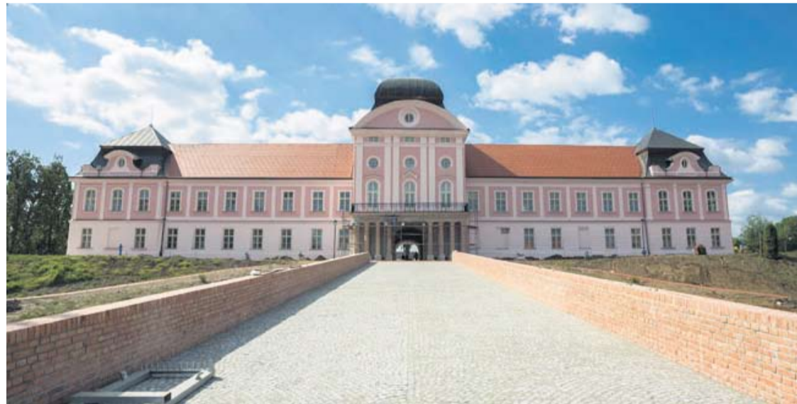
Virovitičani će po prvi put moći prošetati obnovljenim Dvorcem i parkom