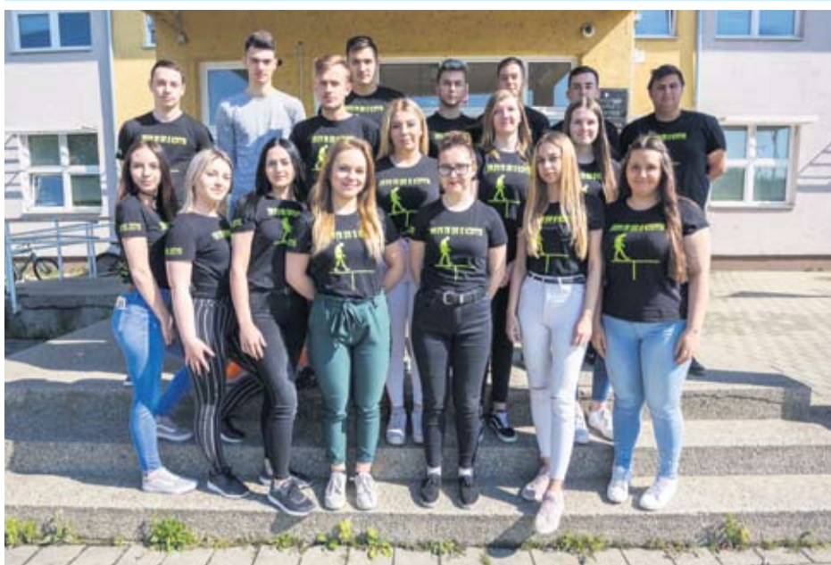
Strukovna škola Virovitica- IV. a razred - Ekonomisti