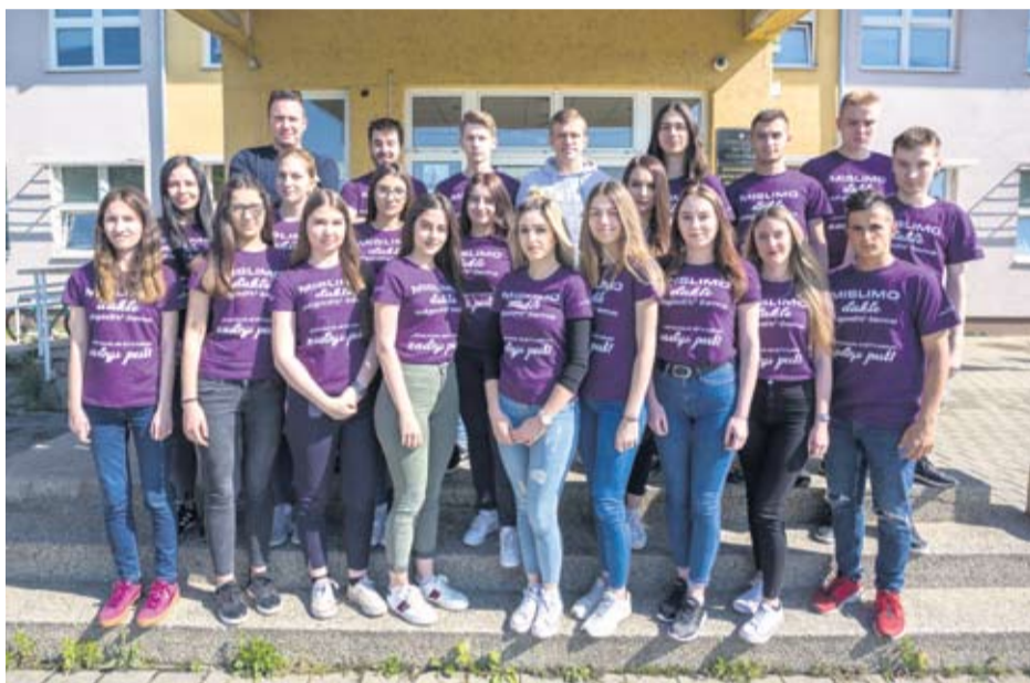
Strukovna škola Virovitica - IV. c - Komercijalisti