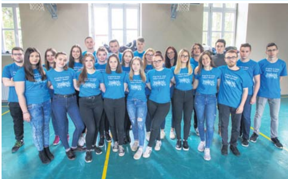
Gimnazija Petra Preradovića Virovitica - IV. a - Opća gimnazija