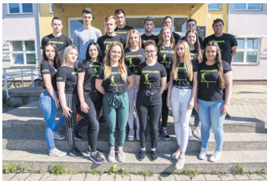
Strukovna škola Virovitica - IV. b - Ekonomisti