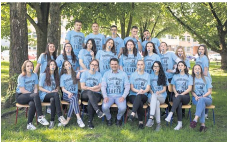
Katolička klasična gimnazija Virovitica - IV. razred