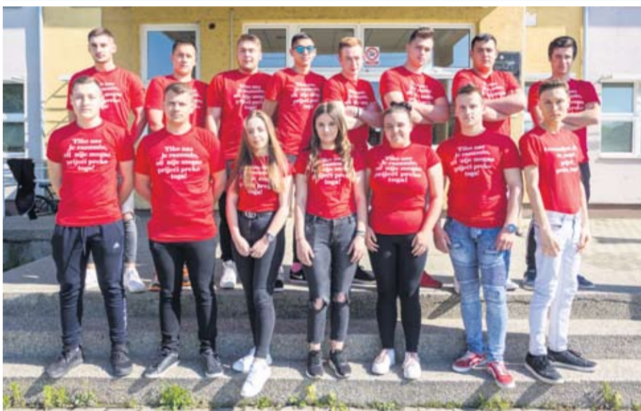
Strukovna škola Virovitica - III. f - Kuhari