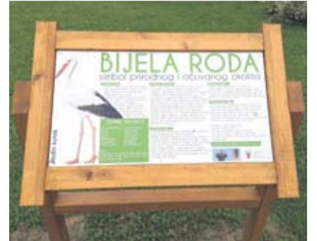
Rodin kutak postaviti će i u Bušetini

Saznao sam da je bijela roda zaštićena međunarodnim sporazumom, da se ne smiju loviti i