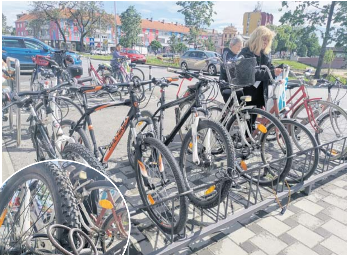
Većina bicikala u našem gradu ostaje nezaključana

Gotovo svi bicikli koji su ušli u kadar našem fotoobjektivu imali su sigurnosni lokot, ali nisu ispunjavali svoju svrhu - nekima je bio omotan oko dijela rame, a nekima je „odmarao“ u košarici s prednje