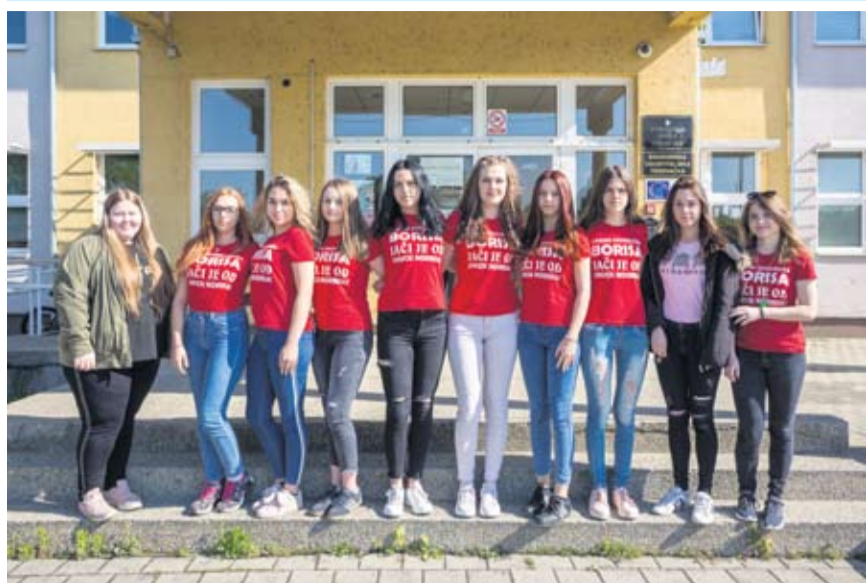
Strukovna škola Virovitica - III. e - Prodavači