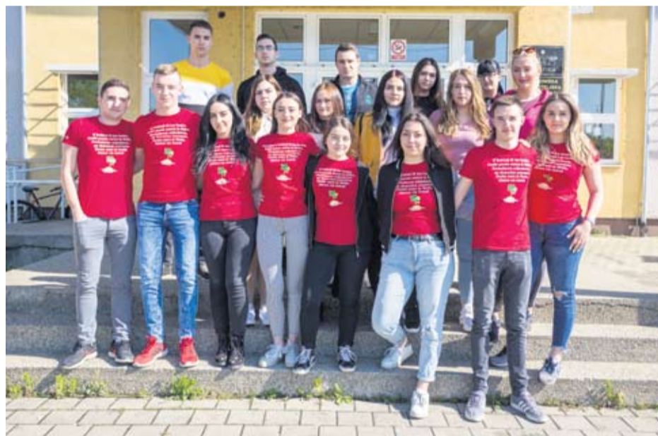
Strukovna škola Virovitica - IV. d - Turističko-hotelijerski komercijalisti