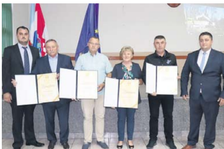
Javna priznanja zaslužnima