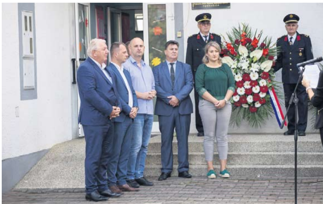
Visoki uzvanici na proslavi obljetnice