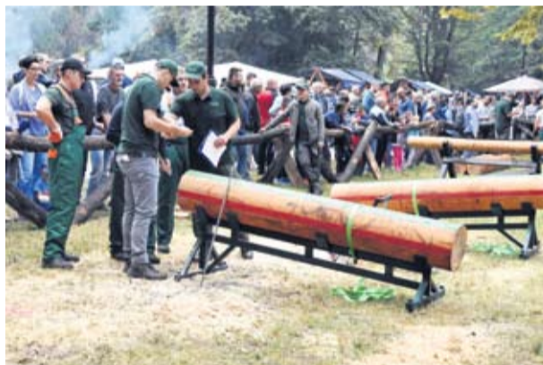
Devetnaesto izdanje festivala i ove je godine održano u prekrasnom središnjem našičkom parku

priređuju ovaj festival – rekao je Mikulić.