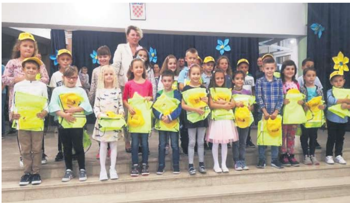
Ponosni i uzbuđeni prvašići u Nazorima