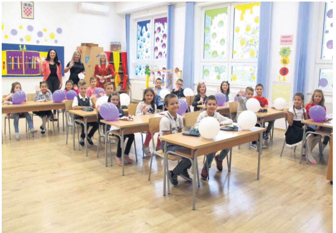
Veseli prvašići u Katoličkoj osnovnoj školi