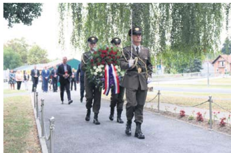
Vijenci i svijeece za sve žrtve i branitelje