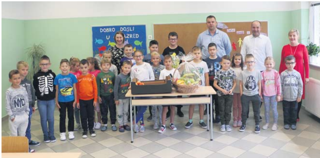
Učenici područne škole sa novim, zdravim donacijama

- U našoj županiji otprilike 36 posto djece pati od pretilosti ili prekomjerne tjelesne težine, tako da ovaj projekt je sigurno jedan mali korak prema tome da se svi osvijestimo o zdravoj prehrani – rekao je pri-