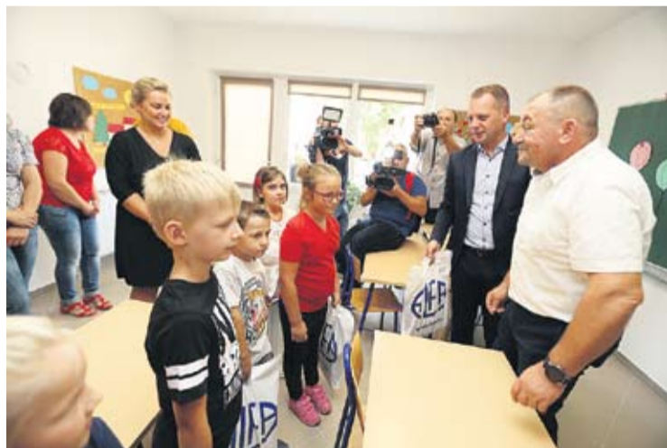
U novim prostorima lijepo je i osoblju i učenicima

odrastanje i skupljanje daljnjih znanja vjerujem da će učenicima ostati u sjećanju ovaj dan kada su dobili nove, prozračne, uredne i higijenske prostore kojima se malo koja zemlja EU može podičiti. Županija puno ulaže u obrazovanje i svaka kuna koja se uloži u obrazovanje sigurno je uložena u pravu svrhu jer samo djeca koja imaju ovakve uvjete za školovanje u školu dolaze s ljubavlju, željom, voljom i radošću – rekao je, između ostalog, saborski zastupnik Đakić.