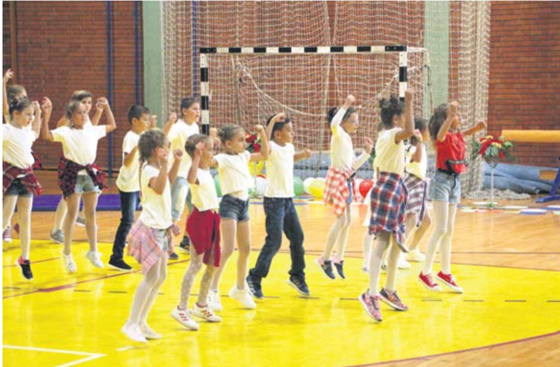
Stariji učenici pjesmom, plesom i dobrodošlicom opustili su uzbuđene dake prvake

6. Testovi će se morati najavljivati barem mjesec dana ranije.