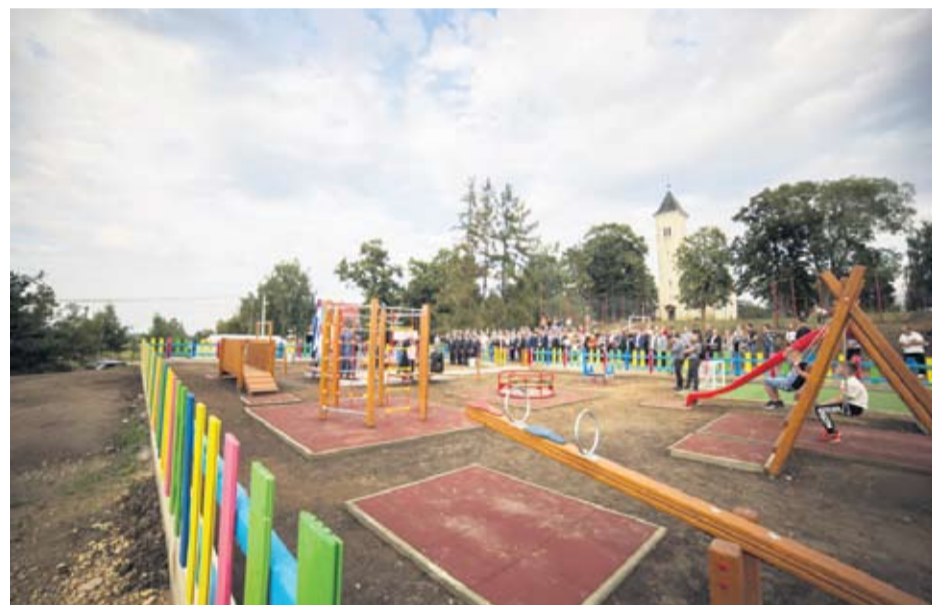
Ovo je sedmo igralište na području općine Pitomača

škola i igrališta na području županije – rekla je ministrica Bedeković. Na koncu, mjesni župnik vlč. Ljubo Krmar blagoslovio je igralište i svu djecu koja će u njemu boraviti.