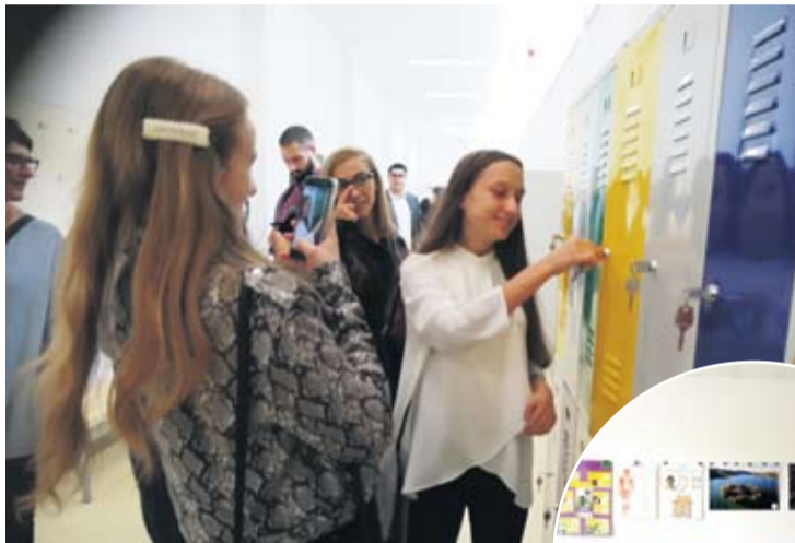
Učenicima je sve novo i to se trebalo zabilježiti

Otvorenje nove zgrade bila je prilika postojećim i novim učenicima i njihovim roditeljima vidjeti što ih sve očekuje u novoj školskoj godini.