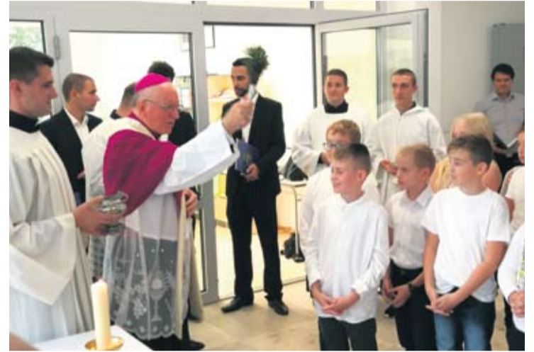
Blagoslov za uspješan početak nove školske godine

omogućiti kvalitetniji i plodonosniji rad, rekao je, uputivši svima uključenima u radove zahvalu, a pritom na sve okupljene zazvao i Božji blagoslov.