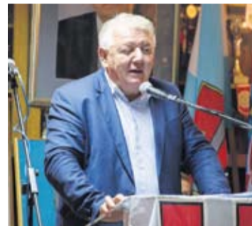
Saborski zastupnik Josip Đakić