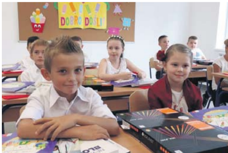
Mališani sretni u novoj školi

Izgradnja nove područne škole u Bakiću, koja se nalazi pri Osnovnoj školi Eugena Kumičića Slatina, vrijedna je oko 1.4 milijuna kuna, a sufinancirana je sredstvima Ministarstva regionalnog razvoja i fondova Europske unije s 400 tisuća kuna, Grada Slatine koji je u ovom projektu participirao s 300 tisuća