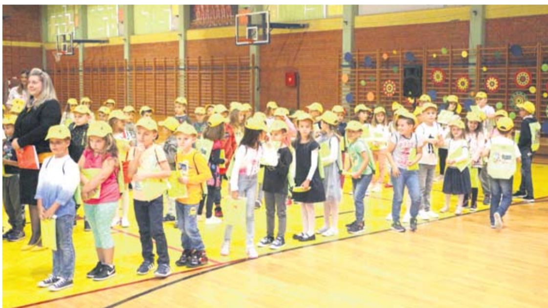
U Brličima mališani su spremno dočekali prvi dan škole