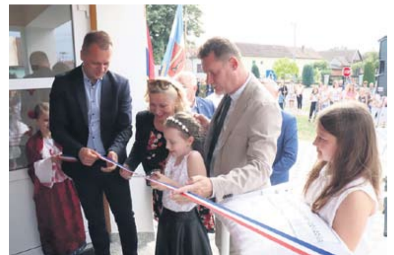
Škola za đake - s otvorenja

– U idućih nekoliko godina možemo doista puno učiniti, ne samo za Bakić, nego i ostala prigradska naselja jer imamo mogućnosti, imamo sredstva i dobru suradnju sa Županijom koja će kao i Grad podržati sve što je potrebno za opstanak života u ovoj sredini. Najbitnije je kvalitetnim programima i razvojem zadržati ljude ovdje i škole napuniti djecom jer djeca su naša