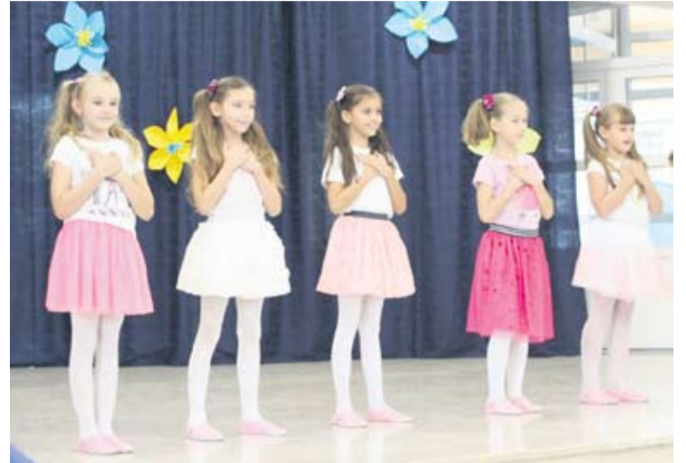
Za starije učenike bili su ovo radni praznici, pripremali su se za svoju prvu točku u novoj školskoj godini