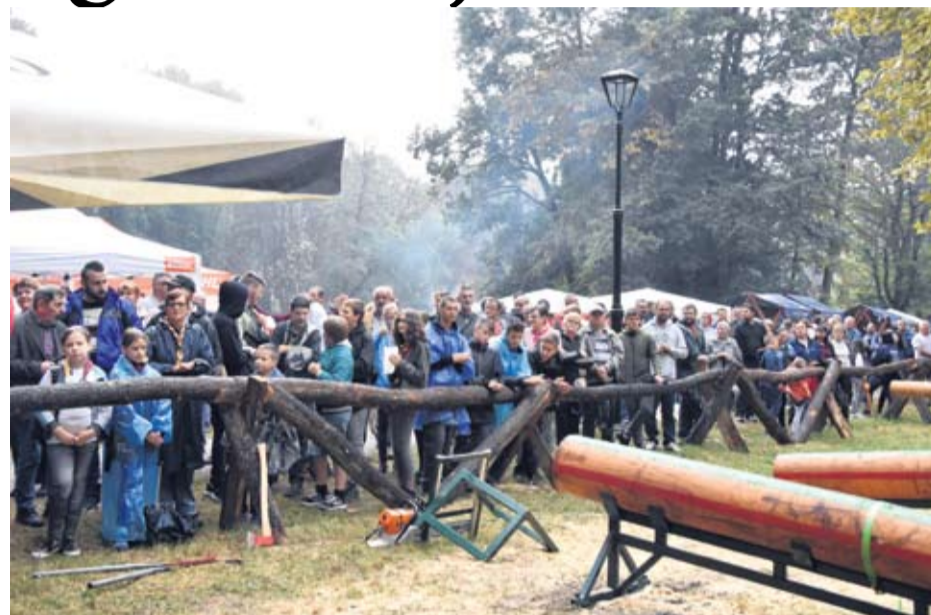
Bez obzira na kišu skupilo nekoliko tisuća ljudi