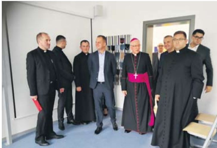
Biskup, župan i drugi uzvanici obišli su nove prostorije

● Cjelokupna investicija koja se odnosila na obje škole, a koja je trajala pune dvije godine, od izgradnje novog krila škole i nove sportske dvorane, vrijedna je 19 milijuna kuna. Uz osnivača, Požešku biskupiju, u njoj je sudjelovala i karitativna organizacija Renovabis iz Njemačke. Rezultat radova, uz novu sportsku dvoranu, je osam novih učionica, knjižnica, kabineti.