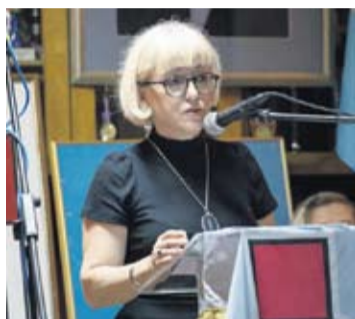
Ministrica za demografiju, obitelj, mlade i socijalnu politiku Vesna Bedeković