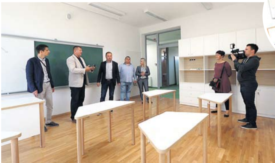
Gradonačelnik sa suradnicima obišao završne radove u COOR-u

sredstva zahvaljujući Vladi Republike i premijeru Andreju Plenkoviću - rekao je gradonačelnik Kirin dodavši da se ovim projektom stvaraju najveće investicije što se tiče samog školstva na području grada Virovitice. Trodijelna sportska dvorana uz sam COOR, neto površine 2.900 četvornih metara, bit će primarno školska, ali po