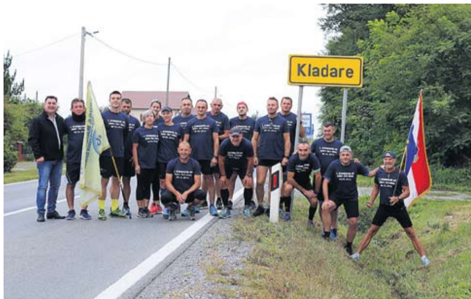
Maratonci s prijateljima krenuli su iz Kladara