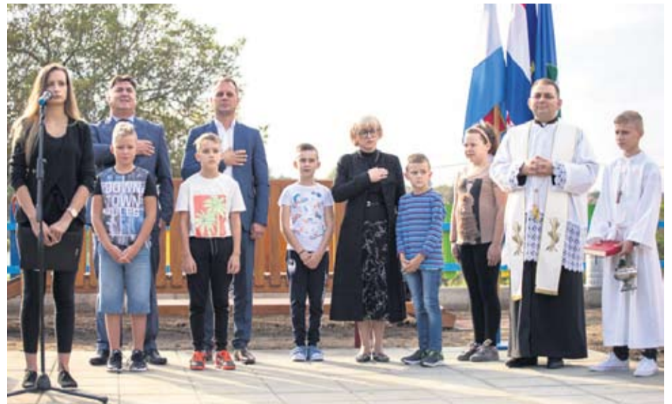
Otvorenju igrališta nazočili visoki uzvanici

– Ulaganje u djecu i mlade nije samo snažna i važna demografska mjera, nego je i jamac opstanka i identiteta svake nacije. U Virovitičko-podravskoj županiji to se shvatilo jako ozbiljno i u posljednjih desetak godina izgrađeno je mnoštvo dječjih vrtića,