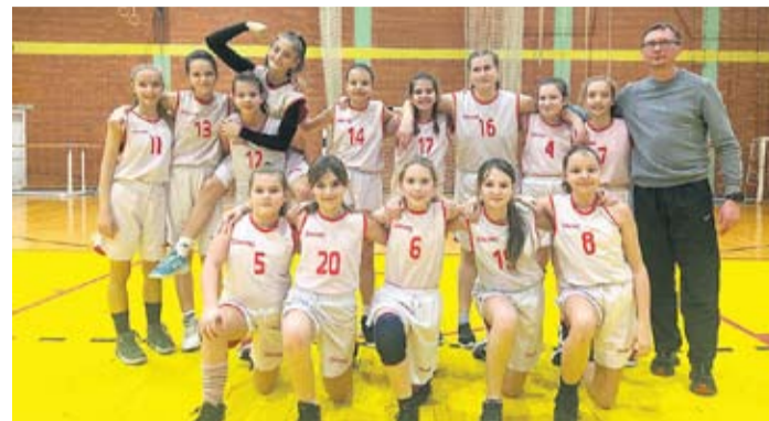
Košarkašice Z-13 nakon pobjede s Virjem

Tri pobjede i poraz virovitičkih košarkašica na Prvenstvu Regije sjever ŽKK Virovitica 1 – ŽKK Mladost