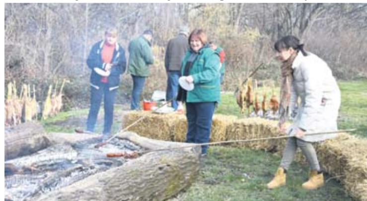
S orahovačkog Jezerca širio se miris pečene slanine i kobasica