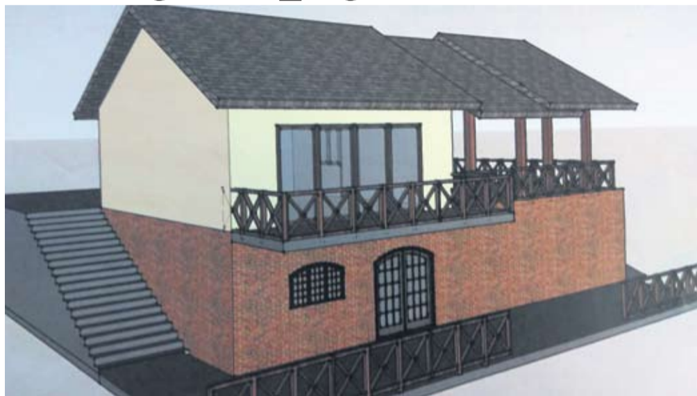
Izgled budućeg vidikovca

- Nastavili smo tražiti drugu povoljnu lokaciju na kojoj će biti vidikovac kao dio vinske ceste i turističke ponude grada Virovitice. Udruga