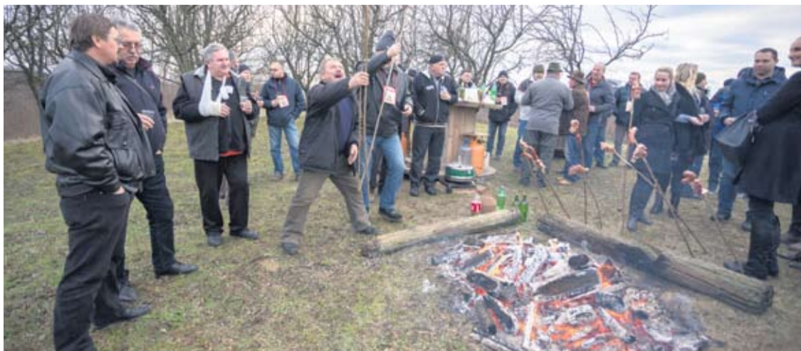
Članovi virovitičke udruge vinogradara Vincekovo proslavili na mjestu budućeg vidikovca