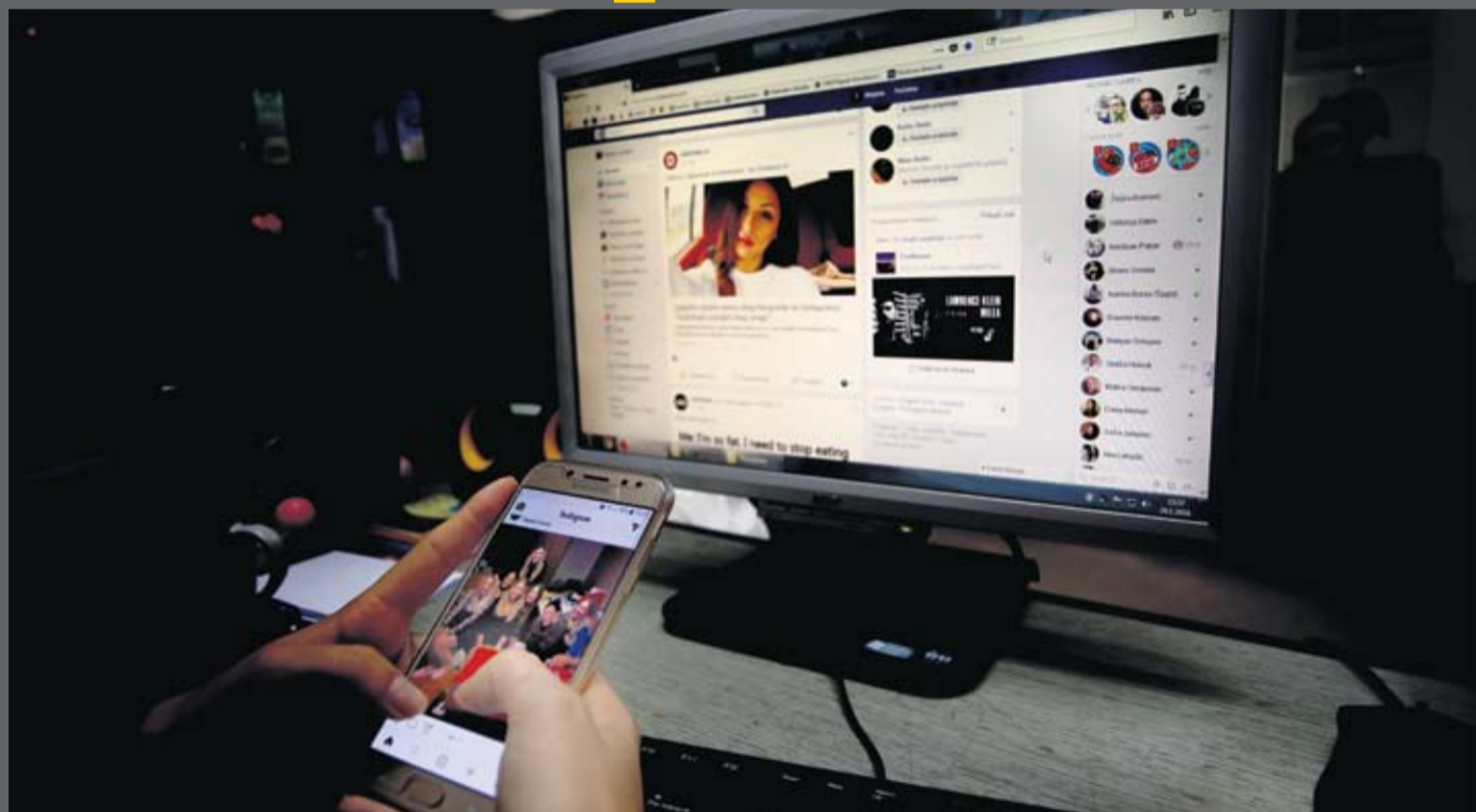
Suvremenu tehnologiju djeca i mladi imaju nadohvat ruke, ali nisu svjesni posljedica ni opasnosti njena korištenja

- Povod za nasilje na internetu može biti nešto sasvim bezazleno – od komentara na nečiji izgled, vrstu odjeće ili mobitela koji netko koristi pa sve do ciljanih postova. Vrlo brzo dođe do toga da se tisuću osoba uroti protiv jedne i da žrtva ima dojam kako se cijela zajednica ili škola okrenula protiv nje - o iskustvu na radu preventivnog programa protiv nasilja na internetu kaže D. Huzjak. Cyberbullying među djecom i mladima prava je Pandorina kutija, ističu nam sugovornici, stručnjaci koji rade na tom problemu. Sve mlađa generacija u ruke dobiva mobitel i s njim mogućnost da "lajka", objavljuje na društvenim mrežama, komentira i dijeli određen sadržaj. - Informacijska pismenost ne znači i psihološku zrelost. To znači da mladi još uvijek nisu u potpunosti svjesni posljedica koje mogu napraviti svojim