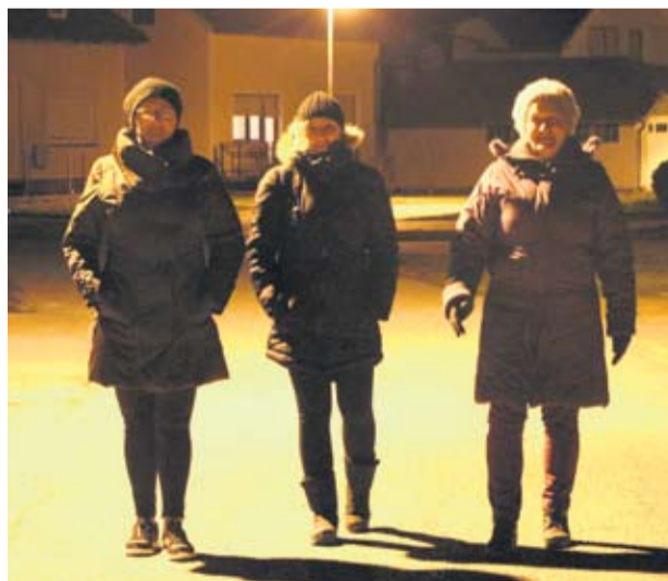
Naše sugovornice kažu da im šetnja pomaže zdravlju

- Cilj hodanja nije da se zapužete, nego da se što koordinirani krećete ovisno o vašim tjelesnim sposobnostima - istaknuo