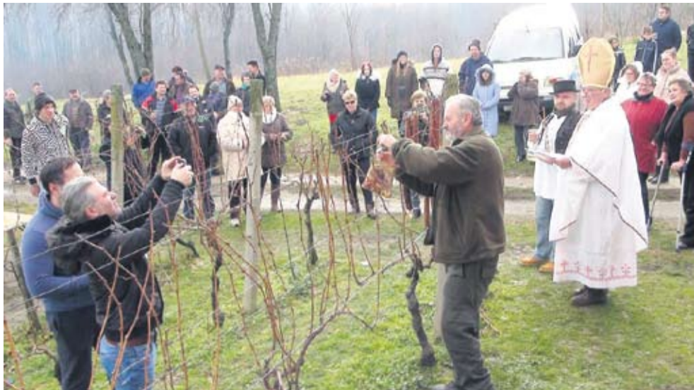
Proslava Vincekova u Bukovačkom vinogorju