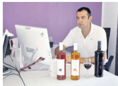
Krešimir Kostelac, poznati poduzetnik

- Uz pomoć novih ljudi i nove vizije nadamo