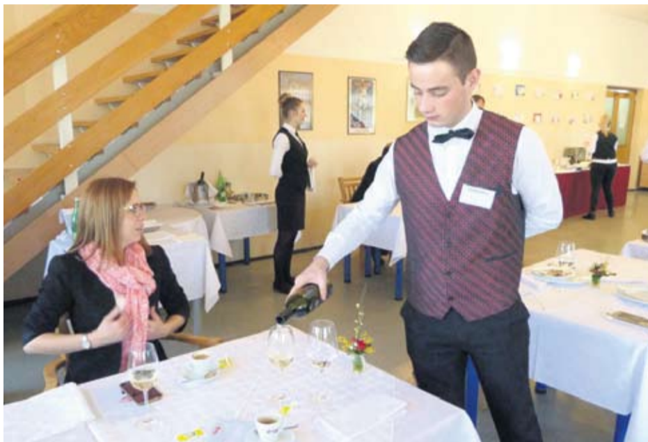
Konobari i dalje među najtraženijim sezoncima na moru