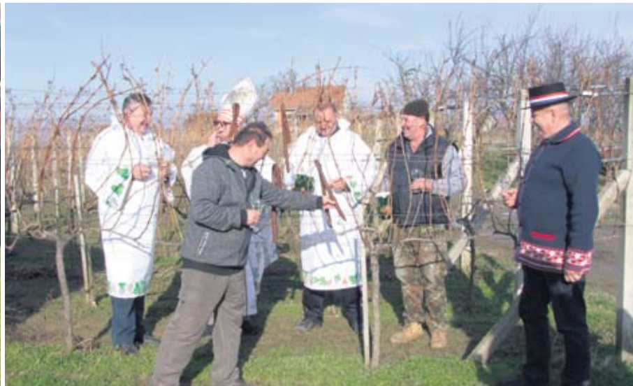
Gradinski vinogradari tradicionalno na Drokanovom brdu