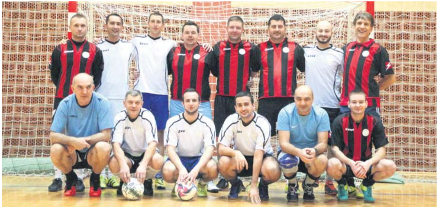
Rekreativci nogometaši nagraduju ekipu koja zabije najljepši gol