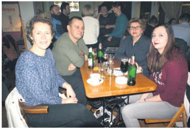
Ekipa Skviki pobjednica je prvog kviza nakon formiranja lige

● Natječu se i iskusni faktoznalci koji iza sebe imaju Potjeru, Milijunaša, Najslabiju kariku ili Kolo sreće, kao i oni koji su baš taj petak prvi put u životu odlučili iskušati vlastite temelje opće kulture i medijske pismenosti