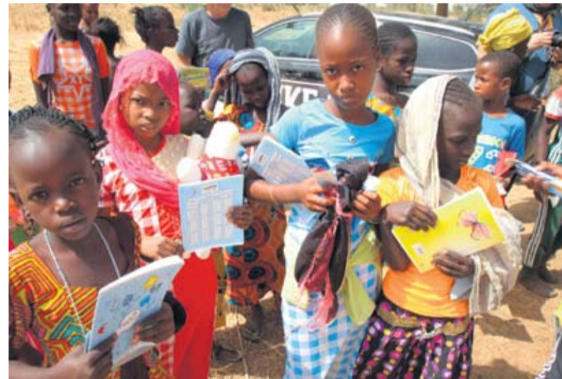
Bilježnice, lijekovi, igračke - sve je došlo do ruku mališana

Priča s paketima pomoći i susretima s malisanima kojima smo ih darovali nadmašila je i najoptimističnija predviđanja. Kada je jednom krenulo u Mauritaniju, dalje je išlo kao