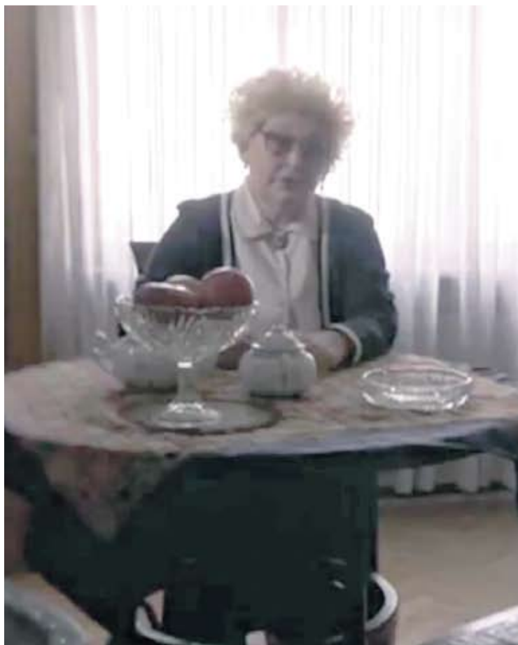
Virovitička glumica kao utjelovljenje Eve Schwarz