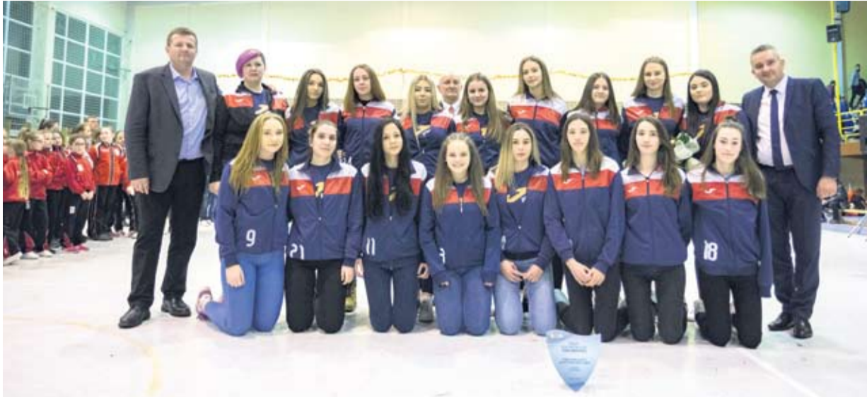
Najbolja kadetska ekipa ŽRK Virovitica