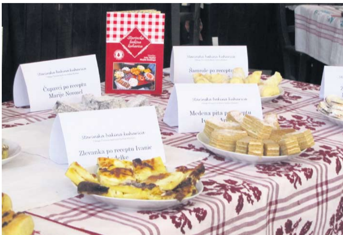
Domaće delicije pripravljene po starinskim receptima

Na promociji knjige članice Udruge su pr-