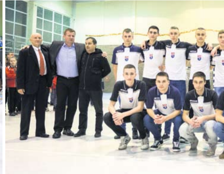
Najbolji juniori NK Virovitica