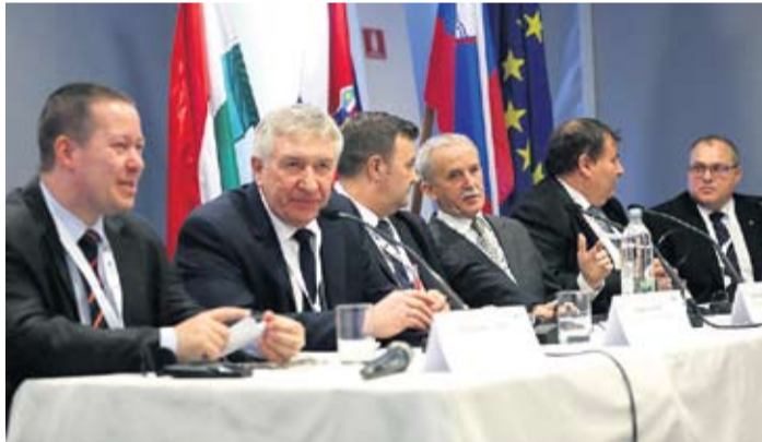
Hrvatski i mađarski predstavnici razgovarali o suradnji

između Hrvatske i Mađarske s ciljem smanjivanja udaljenosti koja danas postoji između njih. Na području Virovitičko-podravske županije, uz onaj postojeći kod Terezinog Polja, spominjao se i budući granični prijelaz, koji bi se nalazio na području općine Sopje. Osim toga, održana su i predavanja o mogućnostima razvoja Dravskog bazena te turističkim aktualnostima uz hrvatsko-mađarsku granicu. K. T.