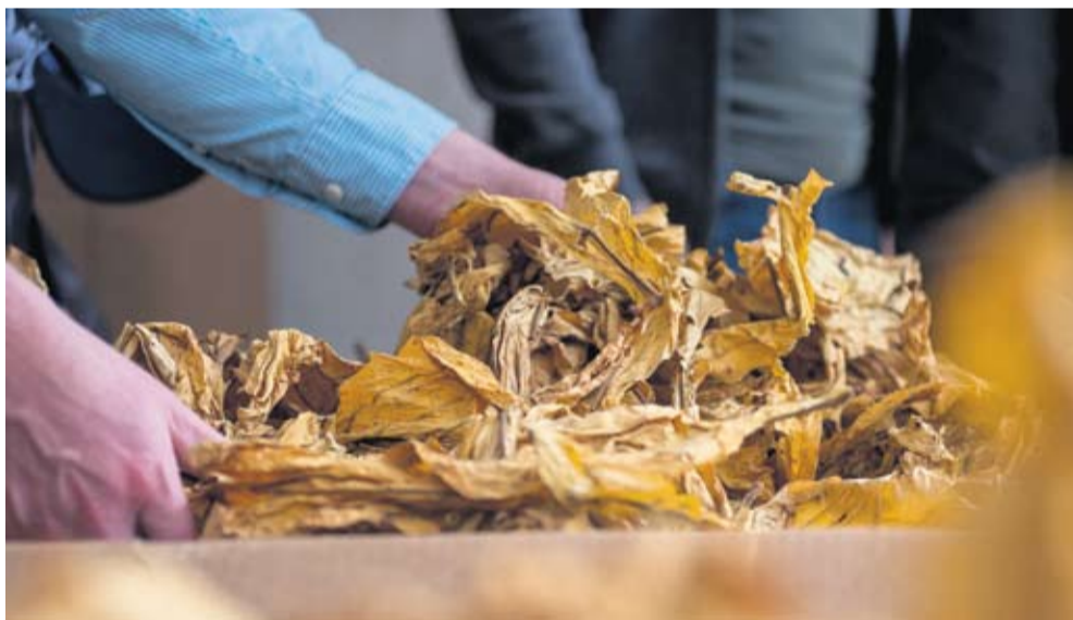
Duhanci će i ove godine imati ugovorenu proizvodnju

- Hrvatski duhani ove godine slave 60 godina poslovanja i iznimno sam ponosan što nastavljamo dugu tradiciju razvoja proizvodnje duhana u ovom kraju. Naša vjera u dugoročnu održivost duhanske proizvodnje u Hrvatskoj nikada nije bila čvršća. Vjerujemo da duhan i u idućim godinama može osiguravati kvalitetnu egzistenciju velikom broju obitelji. Svojim kooperantima smo i dalje stabilan partner. Osiguravamo najbolje uvjete proizvodnje, od sigurnog otkupa, preko financijskog praćenja tijekom proizvodnog ciklusa i raznih edukativnih programa pa sve do dugoročnih ulaganja u opremu i sustave za navodnjavanje