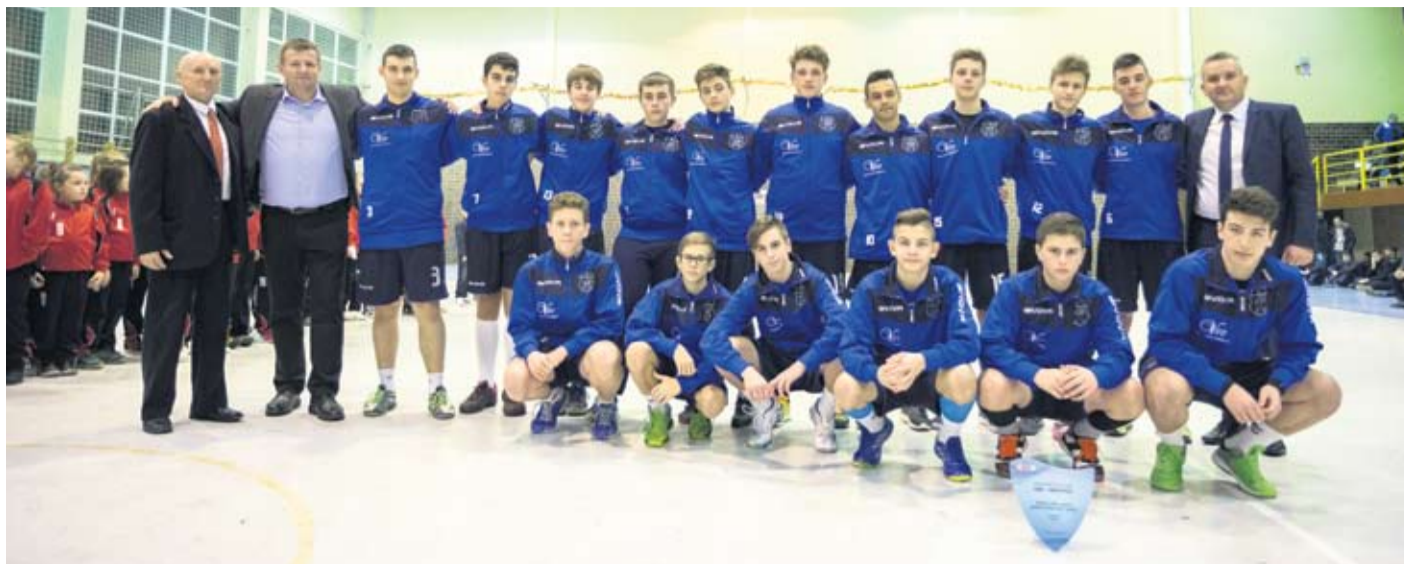
Najbolji kadeti RK VIRO Virovitica