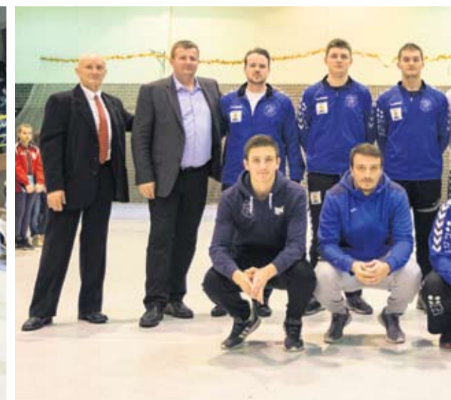
Najbolji seniori RK Virovitica