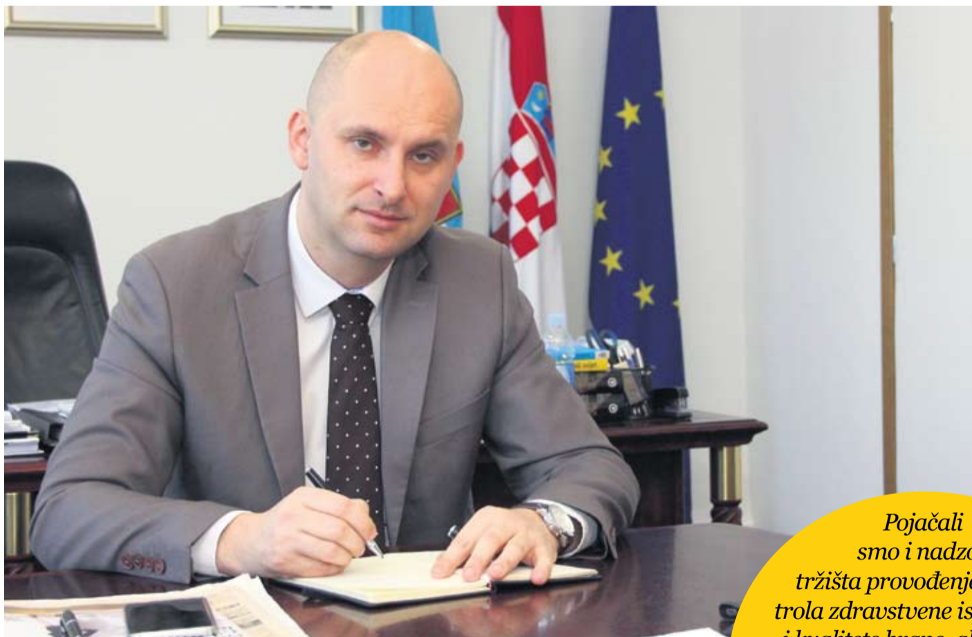
Ministar Tomislav Tolušić s optimizmom gleda u budućnost

• U iduća dva mjeseca bit će usvojen komplet temeljnih zakona koji će, uvjeren sam, zaustaviti negativne trendove i donijeti pozitivan zaokret u poljoprivredno-prehrambenom lancu Republike Hrvatske.