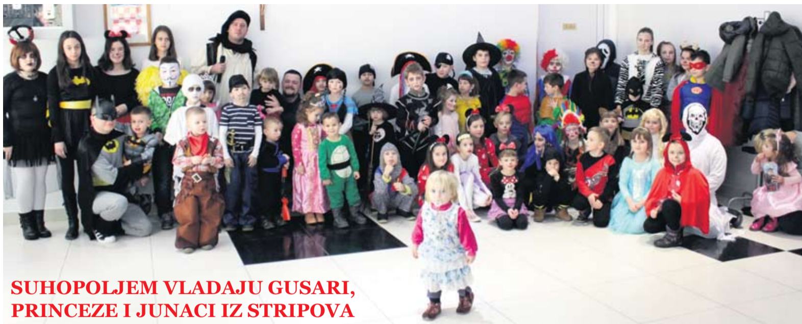
SUHOPOLJEM VLADAJU GUSARI, PRINCEZE I JUNACI IZ STRIPOVA