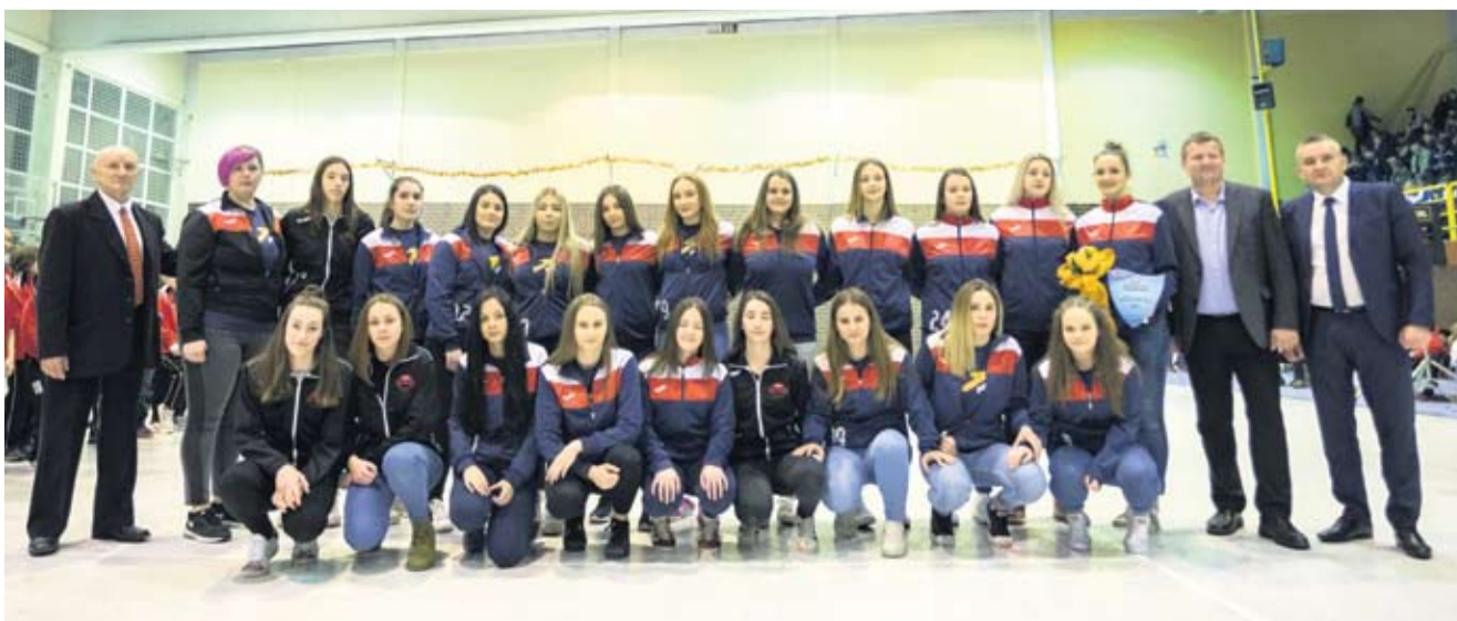
Najbolja seniorska ekipa ŽRK Virovitica