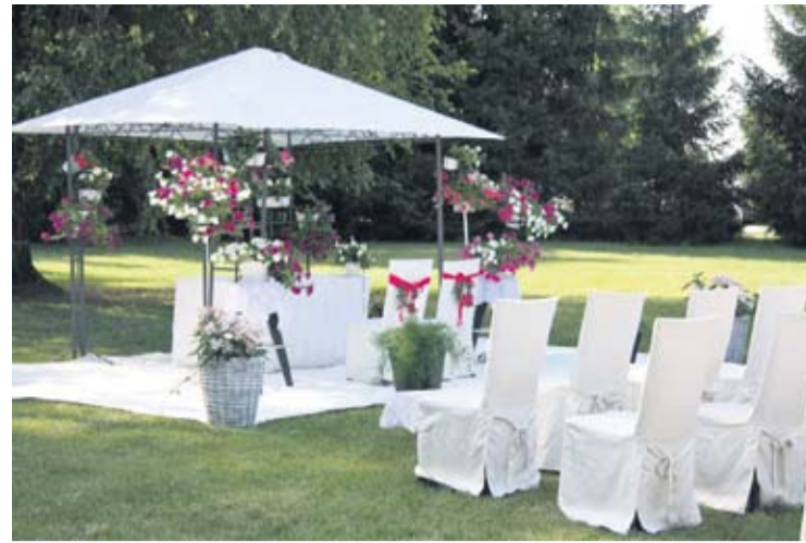
ROMANTIČAN UGOĐAJ ERGELE VIŠNJICA, PALAČE PEJAČEVIĆ ILI SEOSKOG IMANJA „ZLATNI KLAS“ UČINITI ĆE DAN VJENČANJA POSEBNIM

Nužno je što ranije krenuti u edukaciju djece i mladih, da što ranije nauče kontrolirati sadržaje s kojima se susreću na internetu te kako se snaći u potencijalno neugodnim i uznemirujućim situacijama, pokazuje istraživanje EU Kids Online tima Hrvatska.