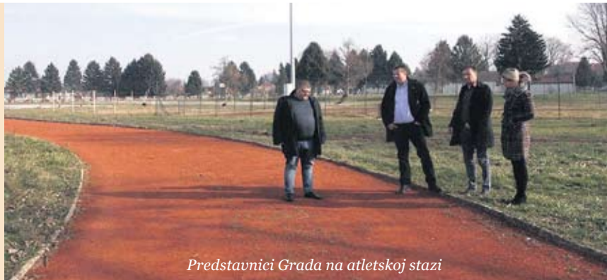
Predstavnici Grada na atletskoj stazi

Svim sportašima i rekreativcima trening u večernjim satima na virovitičkoj atletskoj stazi bit će znatno ugodniji. Naime, oko staze su postavljeni rasvjetni stupovi te će staza uskoro biti osvijetljena. Atletska staza u Virovitici, koja se nalazi na prostoru bivše vojarnje, u funkciji je od početka listopada prošle godine. Za novi teren za sport i rekreaciju Virovitičana pobrinuo se Grad Virovitica. Troškovi uređenja iznosili su oko 20 tisuća kuna, a u uređenju su sudjelovali i djelatnici javnih radova.