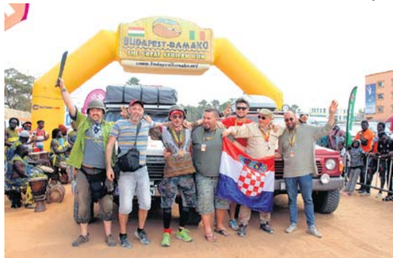
Sretni jer su ostvarili cilj - hrvatska ekipa na kraju humanitarnog relija