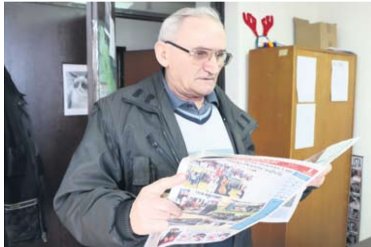
Naš čitatelj prati svaki novi broj

- Najdraže su mi životne priče naših Virovitičana, ali i projekti kojima naš grad i županija dobivaju svoje novo, modernije ruho