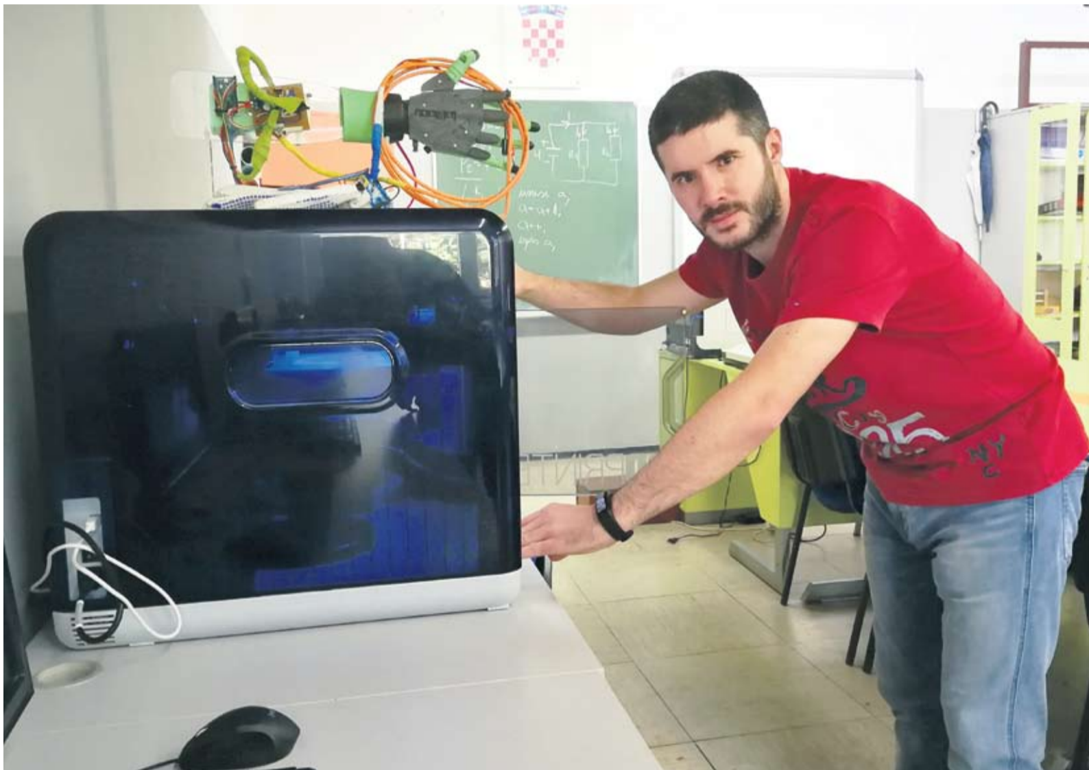
Tehničar za mehatroniku bit će usko vezan uz smjer elektrotehničar

• Ukoliko se ne popune određeni odjeli, učenici će biti preraspodijeljeni na druge prioritete. Ako nisu izabrali drugi prioritet, onda ćemo to rješavati s Ministarstvom u drugom krugu – naglasila je pročelnica V. Šerepac.