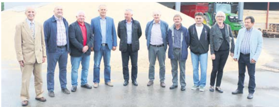
Sa Strukovne grupe agrara HGK