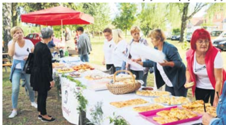
Udruge s područja općine okrijepile mještane ukusnim delicijama

je na žrtvu koju su poginuli hrvatski branitelji dali za slobodnu Hrvatsku te da im je u znak zahvale i sjećanja Ministarstvo hrvatskih branitelja podiglo spomen obilježje u Okrugljači, Bušetini, Lozanu i Vukosavljevici.