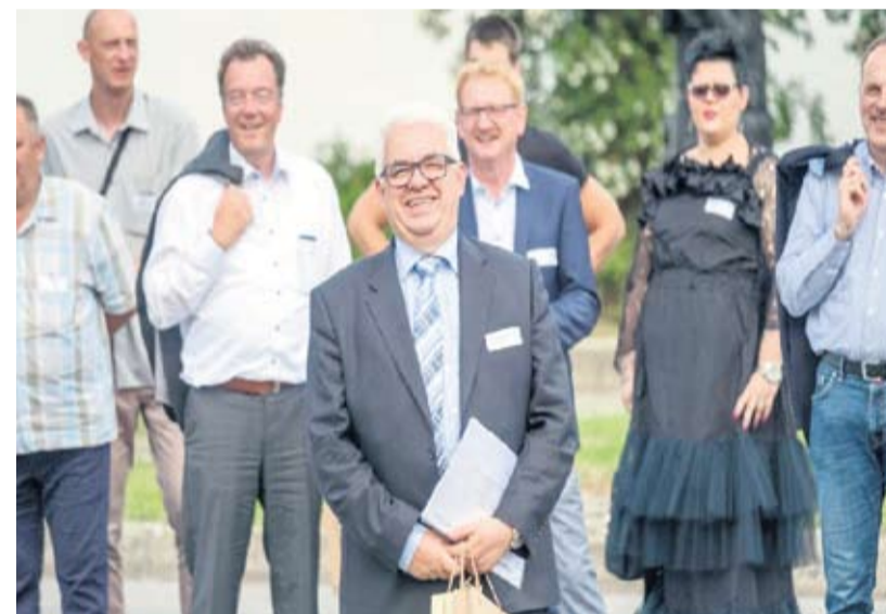
Klaus Brammertz gleda u budućnost - "Otvorenje nove tvornice parketa je važan korak za Bauwerk Boen Group da postane najvrjedniji proizvođač parketa u Europi"

werk Boen u Đurđevcu smješten na 130.000 m 2 , uz brojne proizvodne hale opremljene najmodernijim strojevima i stručnim radnicima ostavili su snažan dojam na sve prisutne. Dojmove svih uzvanika ukratko je rezimirao Klaus Brammertz, CEO Bauwerk Boen Group i predsjednik Bauwerk robne marke a.i. - Otvorenje nove tvornice parketa u Đurđevcu je velik uspjeh i važan korak za Bauwerk Boen Group na putu da postane najvrjedniji europski proizvođač parketa - rekao je K. Brammertz. Gostima koji su došli iz cijele Europe (veleposlanici Švicarske i Norveške, predstavnici inozemnih medija, proizvođači, dobavljači) prezentiran je cijeli kraj te im omogućen obilazak poznate lokalne šume u Repasu (4.218 hektara), a potom i posjet dvorcu Stari grad u Đurđevcu.