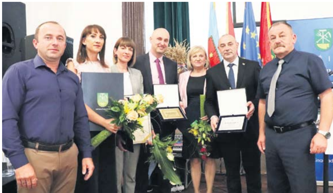
Dobitnici ovogodišnjih priznanja

• Općina Čađavica s malo novca zna napraviti puno, zahvaljujući načelniku i njegovim suradnicima, kao i potpori Županije, agencije VIDRA, ali i mjerama ruralnog razvoja koje idu iz fondova EU – rekao je T. Tolušić.