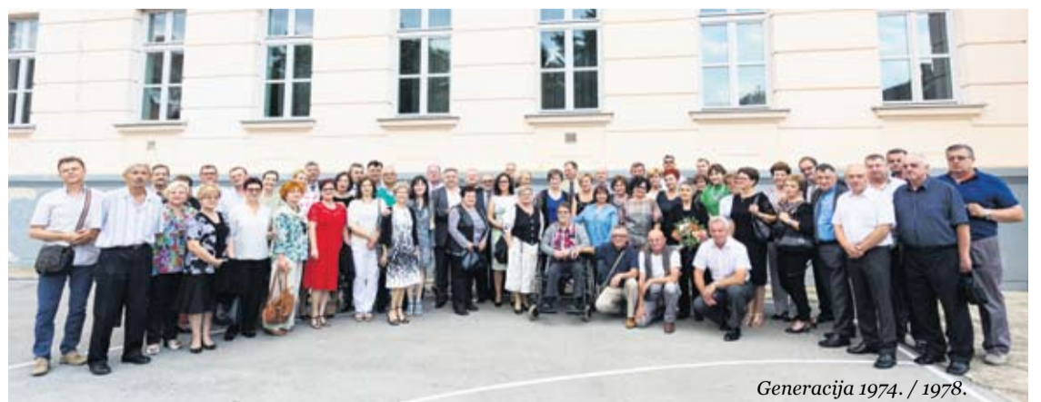
Generacija 1974. / 1978.