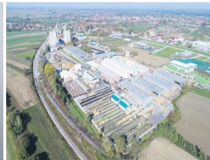
Nova 130.000 kvadratnih metara velika tvornica parketa u Đurđevcu, Hrvatska (pogled odozgo)