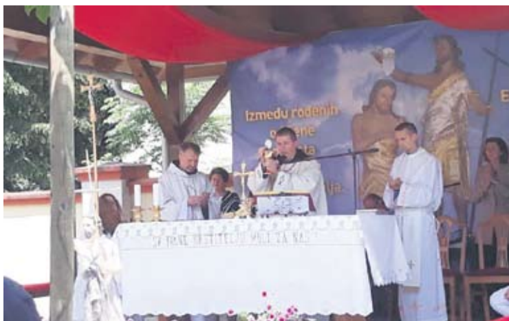
Blagdan Sv. Ivana Krstitelja proslavljen misom