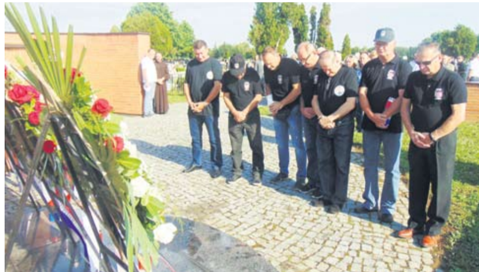
Svijecama i molitvom odana je počast pokojnim braniteljima