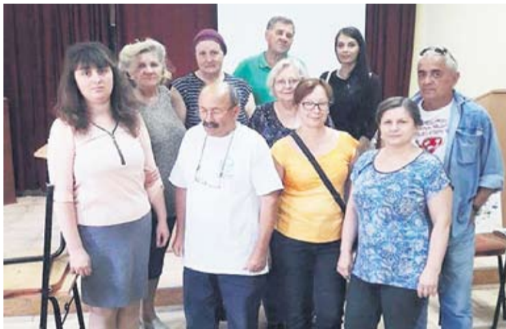
Umjetnici su se likovnom kolonijom prisjetili pokojnog kolege

Ovaj memorijal s razlogom je održan baš u krugu župne crkve koju je Vilim volio više od svega. Kao dijete, sjećaju se njegovi kolege, maštao je da će postati svećenik, a kasnije je ljubav prema vjeri i sakralnim objektima prenio na talent za slikarstvo. Posvetio je vjerskom životu cijeli svoj život, a hodnike samostana i dijelove crkve