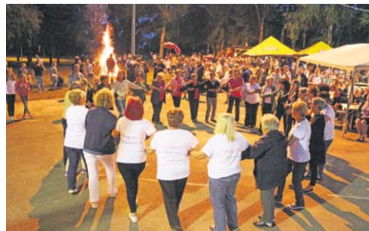
Paljenje krijesa i kolo Bukovčana na Ivanjsko navečerje