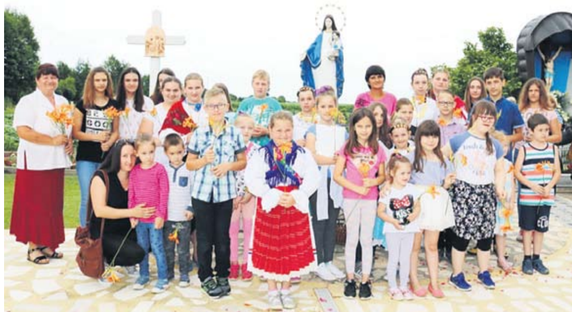
Obilježena 21- obljetnica ukazanja Gospe Gradinske