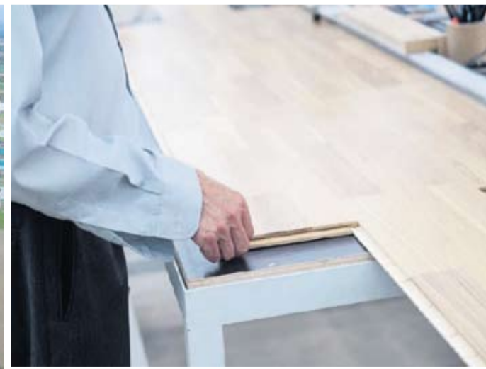
U modernoj tvornici parketa u Đurđevcu moguće je proizvoditi volume od 1.1 milijuna kvadratnih metara parketa godišnje