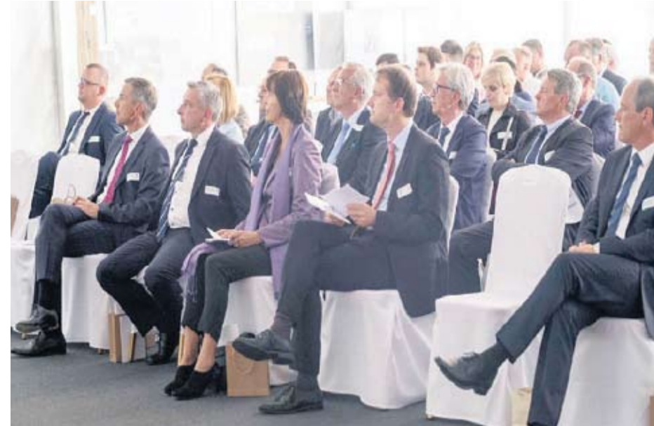
Preko 100 gostiju bili su impresionirani modernom tvornicom parketa u Đurđevcu