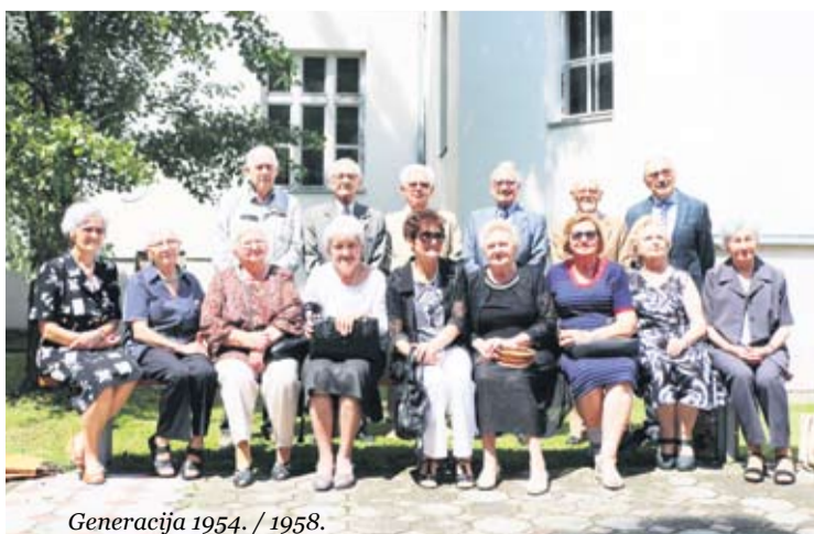
Generacija 1954. / 1958.