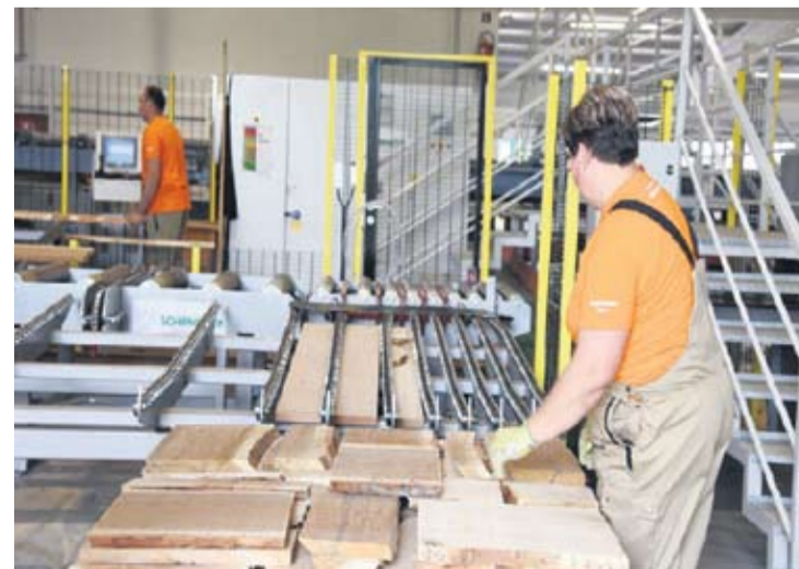
U pilani se u raznim koracima trupci prerađuju u elemente. Najprije se deblo reže pomoću tračne pile, zatim se sortira piljena građa, ponovno pili i slaže