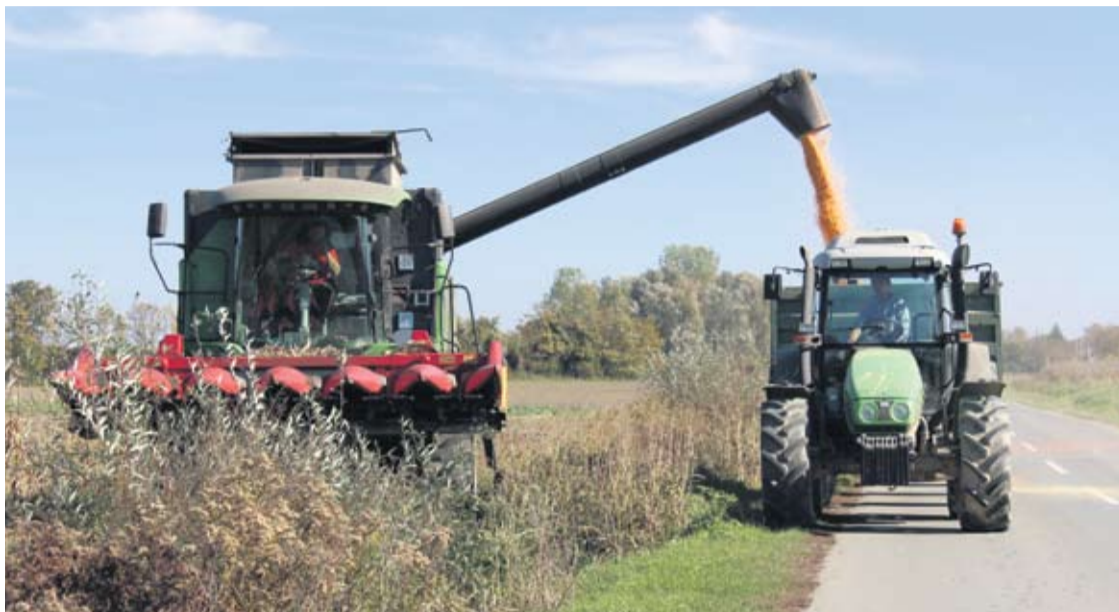
Radovi na poljima već traju, kvaliteta usjeva ovisi o vremenu

dostatak radne snage u branju duhana kao i starosna dob nositelja OPG-a. - S ciljem rješavanja ovog problema Agroduhan d.o.o. Slatina je pristupio nabavci kombajna za berbu duhana, a toj praksi koja je zastupljena u svim zemljama EU pristupili su, kako doznajemo i Hrvatski duhani. Smatramo to ulaganjem u budućnost, jer ćemo tako i našim kooperantima olakšati berbu duhana što bi u konačnici dovelo i do rasta proizvodnje ove poljoprivredne kulture. Inače, tvrtka Agroduhan d.o.o. iz Slatine ugovorila je ovogodišnju proizvodnju duhana na 300 hektara – objasnio je K. Hrgović. Prošle godine Agroduhan je ostvario prinose od oko 1900 kilograma po hektaru, a ove godine očekuju veći prinos jer su klimatski uvjeti za razvoj biljke povoljniji, ocijenio je.