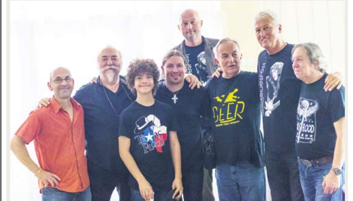
VRHUNSKI 14. MEĐUNARODNI ROCK BLUES FEST U VIROVITICI OKUPIO POZNATE IZVOĐAČE, PUBLIKA NA NOGAMA