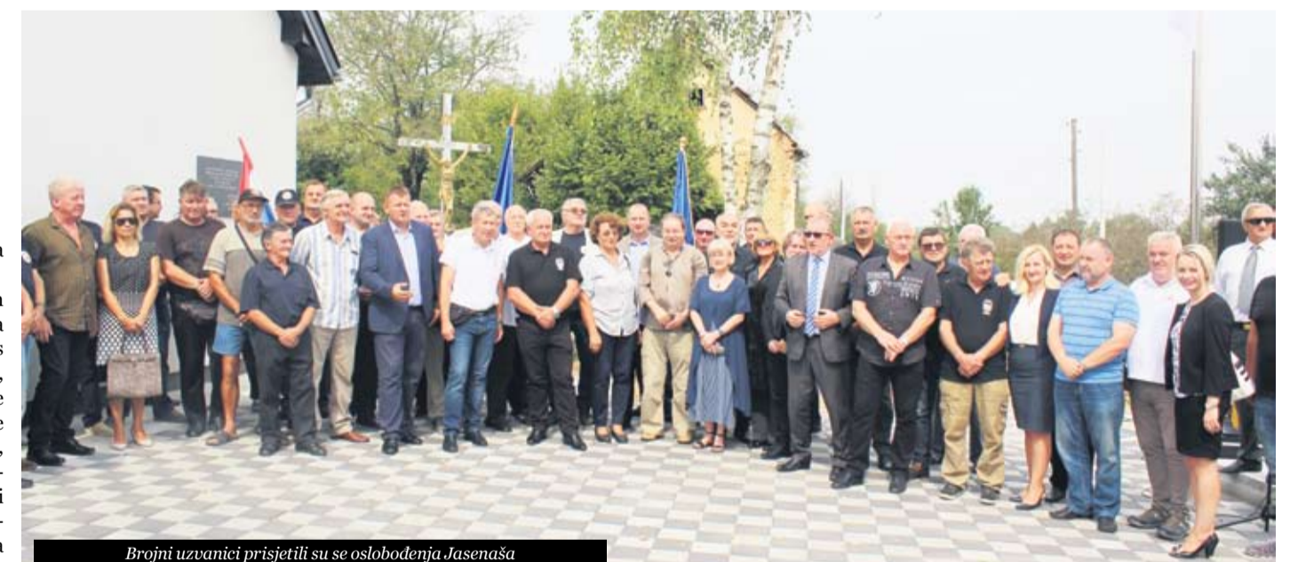
Brojni uzvanici prisjetili su se oslobađanja Jasenaša