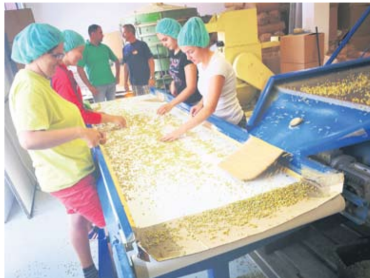
U pogonu je puno posla, a svatko radi sve

Producta, koji za poslodavca ima samo riječi hvale. – Moram pohvaliti našeg poslodavca, ima puno razumijevanja za radnike, socijalno je angažiran, uvijek je otvoren za sva pitanja – dodaje T. Đureš.