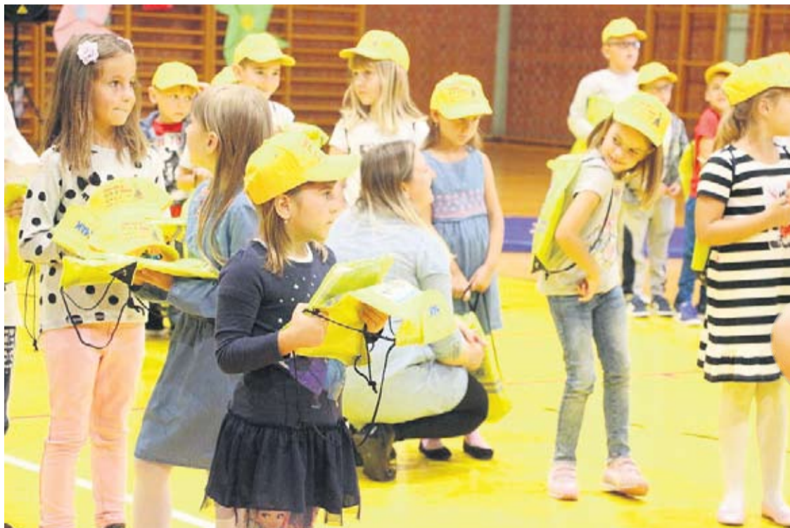
Prvašići su nastavu dočekali s uzbuđenjem

istaknula je da novu školsku godinu pohađa oko 730 učenika. Upisano je tri razreda prvašića odnosno 58 učenika, što je na razini prošlogodišnjeg broja upisanih učenika prvih razreda osnovne škole.