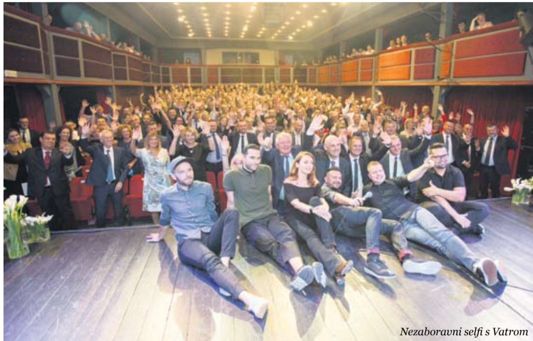
Nezaboravni selfi s Vatrom

Uzvanici su na svečanoj sjednici mogli uživati u izvedbama domaće rock grupe Vatra, koja je Županiji za 25. rođendan izvela dva svoja hita – „Bilo je dobro dok je trajalo“ i „Nama se nikud ne žuri“.