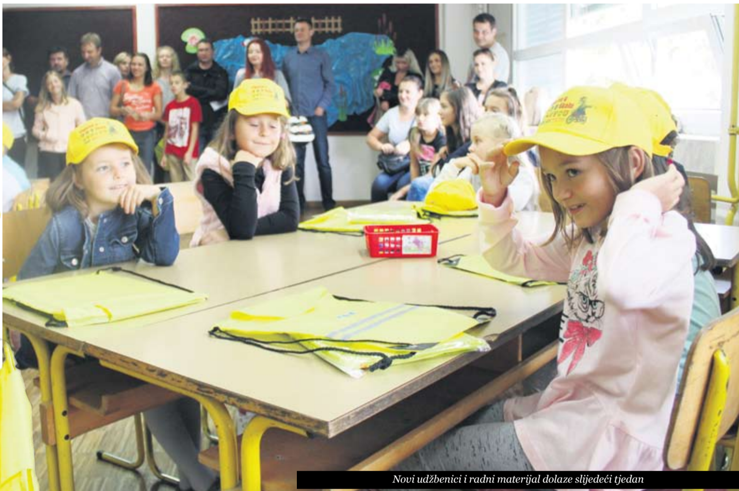
Novi udžbenici i radni materijal dolaze sljedeći tjedan