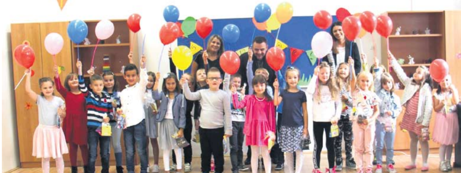
Četvrta generacija Katoličke osnovne škole

Nakon priredbe, predstavnici policije i Autokluba Virovitica, prvašićima koji su polaskom u