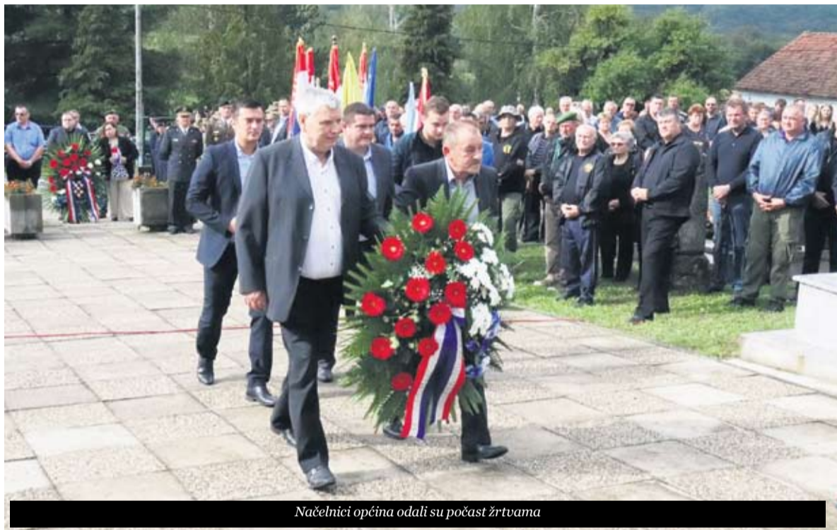
Načelnici općina odali su počast žrtvama

• I danas vas na ovoj komemoraciji pozivam da zajedno čuvamo tu istinu i sjećanje na sve hrabre branitelje i civilne žrtve koji su ušli u svijest svoga naroda kao moralna veličina i kao temelj društva – rekao je ministar hrvatskih branitelja Tomo Medved.