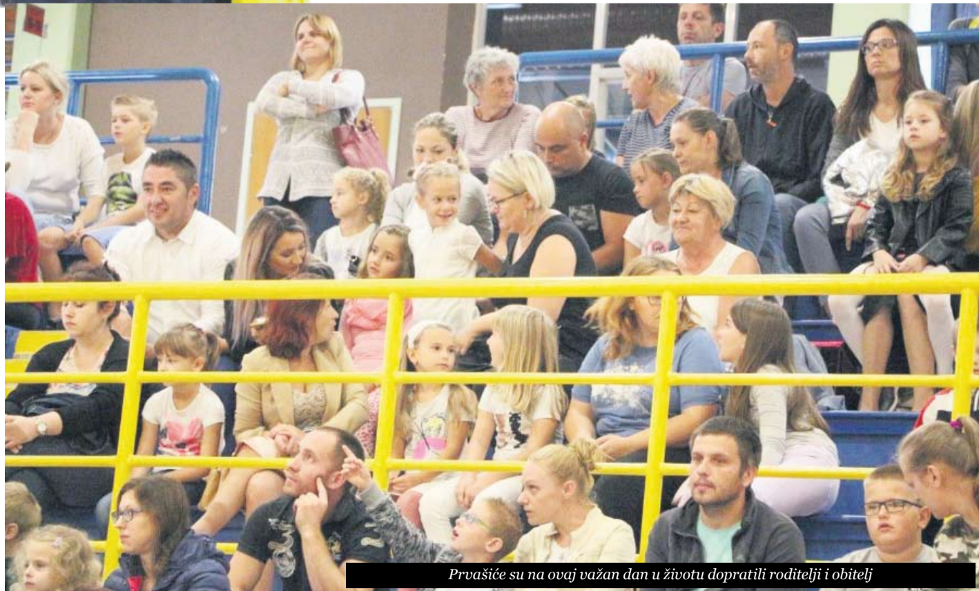
Prvašice su na ovaj važan dan u životu dopratili roditelji i obitelj