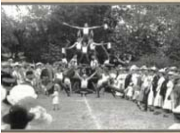
Sokolski pokret u Virovitici