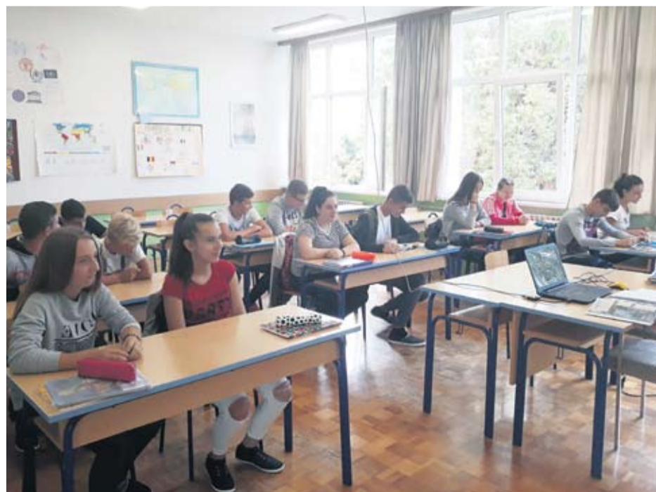
Osmi razred OŠ Mikleuš