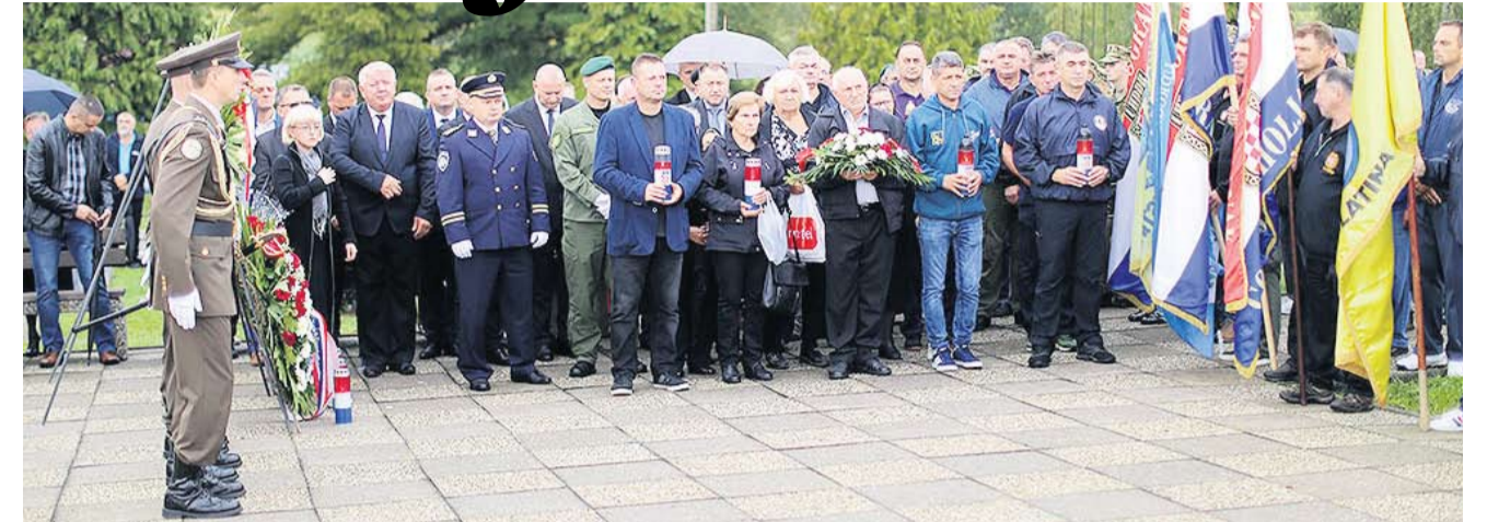
Molitve, vijenci i svijeće za najveću žrtvu naše županije u Domovinskom ratu