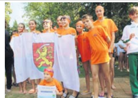
MEĐUNARODNO NATJECANJE U MAĐARSKOJ