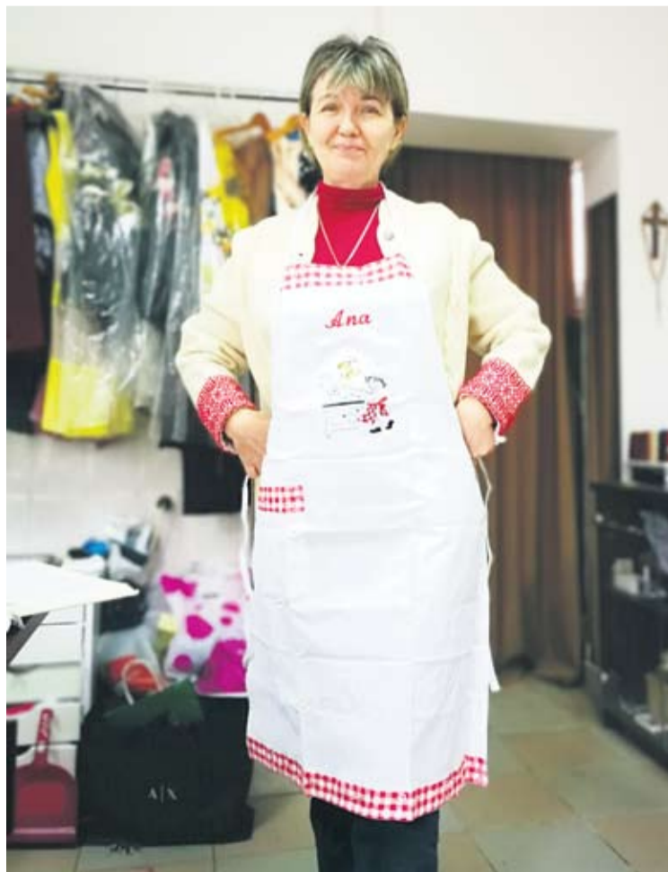
Personalizirane pregače pravi su hit