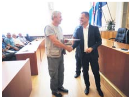
Lovačkim udrugama pomoć

Županija će tako, uz Hrvatski lovački savez, sufinancirati policu osiguranja od štete naleta divljači na motorna i željeznička vozila na javnim cestama i željezničkim prugama u lovištima čime će, prema riječima lovača, izuzetno pomoći njihovim udrugama i