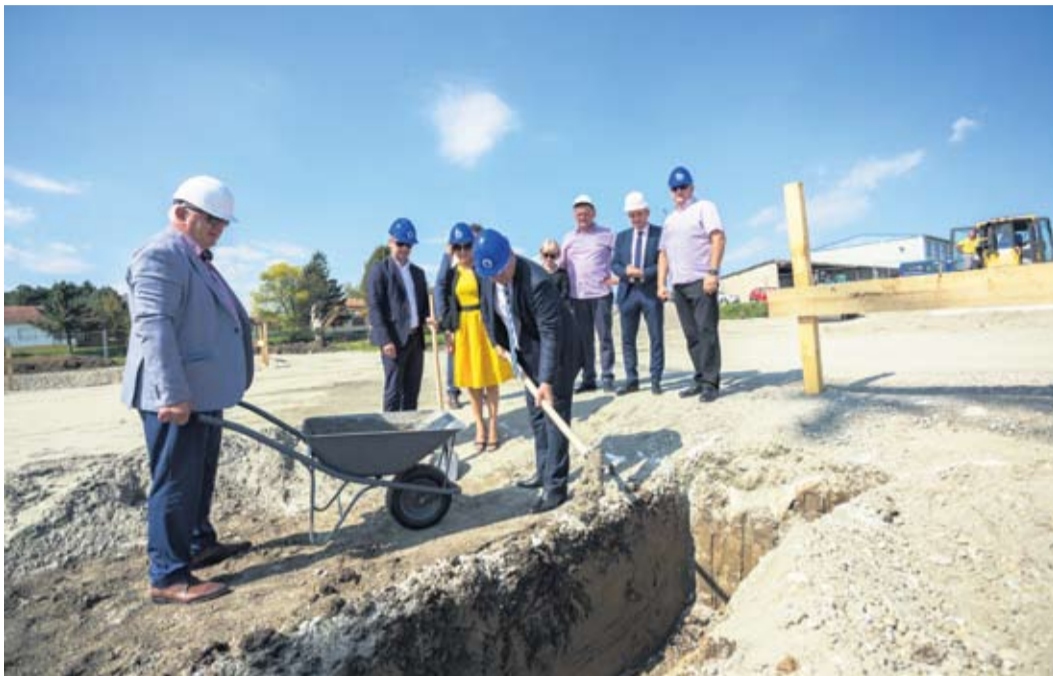
Početak gradnje novog Poduzetničkog inkubatora

Izgradnju poduzetničke zone u Kladarama, za vrijeme svojeg mandata načelnika općine,