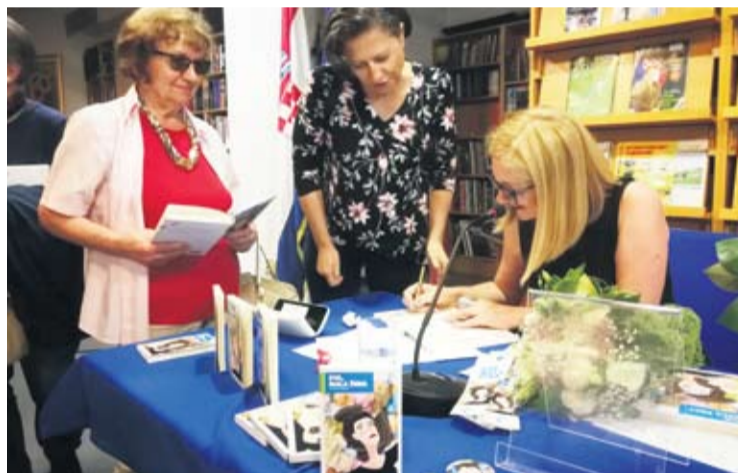
Kritika i čitatelji Evi najavljuju veliki uspjeh

● Situacije opisane u romanu su situacije u kojima se djeca i mladi danas nalaze, one su im poznate, zato nema potrebe za uljepšavanjem - ističe književnica V. Golub.