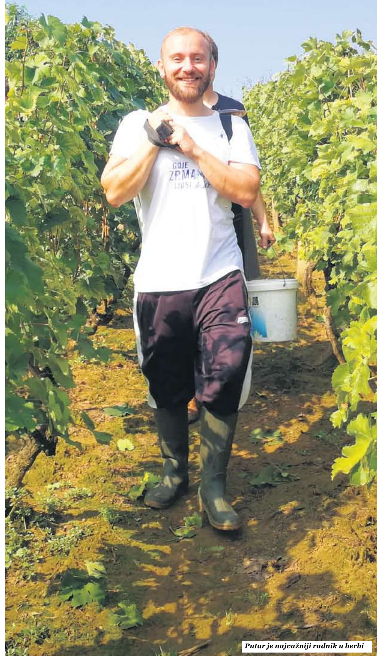
Putar je najvažniji radnik u berbi