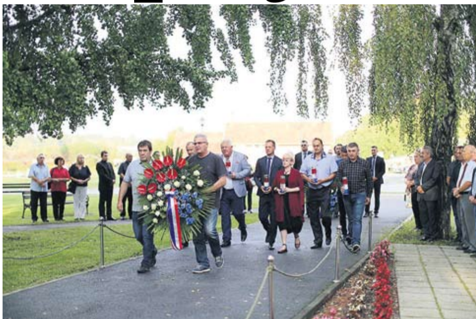
Vijenci, molitve i svijeeće za sve poginule žrtve

Riječi je bilo o projektu „Geopriče“, budućem kongresnom centru u Voćinu, dječjem vrtiću u Čeralijama, a pohvalio je i fiskalnu politiku Vlade. – Novom fiskalnom politikom općinama poput Voćina ostalo je puno više sredstava za ulaganje u