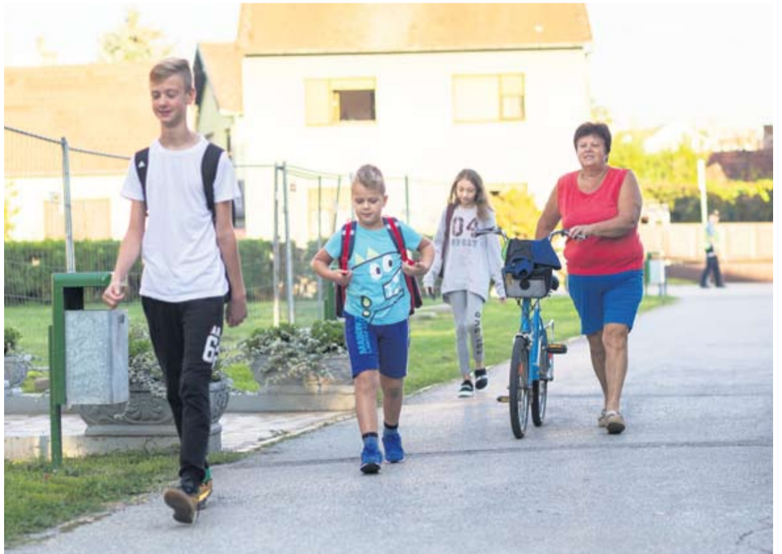
U pratnji odraslih put do škole je sigurniji

• Statistike PU virovitičko-podravske za prvih šest mjeseci ove godine ukazuju na to da je potrebna veća razina zaštite školaraca u prometu. Od početka godine do kraja lipnja na našim prometnicama stradalo je 14 školaraca, od kojih su 9 bili putnici u vozilima, troje su bili pješaci, a dvoje je stradalo dok su vozili bicikl.