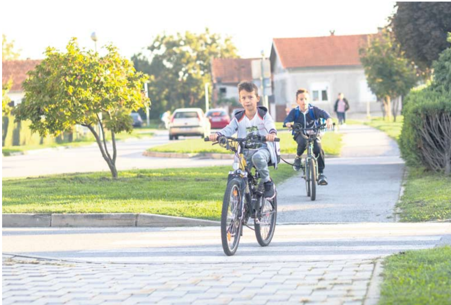
U školu su mnogi krenuli biciklom, a raskrižja do kuće je puno

OPASNOST NA CESTI Apel svakako stoji i to s pravom. Statistike PU virovitičko-podravске za prvih šest mjeseci ove godine ukazuju na to da je potrebna veća razina zaštite školaraca u prometu. Od početka godine do kraja lipnja na našim prometnicama stradalo je 14 školaraca, od kojih su 9 bili putnici u vozilima, troje su bili pješaci, a dvoje je stradalo dok su vozili bicikl. Nasreću, niti jedna od ovih nesreća nije bila pogubna i u većini slučajeva riječ je bila o lakšim ozljedama, ali brojke ukazuju na problem koji je potrebno početi rješavati. Svjedoci smo kako policija tijekom redovnih kontrola već u prijedpodnevnim satima iz prometa isključuje vozače koji za volan i upravljač bicikla sjedaju pod velikim utjecajem alkohola. Takva osoba i njezino vozilo za neiskusno i uplašeno dijete koje se samo vraća iz škole pješice ili na biciklu predstavljaju stvarnu opasnost. Stoga, policija, prometni stručnjaci, ali i sami roditelji apeliraju na sve vozače da ne sjedaju za volan ako su konzumirali alkohol, neovisno imaju li vozačku dozvolu mjesec dana ili punol-