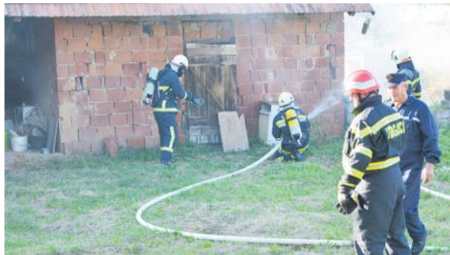
Uspješna zajednička vježba

● Dobrovoljni vatrogasci pokazali su kako u bratskoj suradnji djeluju u akciji.