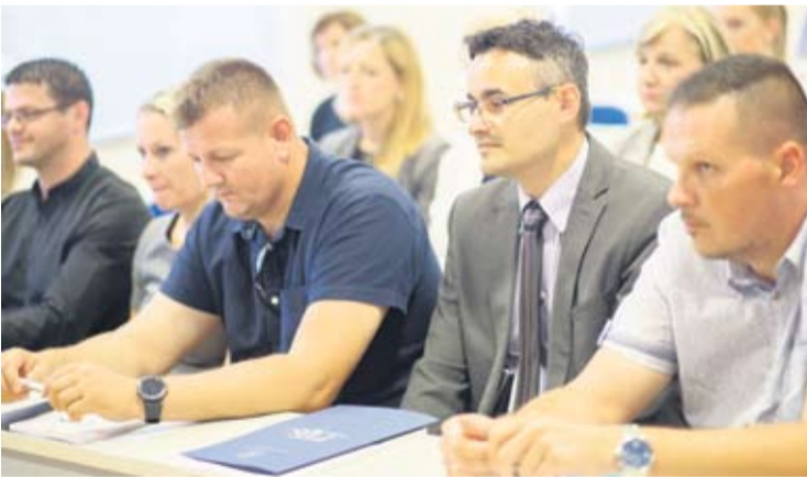
S početne konferencije u Visokoj školi Virovitica

Projektne partneri, Prehrambeno-tehnološki fakultet Osijek i Poljoprivredni fakultet u Osijeku, iznimno su važni zbog specifičnih znanja iz znanstvenog područja biotehničkih znanosti te su uključivanjem u projekt pristali dati doprinos u jačanju konkurentnosti poljoprivrede i prehrambeno prerađivačke industrije kroz istraživanje, razvoj