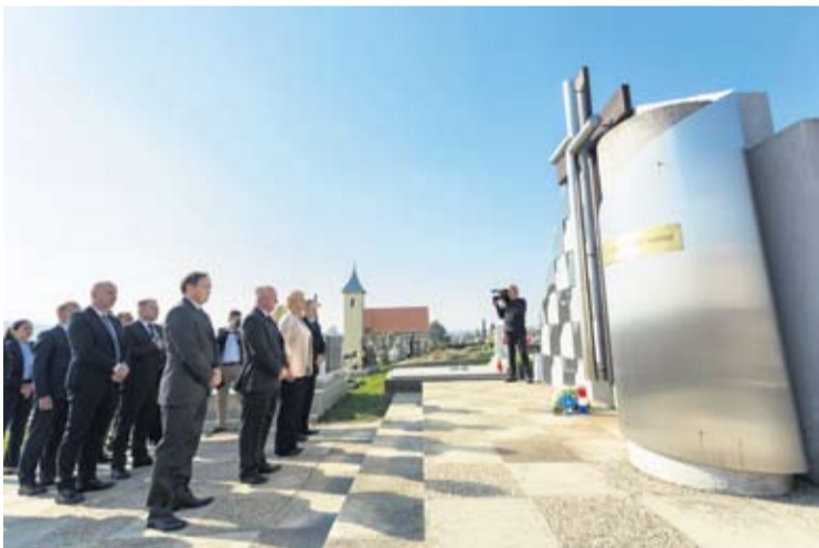
Poseban pijetet za žrtve Voćina, Čojluga, Balinaca i Mikleuša

Gradonačelnik Ivica Kirin sa suradnicima i projektnim partnerima te nadzorom projekta, a u pratnji potpredsjednika Vlade i ministra poljoprivrede Tomislava Tolušića te župana Igora Androvića sa suradnicima, predsjednicu Kolindu Grabar-Kitarović u četvrtak je proveo novouređenom šetnicom u centru Virovitice, ispred virovitičke Gimnazije Petra Preradovića. Upoznao ju je s jednim od najvažnijih gradskih projekata, s uređenjem dvorca Pejačević i Gradskog parka te šetnice ispred Gimnazije, čiji su radovi u tijeku. Gradonačelnik Kirin i voditeljica Integriranog projekta "5 do 12 za Dvorac" Đurđica Aragović, predsjednici su prezentirali sadržaje ovog važnog projekta te izrazili planove za budućnost, vezane za turizam i kulturu. Podsjećamo, ukupna je vrijednost ovog projekta, čiji je nositelj Grad Virovitica, 81.439.871 kunu, dok 66.659.100 kuna financira Europska unija. Provedbom Integriranog razvojnog programa unaprijedit će se upravljanje dvorcem Pejačević i Gradskim parkom u Virovitici te ujedno stvoriti konkurentna i obogaćena turistička ponuda. Projekt je pripremila Razvojna agencija VTA, a projektni partneri su Gradski muzej Virovitica, Turistička zajednica grada Virovitice, Turistička zajednica Virovitičko-podravске županije, Javna ustanova za upravljanje zaštićenim dijelovima prirode i ekološkom mrežom VPŽ i Drvni klaster Virovitičko-podravске županije VIDRIS.