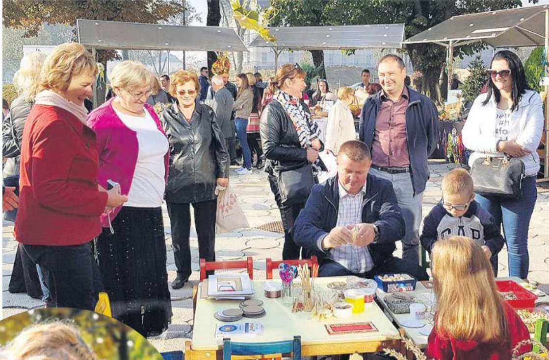
Organizatori i gradonačelnik družili su se s najmlađima

Zadovoljna odazivom i sadržajem bila je i Nedjeljka Županić iz Ekološkog društva Virovitice i