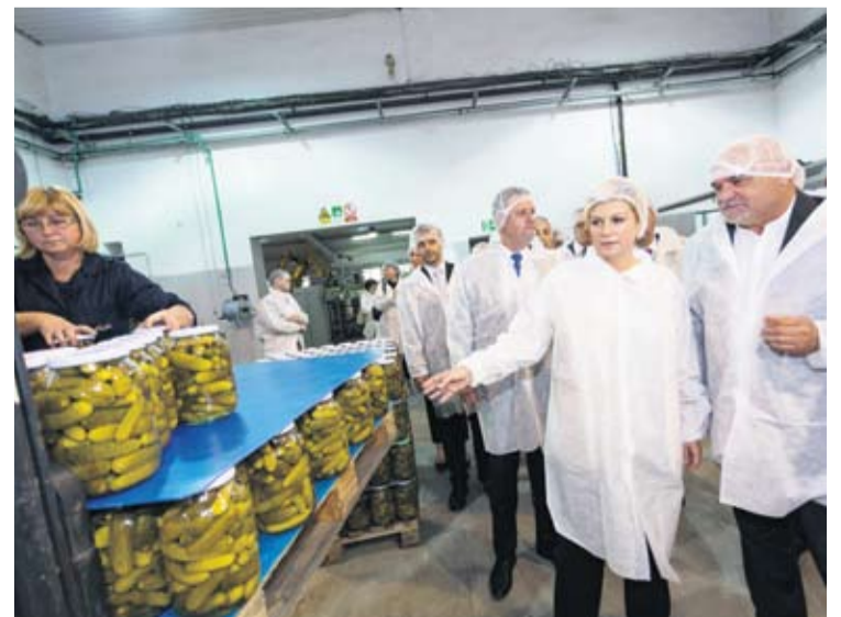
Marinada se predstavila svojim proizvodima

U Suhopolju se predsjednica Kolinda Grabar-Kitarović susrela s vodstvom Općine, na čelu s načelnikom Sinišom Horvatom i mještanima. Posebno je pohvalila i istaknula skrb Općine Suhopolje o djeci i mladima te korištenje europskih sredstava. - S pravom se ponosite svojom poviješću, osobito prelijepom crkvom sv. Terezije Avilske i dvorcem Janković – rekla je predsjednica Grabar-Kitarović, pohvalivši obnovu dvorca kao sjajan primjer skrbi o kulturnoj baštini i koraku naprijed k razvoju ruralnog i kontinentalnog turizma. U pratnji predsjednice, Suhopolje su posjetili i potpredsjednik Vlade Republike Hrvatske Tomislav Tolušić, župan Igor Andrović sa zamjenicima, predsjednik županijske Skupštine Miran Janečić te načelnik općine Sopje Berislav Androš.