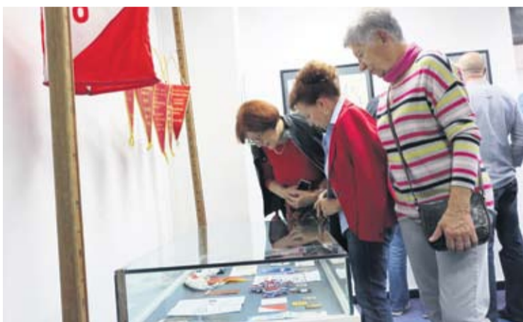
Na izložbi prezentirana bogata povijest HPD-a Papuk