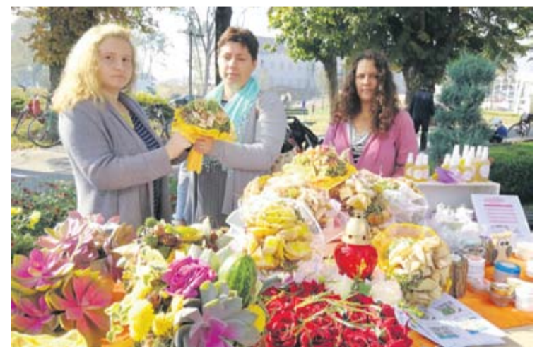
Učenici i mentori dobili su posebnu priliku predstaviti se posjetiteljima

UČENICI PRIPREMILI STARINSKU ROLADU, DALI SU NAM RECEPT