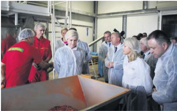
U tvrtki Šafram d.o.o. saznala je više o začinskom bilju