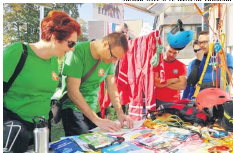
Oprema, karte i dobro društvo - kombinacija za uspješan izlet