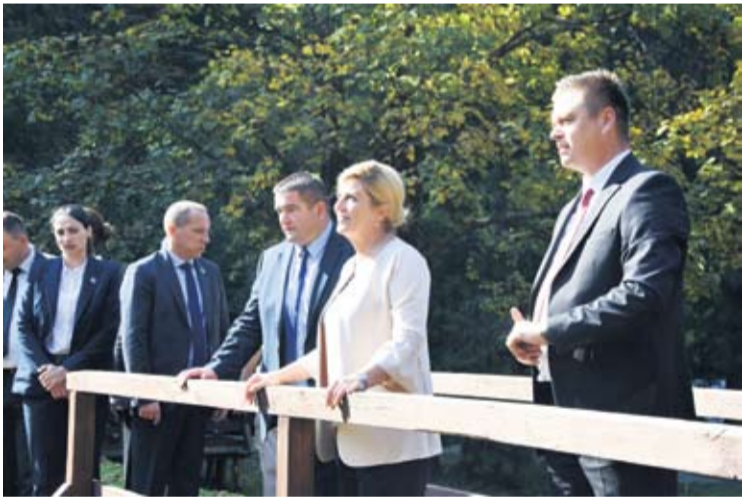
Ljepote Parka prirode Papuk oduševile su Predsjednicu