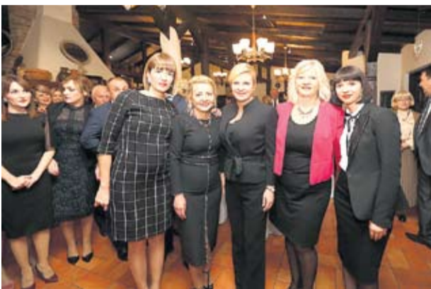
Predstavnice VIDRA-e i bivša ravnateljica s Predsjednicom

• Da bi prijavili projekt izgradnje farme muznih krava, morali smo poznavati proces proizvodnje mlijeka, zakon o gradnji, zakon o jednostavnim građevinama, poljoprivredne kalkulacije, izraditi investicijsku studiju, poznavati procedure javne nabave i sl. te je projekt znao težiti i do 32 kilograma papira – kaže E. Kovač.