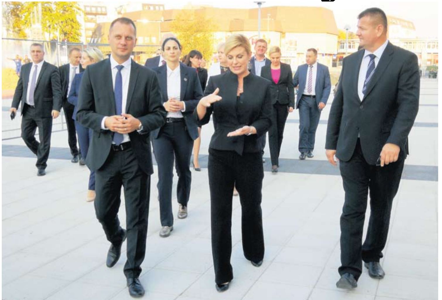
Predsjednica je obišla radove na šetnici i na uređenju dvorca Pejačević i Gradskog parka