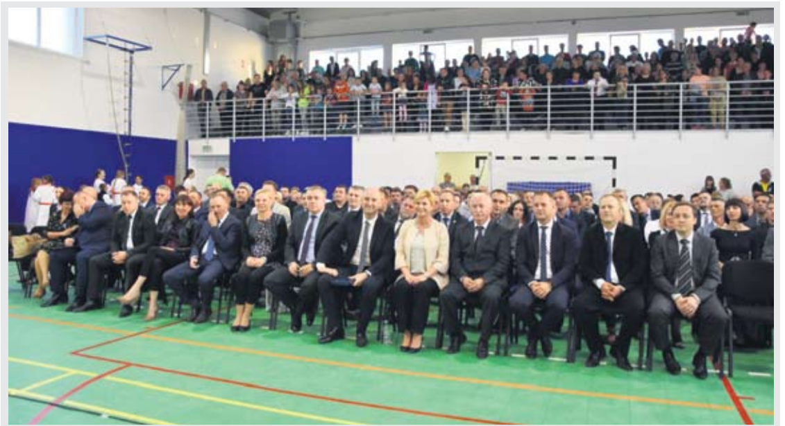
PREDSJEDNICA KAO POSEBNA GOŠĆA NA PROSLAVI DANA OPĆINE MIKLEUŠ

Predsjednica Kolinda Grabar-Kitarović obišla je i mjesta najvećih stradanja u Domovinskom ratu u našoj županiji – Četekovac i Voćin. U pratnji potpredsjednika Vlade Republike Hrvatske i ministra poljoprivrede Tomislava Tolušića, župana Igora Androvića i njegovih zamjenika, odala je počast na spomen-obilježju nevinim žrtvama na Mjesnom groblju u Četekovcu, a potom i u Voćinu. Ondje su je dočekali domaćini, načelnik općine Mikleuš Milan Dundović, načelnik općine Voćin Predrag Filić te pomoćnik ministra hrvatskih branitelja Nenad Križić.