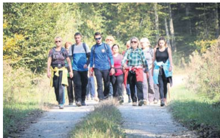
Izleti su osnova postojanja društva