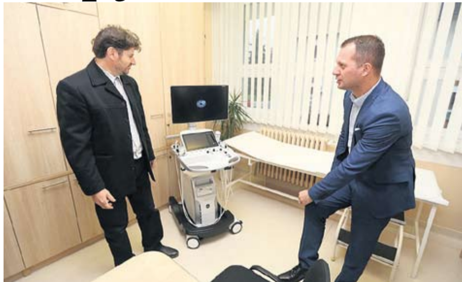
Dr. Ivica Fotez i župan Igor Andrović

Dom zdravlja Virovitičko-podravke županije odlučio je proširiti svoju djelatnost na fizikalnu terapiju u kući bolesnika te tako svim stanovnicima županije ovu medicinsku uslugu učiniti još dostupnijom. Navedenu su inicijativu na posljednjoj sjednici održanoj u ponedjeljak podržali i članovi Županijske skupštine. Inače, mrežom javne zdravstvene službe za područje Virovitičko-podravke županije propisano je šest timova fizikalne terapije u kući bolesnika (u Orahovici jedan, u Slatini dva i u Virovitici tri). S obzirom na to da za sada Slatina ima samo jedan tim, koji bi u budućnosti prestao s poslovanjem, Virovitičko-podravka županija kao osnivač te županijski Dom zdravlja odlučili su preuzeti brigu o djelatnosti fizikalne terapije u kući bolesnika i tako omogućiti još kvalitetniju njegu i zdravstvenu skrb za sve žitelje Virovitičko-podravke županije.