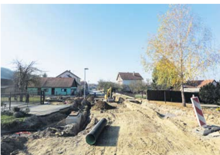
Ulica sv. Križa u Milanovcu bit će sigurnija i za pješake i za vozače