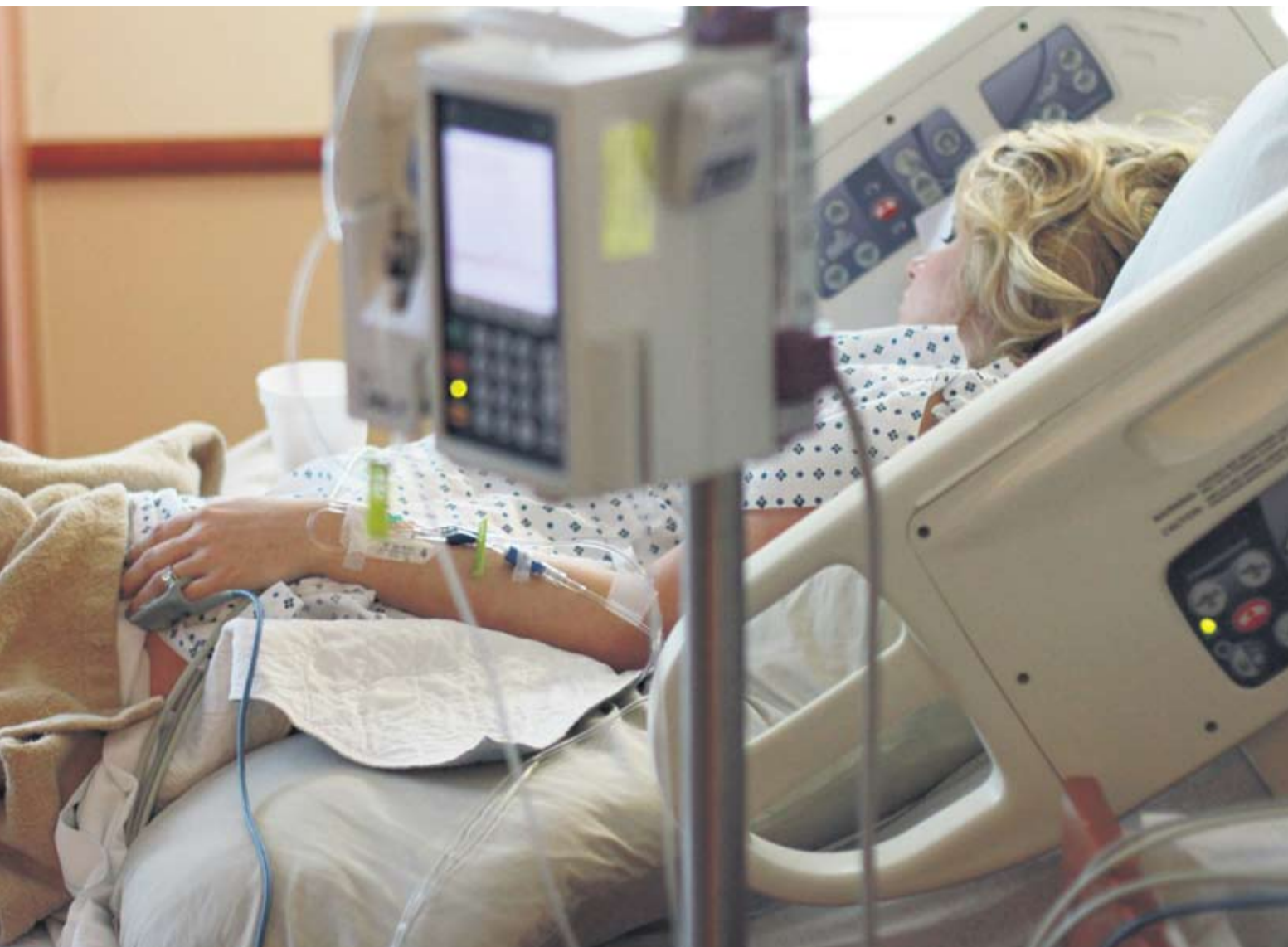
Pacijenti oboljeli od groznice Zapadnog Nila zasada su stabilno - ilustracija