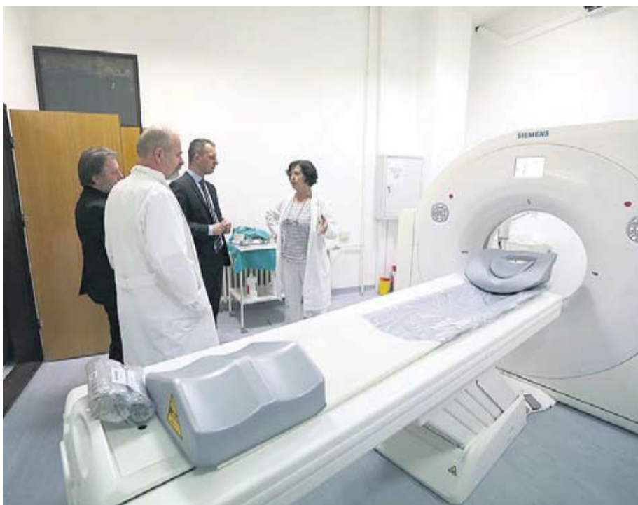
Uređaj u Virovitici olakšat će posao liječnicima, a pacijentima omogućiti bolju uslugu

HVALEVRIJEDNA INICIJATIVA VIROVITIČKO-PODRAVSKE ŽUPANIJE I DOMA ZDRAVLJA