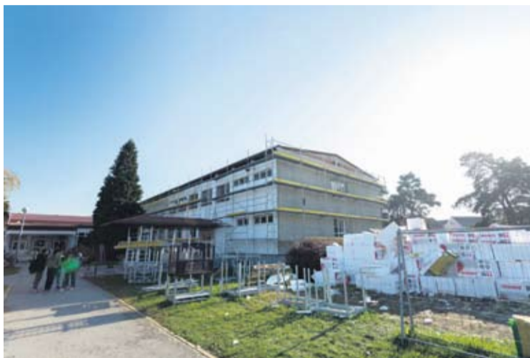
Škole i vrtići prolaze energetska obnovu