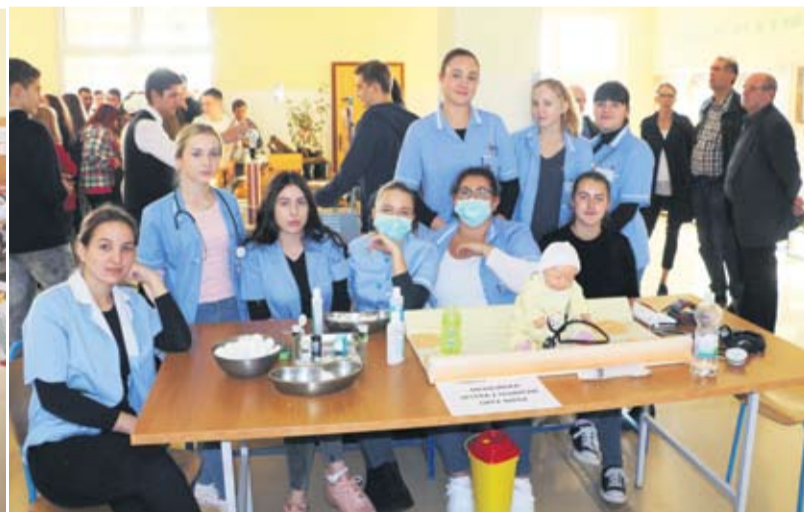
Medicinske sestre i tehničari sa svojim rekvizitima

U Strukovnoj školi Virovitica u utorak je obilježen 3. Europski tjedan vještina stečenih u strukovnom obrazovanju i osposobljavanju „Otkrij svoje talente“. Uz podršku Virovitičko-podravskije županije kao osnivača srednjih škola te u suradnji sa svim srednjim školama koje obrazuju za strukovna zanimanja predstavljena su zanimanja i posebnosti rada pojedinih škola kao nositelja strukovnog obrazovanja naše županije. Na sajmu strukovnih škola Virovitičko-podravskije predstavili su se: Tehnička škola Virovitica, Srednja škola Stjepana Sulimanca Pitomača, Srednja škola Marka Marulića Slatina, Industrijsko-obrtnička škola Slatina,