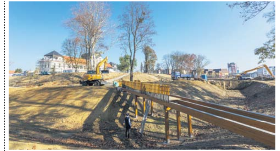
Glazbeni most bit će posebna atrakcija