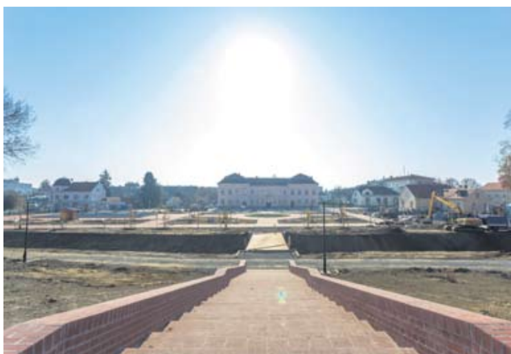
S vrha stepenica Gimnazija dolazi do izražaja

U PROLJEĆE KREĆE IZGRADNJA NOVE OSNOVNE ŠKOLE U VIROVITICI