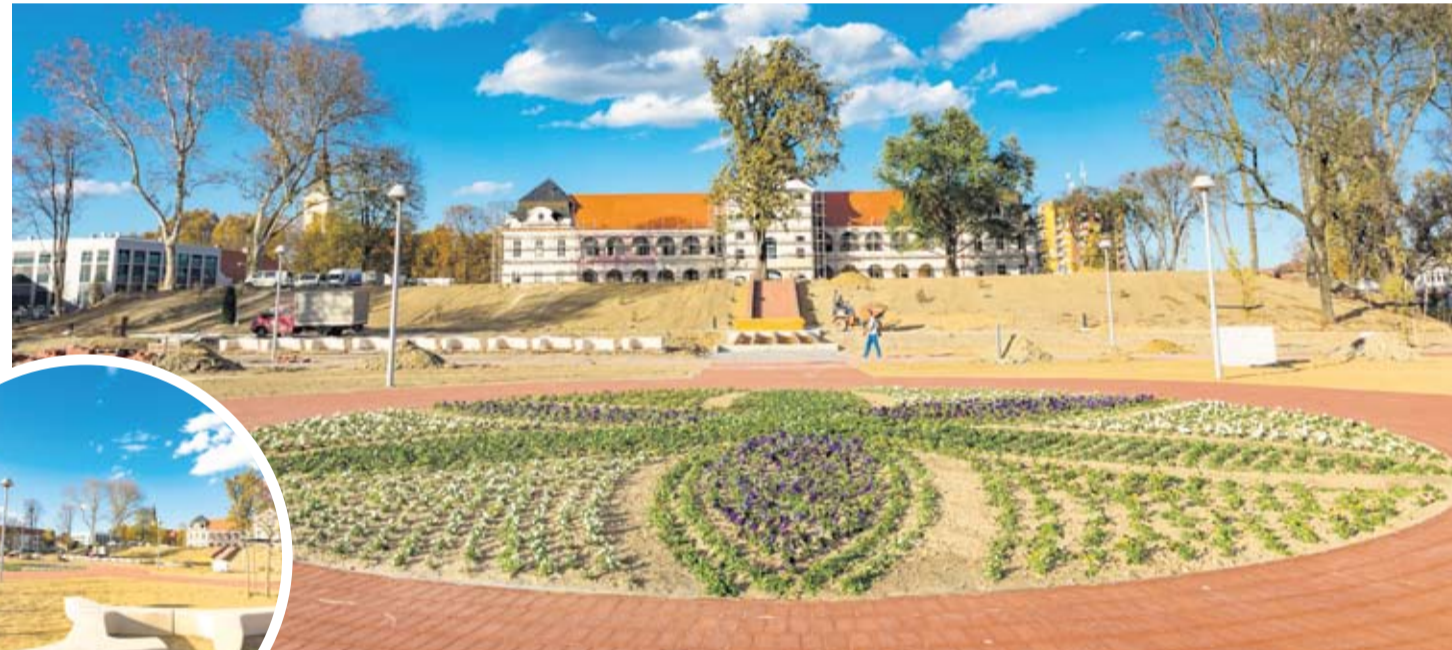
Novo lice virovitičkog centra i povijesne jezgre