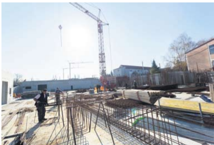
Radovi na novom COOR-u