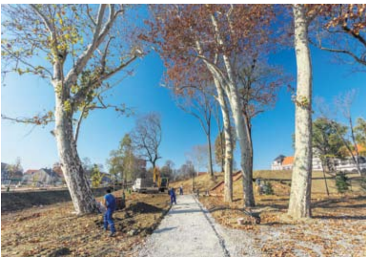
Staze u Gradskom parku uskoro su gotove

Suhi i topli jesenski dani pogoduju izvođenju niza građevinskih radova na području grada Virovitice. Uz najveći i najznačajniji projekt na području grada, obnovu Gradskog parka i dvorca Pejačević, tu su i radovi na novom Centru za odgoj, obrazovanje i rehabilitaciju i na trodijelnoj školskoj sportskoj dvorani, na dogradnji Aneksa B1 Dnevne bolnice u sklopu projekta Opće bolnice Virovitica, hali za sajam Viroexpo,