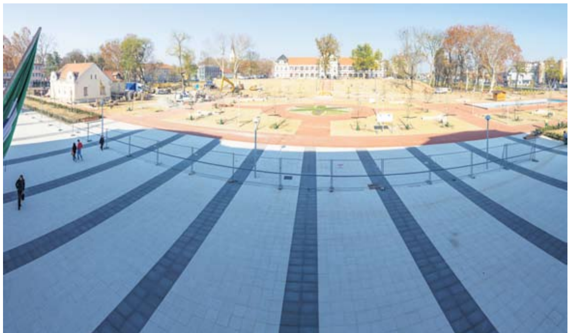
Pogled na šetnicu i centar koji se uređuje