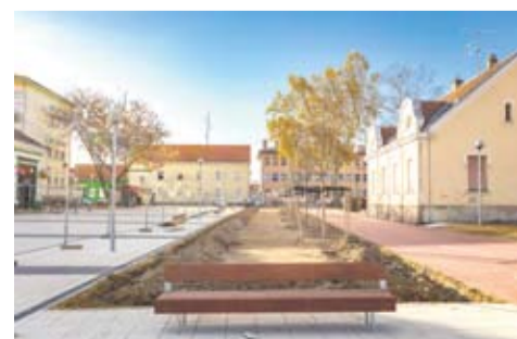
Šetnica i novi drvored mame prolaznike

pitavanja iz tog područja riješili, zahvaljujući širokoj skupini stručnjaka koji rade na projektu – kaže pročelnica Ureda gradonačelnika i voditeljica projektnog tima „5 do 12 za Dvorac“ Đurđica Aragović. Rade se opločenja u Dvorcu, krov će uskoro biti završen, fasada tek sada dolazi do izražaja, kao i sam Dvorac, u svoj svojoj veličini. I park dobiva novu vizuru, svoj konačan izgled.