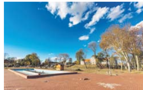
Fontana je posebna turistička priča

VRJEME IM IDE NA RUKU - Mogu reći da sam istinski zadovoljna. Rezultati su vidljivi, posebno na Dvorcu. Građevinski i obrtnički radovi u podmakloj su fazi, nakon problema sa statikom, došli smo do faze u kojoj smo gotovo sva