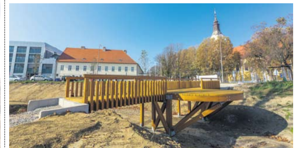
Most mladenaca ili most ljubavi čeka prolaznike