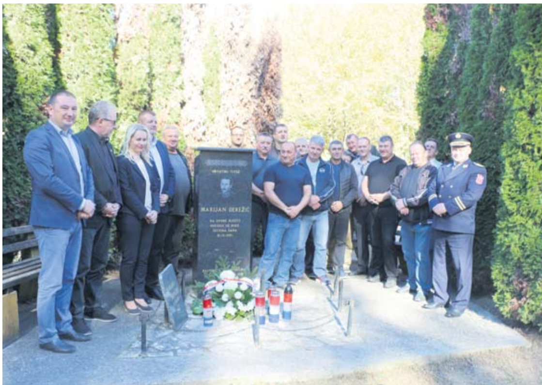
Izaslanstva Grada Virovitice, Policijske uprave VPŽ i braniteljskih udruga prisjetili se branitelja

U njoj je oslobođeno oko 300 četvornih kilometara okupiranog dijela Bilogore. - Nositelj te oslobodilačke operacije bila je 127. brigada Hrvatske vojske iz Virovitice, a u njoj su sudjelovali i: 19. MPOAD iz Virovitice, pripadnici