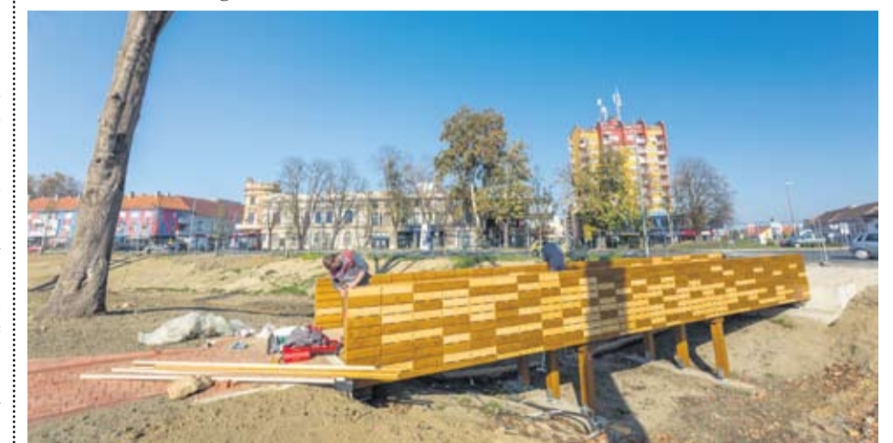
Most ogledala bavit će se iskrivljenom percepcijom