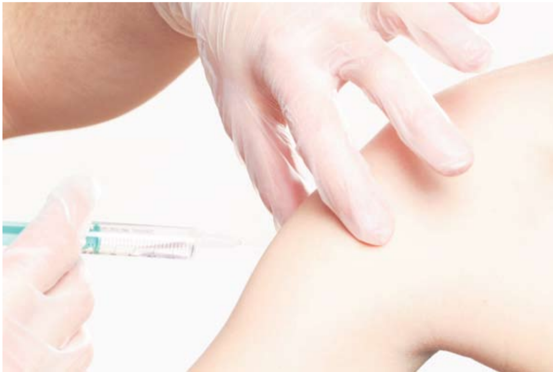
U Zavodu poručuju kako su osigurali dovoljan broj cjepiva

• Zavod za javno zdravstvo „Sveti Rok“ pripremio je 6.960 doza cjepiva Influvac koje je namijenjeno za sve dobne grupe. Cijepljenje se provodi u ambulantama liječnika opće (obiteljske) medicine ili u samom Zavodu.