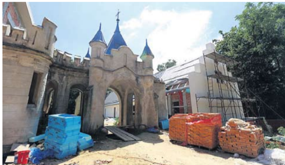
Dvorac Janković jedan je od važnijih projekata