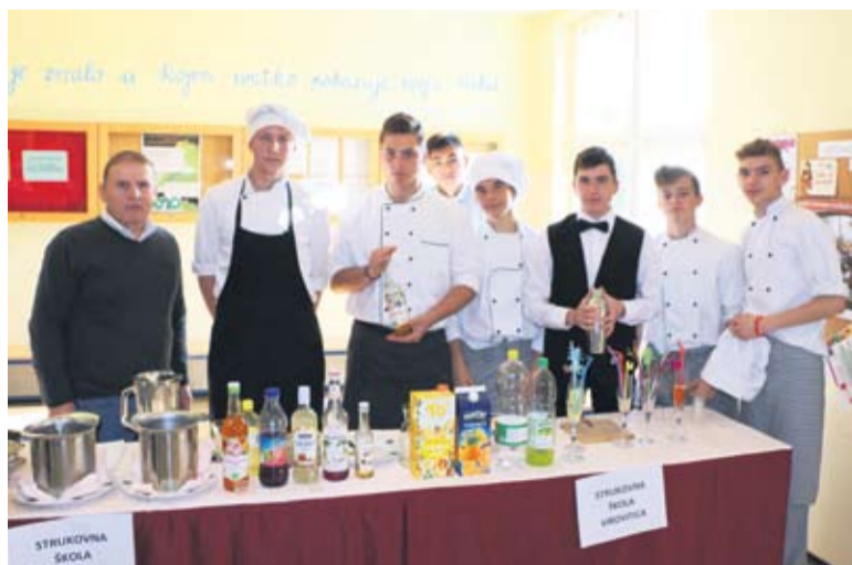
Kuhari i konobari demonstrirali su vještine

• Zamisao je bila da se okupe sve srednje strukovne škole Virovitičko-podravskije kako bi predstavile svoja zanimanja učenicima osnovnih škola i tako ih zainteresirale za neka od zanimanja škole.