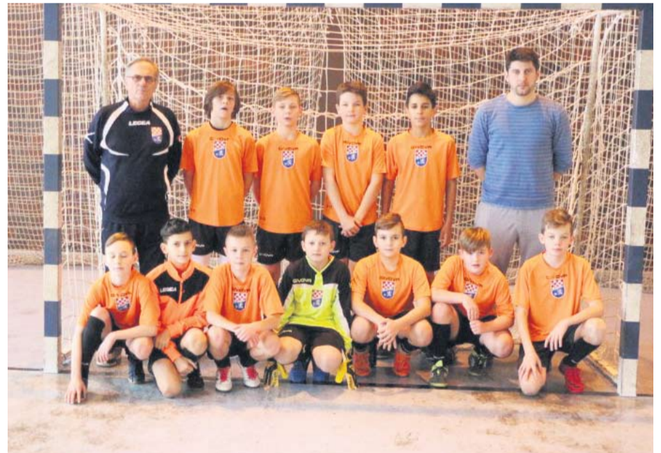
2007. godište Virovitica