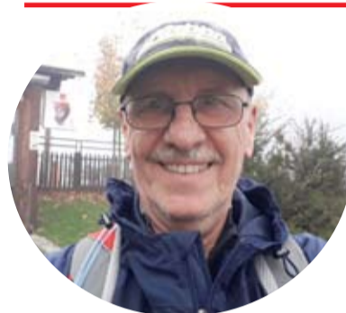
Aktivan i u umirovljeničkim danima

Organizirao je školska natjecanja u različitim sportskim disciplinama, a vrlo brzo uključio se u rad Hrvatskog školskog sportskog saveza. U dvama mandatima bio je član i Izvršnog odbora Hrvatskog školskog sportskog saveza. Deset godina sudjelovao je u organizaciji državnih prvenstava, kao koordinator rukometnih natjecanja, a dvije godine bio je glavni disciplinski sudac na državnim završnicama.