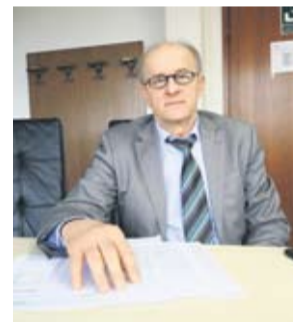
Predsjednik Uprave Hrvatskih šuma Krunoslav Jakupčić

Zbog velikog interesa korisnika produžen je rok za prijavu na Javni poziv za prikupljanje ponuda za davanje u zakup šumskog zemljišta u vlasništvu Republike Hrvatske. Javni poziv objavljen 7. prosinca trebao je biti otvoren do 22. prosinca 2018., a produžava se do 11. siječnja 2019. Uvjete za prijavu na Javni poziv zainteresirani mogu pogledati na službenoj internetskoj stranici Hrvatskih šuma.