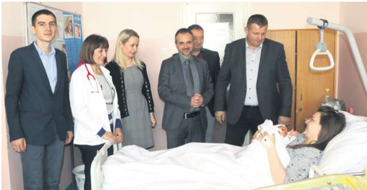
Gradonačelnik sa suradnicima izrazio lijepe želje

171 dijete s područja Virovitice rođeno je u 2018. godini na rodilištu Opće bolnice