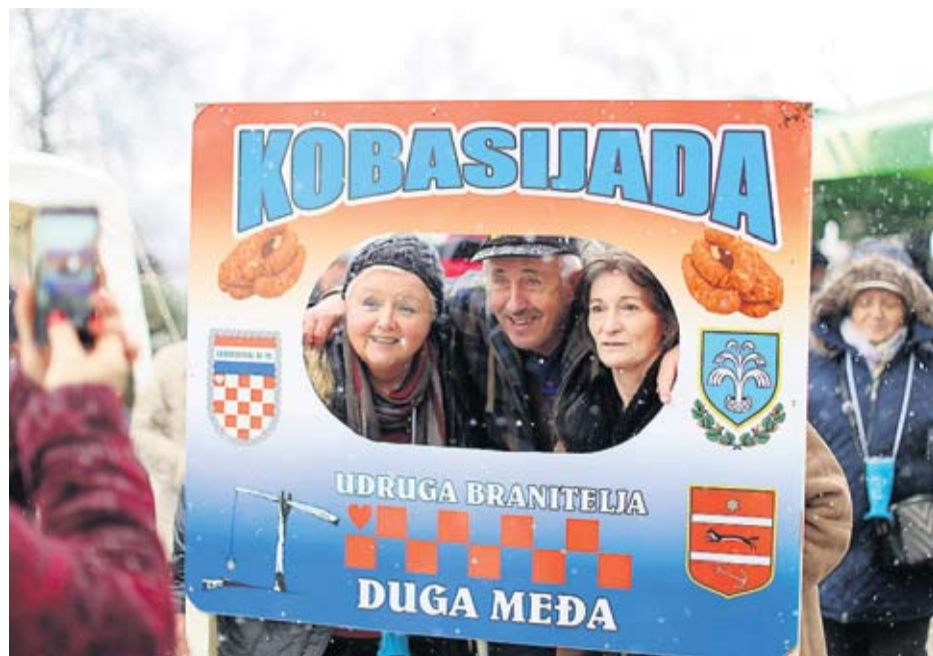
Dobra atmosfera na Kobasijadi

- Moram prije svega pohvaliti Udrugu branitelja iz Duge Međe, koja je ovo vrhunski organizirala i pokazala koliko