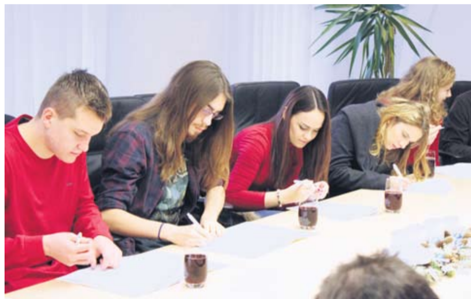
Studenti će primati 800 kuna cijele godine

– S obzirom na to da su zanimanja za koja su se studenti prijavili raznolika i da smo u njima vidjeli potrebu za grad Viroviticu i razvoj našega grada, komisija je predložila gradonačelniku da stipendiramo sve studente koji su zadovoljili uv-