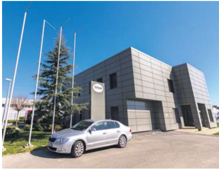
Virkom zadovoljan poslovanjem