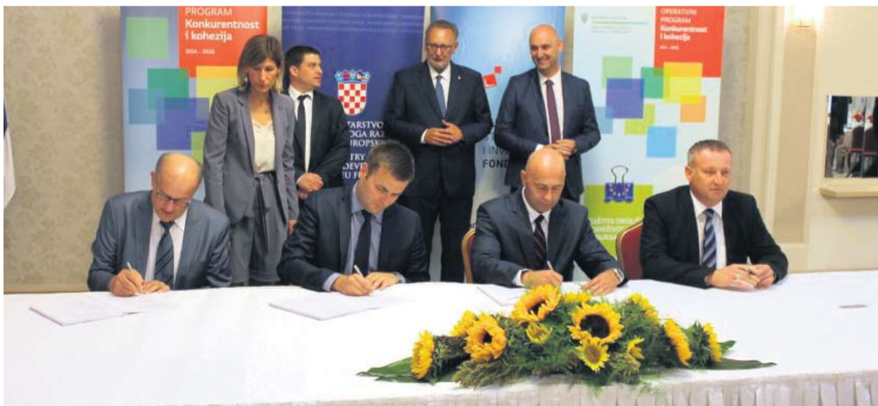
S potpisivanja ugovora vezanog uz novu Upravu šuma u Slatini

● Gospodarska je funkcija šuma na ovom području snabdjeti kvalitetnom sirovinom drvoprerađivače ovog kraja, kojih ima. Drvna industrija mora iskoristiti ovu priliku, sirovina je dostupna po pristupačnim cijenama, a distributivni i logistički troškovi nisu veliki jer su šumska područja relativno blizu pilanskim kapacitetima – objasnio je K. Jakupčić.