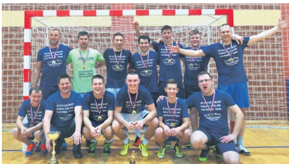
Momčad Matije Gupca drugu godinu zaredom osvojila turnir