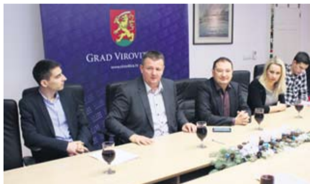
Gradska Uprava pomaže mladima

– Prihvatili smo sve studente koji su zadovoljili kriterije jer brojka nije važna, želimo pomoći studentima kako bi nakon fakulteta lakše pronašli posao, a ne kako bi lakše studirali. U ovim zimskim mjesecima pripremamo i dodatne odluke za stipendiranje i kroz stručne studije, osobito za one smjerove (tehničke)