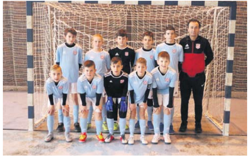
2007. godište No Limit