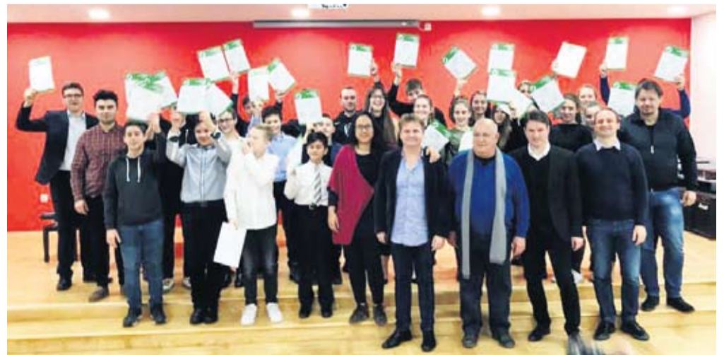
S polaznicima VIMM-a rade renomirani profesori