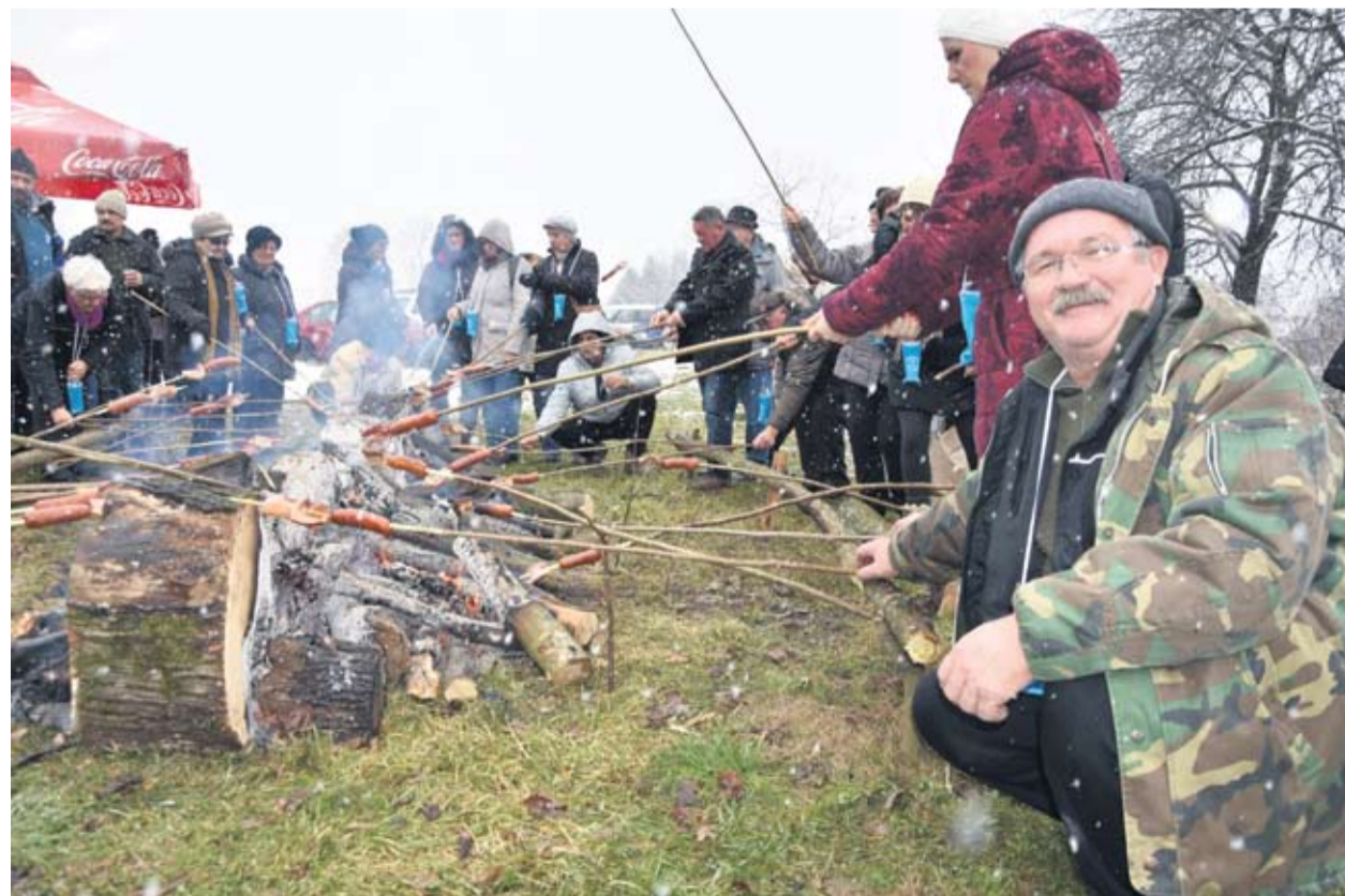
Posjetitelji su samo mogli ispeći meso