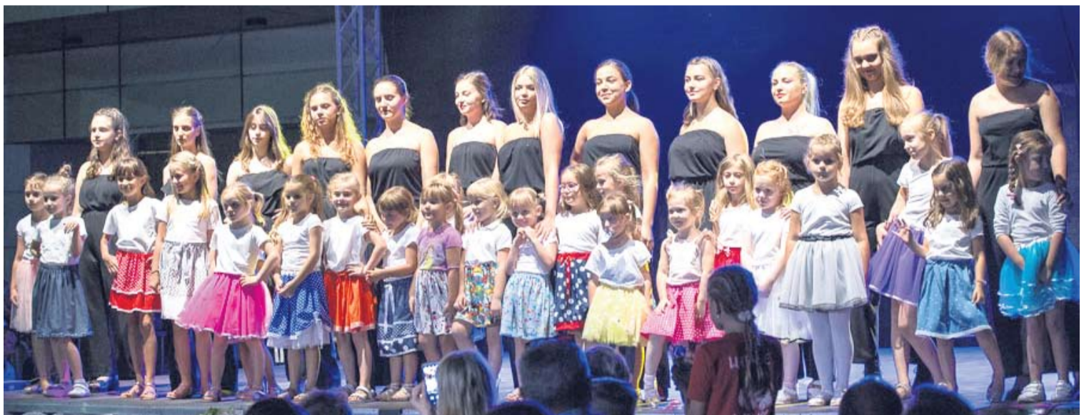
Modne revije odjeće i nakita privukle su brojne gledatelje i dobile izvrsne ocjene žirija

Uz centralnu reviju nakita održale su se i dvije prateće. Prva je bila revija svečanih haljina Vlaste Despotovski, vlasnice VD