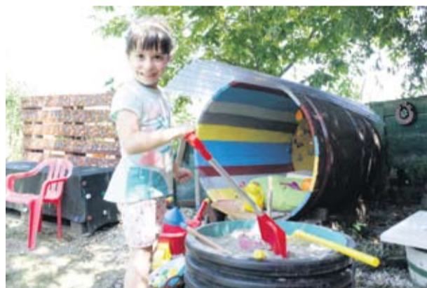
Najmlađi članovi obitelji uživaju u recikliranom igralištu