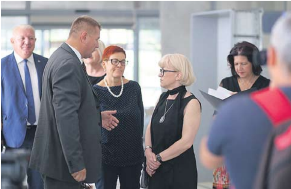
Ministrica V. Bedeković u pratnji domaćina i ravnateljice izrazila je zadovoljstvo napretkom radova

čitav niz usluga u zajednici, što smatram jednim dobrim putem prema osnaživanju hrvatskog društva – istaknula je V. Bedeković naglasivši važnost takvih projekata koji predstavljaju pomoć najranjivijim kategorijama građana.