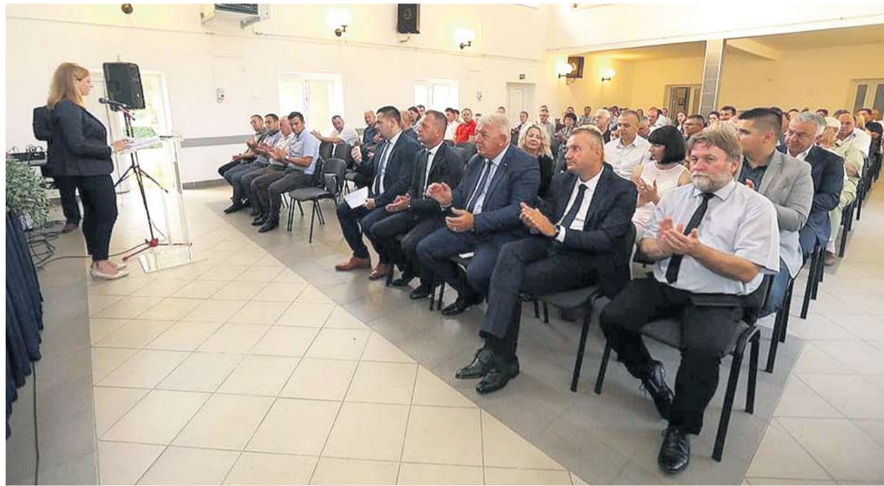
Sa svečane sjednice u Suhopolju