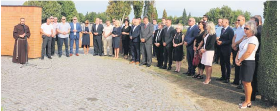
Odana počast braniteljima

Govoreći o najvažnijim projektima za budućnost, uz izgradnju škola i vrtića i ulaganja u komunalnu infrastrukturu, istaknuo je uređenje Virovitičkih ribnjaka te izgradnju brze ceste do Vrbovca.