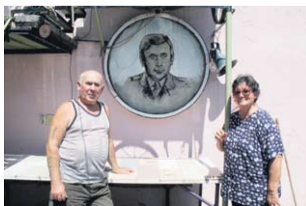
Belanijevima je drag portret koji su dobili na poklon