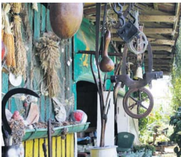
Svaki kutak imanja ima svoju priču