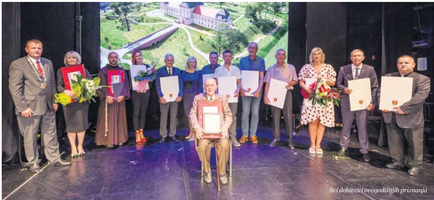
Svi dobitnici ovogodišnjih priznanja