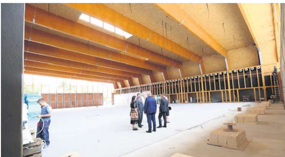
Novom prostoru raduju se nastavnici i djeca