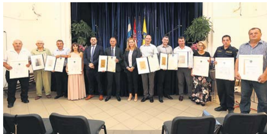
Dobitnici ovogodišnjih priznanja

građevinarstvo i projektiranje, za dugogodišnju uspješnu suradnju i izniman doprinos u izgradnji cestovne infrastruk-