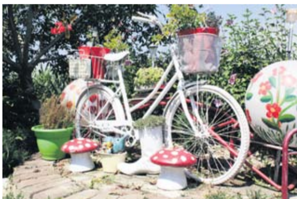
Stari predmeti dobili su novo ruho