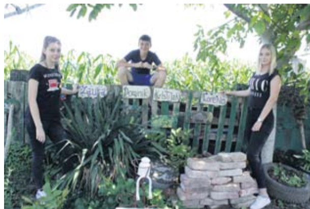
Mlade generacije nastaviti će raditi na kreativnosti