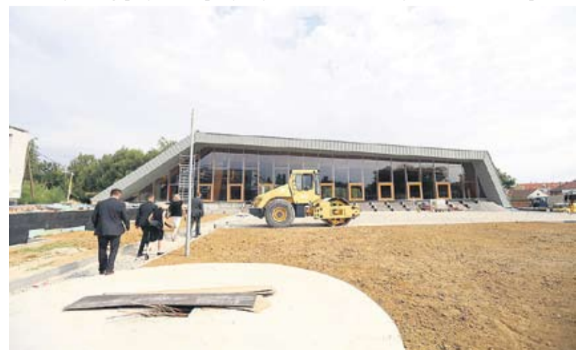
Prilikom obilaska domaćini i gosti imali su prilike saznati više o samoj opremi i budućim programima

Naglasila je važnost ove ustanove za cijelu Virovitičko-podravsku županiju, ali i šire. – U ovoj ustanovi prije svega će se moći odgajati, obrazovati, educirati i rehabilitirati djeca s teškoćama u razvoju i odrasle osobe s intelektualnim teškoćama, ali jednako tako će se pružati