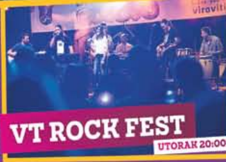
UTORAK 20:00h VT ROCK FEST