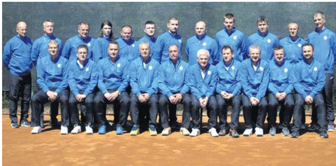
Članovi Teniskog kluba „Tvin“ Virovitica

● Plan Kluba u narednom periodu je svakako omasovljenje članstva i rad s djecom. Očekujemo i daljnje uspjehe naše seniorske te veteranske selekcije. Nastojat ćemo organizirati veći broj turnira i nadam se uspješnoj suradnji s klubovima iz regije. Također, imamo i jedan veliki cilj, a to je omogućiti svim članovima Kluba i natjecateljima uvjete za treniranje u zimskom periodu – rekao je trener Saša Felendeš.