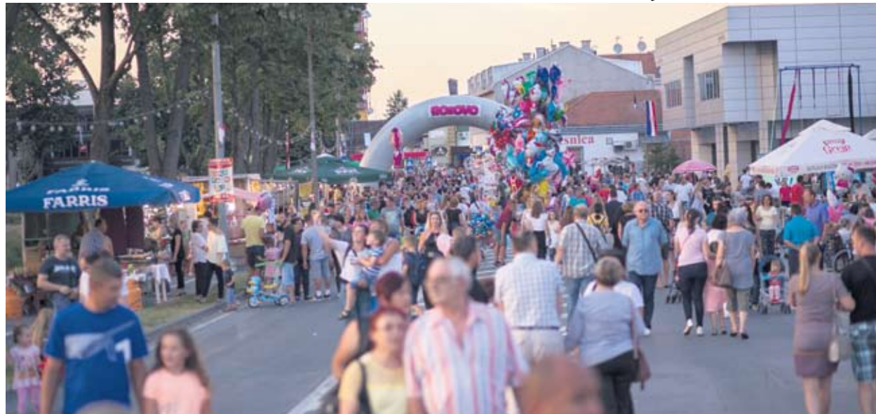
Virovitica za Rokovo okupi tisuće posjetitelja

U ranim jutarnjim satima probudit će vas naša Gradska glazba. Tijekom dana možete posjetiti štandove naših udruga, kao što su Lions Club Vereucha, koja će održati humanitarnu akciju „Kolač za prijatelja“, te izložbe COOR-a Virovitica, Udruge za Down sindrom Virovitičko-podravske županije i Češke besede Virovitičko-podravske županije. Svetom misom i procesijom slavit će se dan našeg zaštitnika, sv. Roka. Bit će tu i sportskih događanja kao što su međunarodni No Limit ljetni kup i muški rukometni turnir. U večernjem programu nastupit će KUC Virovitica, a u organizaciji Glazbene škole će se održati promenađni koncert Gradske glazbe Virovitica i Gradske glazbe Stolac iz BiH. U VUF-ovom Cabaret Showu moći ćete vidjeti ples na svili, a u Drum Showu doživjeti „buku“ bubnjara. Kao finale, koncert Massima. Drago mi je da Massimo dolazi kod nas, osobito ove godine, zato što je Massimo u suradnji s našim virovitičkim bendom Vatra ove, 2019. godine, osvojio Porina za najbolju vokalnu suradnju za hit „Nama se nikud ne žuri“. Sve završava velikim vatrometom u ponoć.