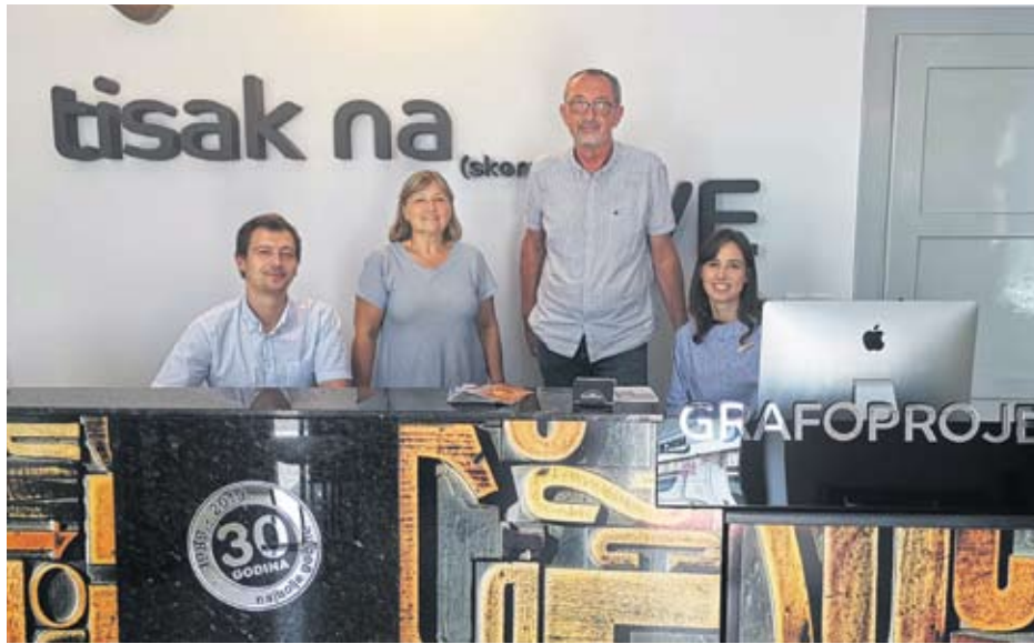
obitelj Božanić ponosna na svoju tvrtku

Zajedno s obitelji, zaposlenicima, suradnicima, kupcima, dobavljačima i prijateljima, Grafoprojekt je ove godine proslavio svoj 30. rođendan. Velika vrtna zabava s mnogo nasmijanih lica obilježila je tri desetljeća postojanja i uspješnog poslovanja ove virovitičke tvrtke.