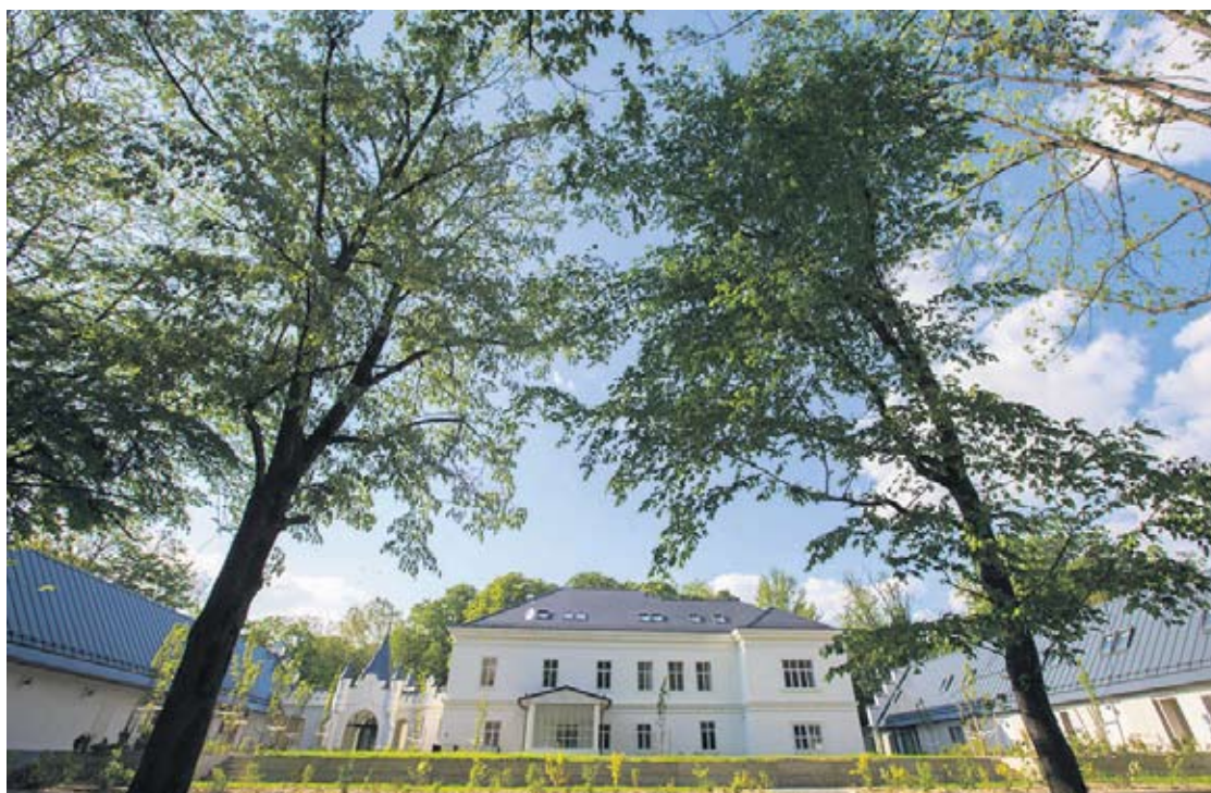
Obnovljeni dvorac Janković