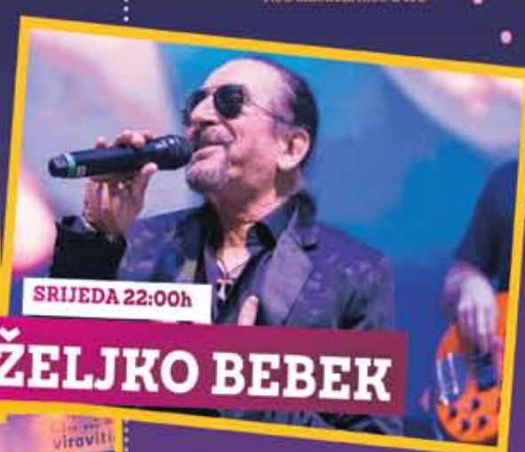
SRIJEDA 22:00h ŽELJKO BEBEK