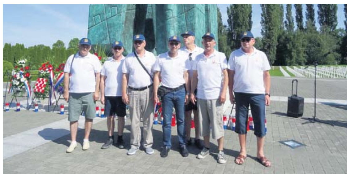
Posjet Vukovaru jedan je od načina čuvanja uspomene na Domovinski rat

● Premda je to nemala volonterska obveza, za mene je to i velika čast jer predvodim skupinu ljudi koji su u ratu pokazali iznimne sposobnosti, vodili ljude u najtežim okolnostima, odgovarali za njihove živote, pružili ogroman doprinos u obrani, oslobađanju države i stoga sam na njih ponosan – ističe ovaj umirovljeni bojnici HV-a.