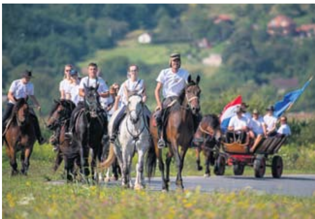
Spoj prirode, ponosa i uživanja

– Svaki ovaj spomenik simbolizira hrvatsku državu, vjeru, obitelj i čovjeka koji se borio za svoju obitelj, stvarajući pritom domovinu. Oni kojima je stalo do naše domovine stat će ovdje, pognuti glavu i sjetiti se žrtve koju su branitelji podnijeli te je usmenom predajom prenijeti na mlade koji ostaju – istaknuo je gradonačelnik.