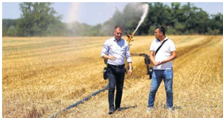
Čak 92 milijuna kuna uloženo je u poljoprivredne projekte

Lani je županijska Razvojna agencija VIDRA obilježila deset godina rada, a u suradnji s Virovitičko-podravskom županijom, općinama, poduzetnicima i gospodarstvenicima te poljoprivrednicima provela je 251 projekt ukupne vrijednosti veće od 116 milijuna eura. Iza njih su obnovljeni dvorci, škole, vrtići, bolnice, domovi zdravlja, nova oprema za poljoprivrednike, plas-tenici, veliki i krucijalni projekti. V.L.