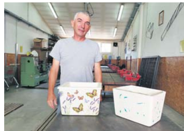
S nekim od proizvoda koji je napravio s učenicima