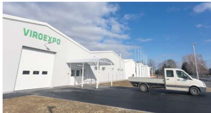
Uz pomoć EU sredstava izgrađena je multifunkcionalna hala Viroexpo