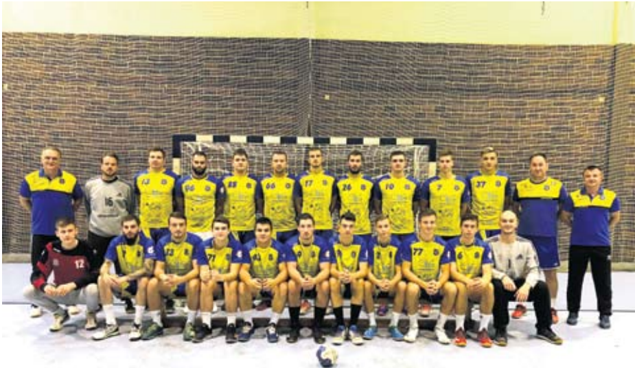
Prošlosezonski seniorski sastav

S današnje distance teško je reći koji je stariji od dva rukometna kluba u Virovitici, ženski ili muški. U oba kluba smatraju da je baš njihov stariji. Sigurno je da su oba osnovana 1949. godine, kada je profesor Viliam Tičić u virovitičke gimnazijalce utkao ljubav prema novom