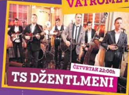
ČETVRTAK 22:00h TS DŽENTLMENI