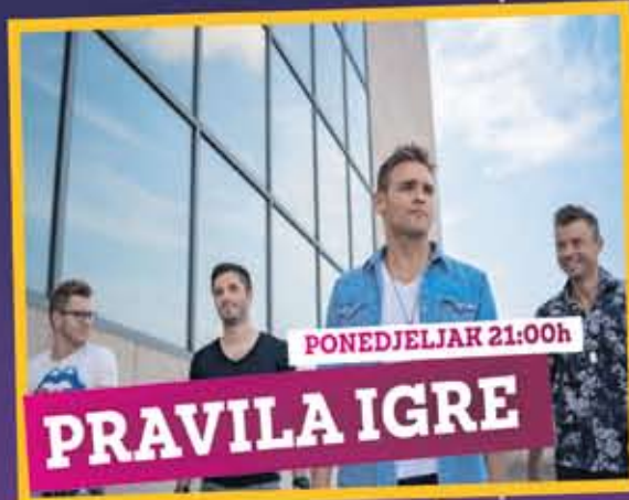
PONEDJELJAK 21:00h PRAVILA IGRE