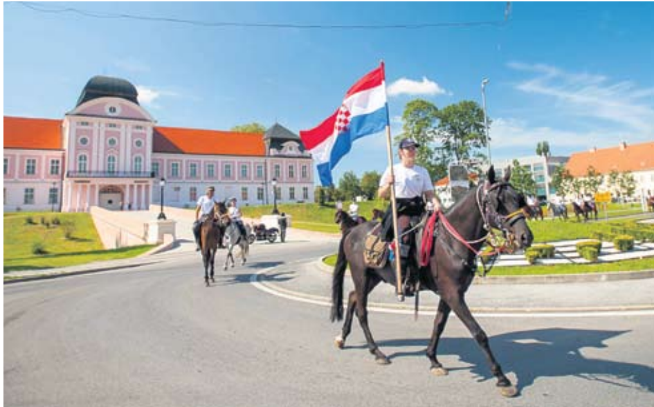
Maraton je prošao centrom grada Virovitice