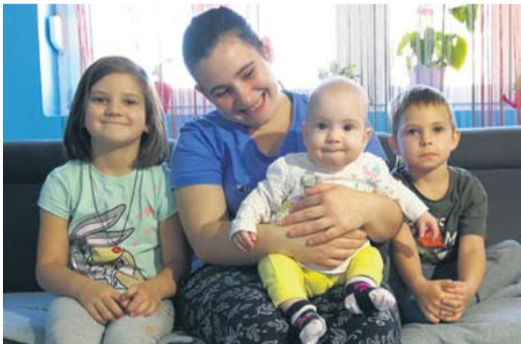
Valentina voli aktivniji ritam