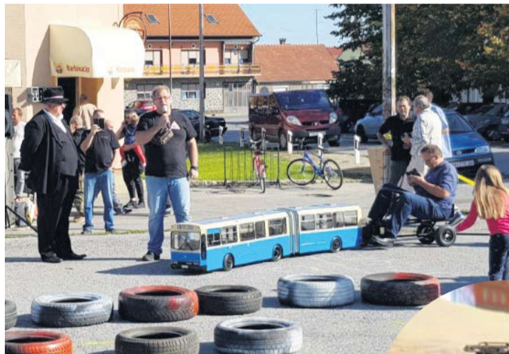
Velika izložba malih vlakova privukla mnoštvo posjetitelja

• Cilj nam je produžiti događaj s jednog na dva dana kako bi izlagači koji dođu izvan Virovitice, ali i Hrvatske mogli uživati u svemu što im imamo za ponuditi, ali i kako bi zainteresirani duže imali priliku razgledati i sudjelovati u sadržajima – zaključuje organizator IX. Burze malih vlakova i autića.