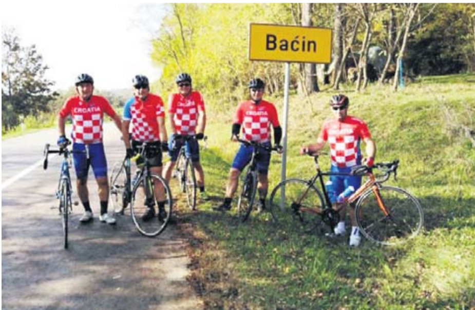
Drugi memorijski biciklistički maraton od Voćina do Baćina

● Nakon odavanja počasti nevinim civilnim žrtvama, načelnica općine pokazala je sudionicima biciklističkog maratona spomen-sobu te im iskazala zahvalnost na inicijativi i organizaciji ovog biciklističkog maratona, kako se žrtve Baćina i Voćina nikada ne bi zaboravile.