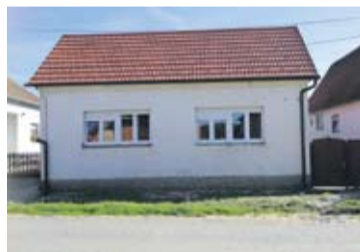
Blizanke su kući stigle krajem kolovoza