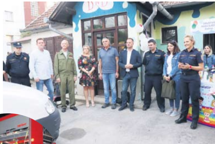
Vrijedna donacija bit će dobro iskorištena

- Zadovoljstvo nam je bilo obići vaše vatrogasne postrojbe u kojima su ispunjeni svi potrebni uvjeti za čuvanje dobivenih vozila i opreme, što je garancija da će se donacija iz Tirola nas-