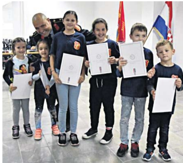
Zahvalnice najmlađim članovima

● Zahvaljujem svim vatrogascima koji su tijekom povijesti čuvali i danas čuvaju ovu našu humanu organizaciju te ju čine velikim ponosom svoga mjesta i Virovitičko-podravskoga županije – rekao je predsjednik Ileš, zahvaljujući čijem je sjećanju i napornom radu očuvana arhiva ovoga Društva.