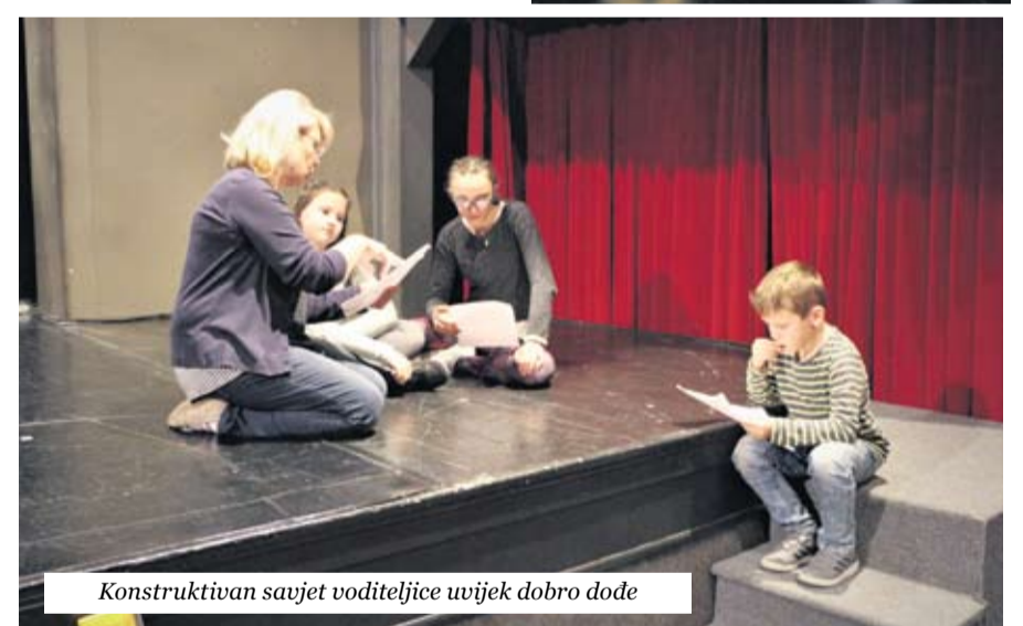
Konstruktivan savjet voditeljice uvijek dobro dođe