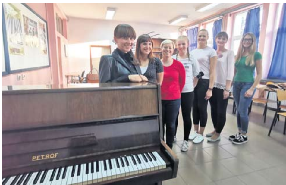
Biti savršeno usklađen u višeglasju zadatak je koji zahtjeva savršen sluh i mnogo truda

SUHOPOLJE U DUŠI Prilikom jednog nastupa u Vukovaru trebalo je smisliti ime kako bi ih voditelj mogao predstaviti. Željele su, kažu, nositi ime koje predstavlja Suhopolje, grofovsko mjesto koje su sve na neki način vezane. I tako se Contesse stvorilo kao savršen izbor. Suhopoljske Contesse danas čine sopranistice Leo-