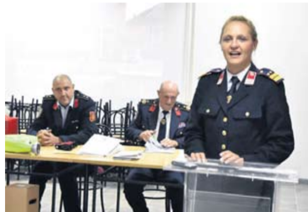
S proslave velikog jubileja