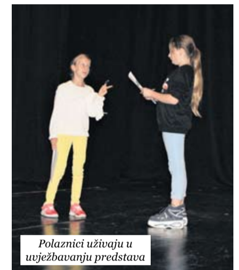
Polaznici uživaju u uvježbanju predstava

Verbalno izražavanje, imaginacija, opažanje, doživljavanje, osjetilnost i izražajnost ono su na što se druženjem i zajedničkim radom potiče kod svakog polaznika.