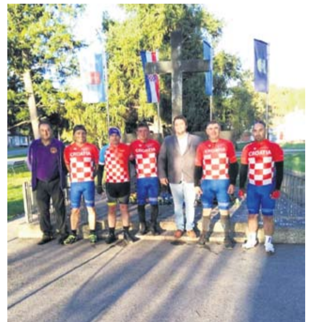
Odavanje počasti nevinim žrtvama srbočetničkog terora

Na svom putu biciklisti su zastali kako bi odali dužnu počast poginulim hrvatskim braniteljima u Kamen-