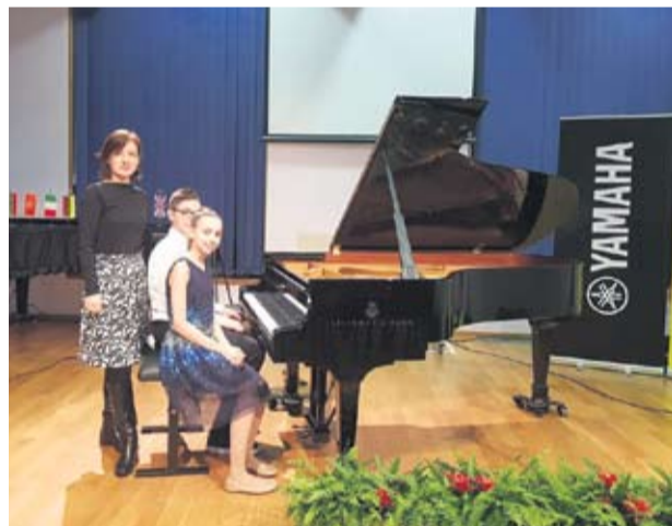
MLADI VIRTUOZI ZAGREB 2020.

ljepote i tradicionalna podravska kultura kroz sva četiri godišnja doba prikazala u najboljem svjetlu.