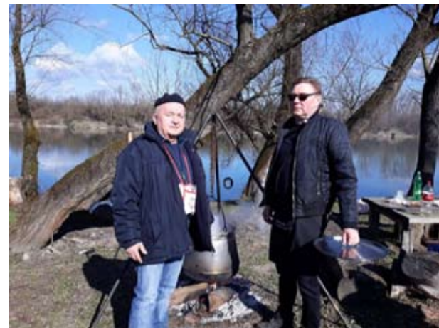
Mogla se kušati pržena bijela riba, šaran na rašljama, ukusni paprikaš, ali i svinjski odresci na žaru i nezaobilazno prase s ražnja

Na lijepu, sunčanu obalu rijeke Drave došli su kao i svake godine i predstavnici lokalne samouprave, pa je tu svoje „mjesto za stolom u prirodi“ našao i pročelnik Upravnog