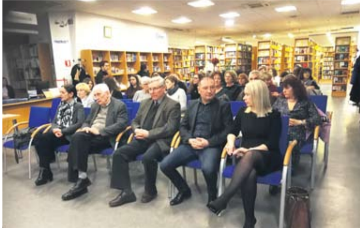
U Gradskoj knjižnici i čitaonici u Virovitici svečano otvoren 13. Tjedan psihologije Virovitičko-podravске županije

Govornici koji su publiku proveli kroz 20 godina aktivnog rada naglasili su kako djeluju unutar Društva s važnim