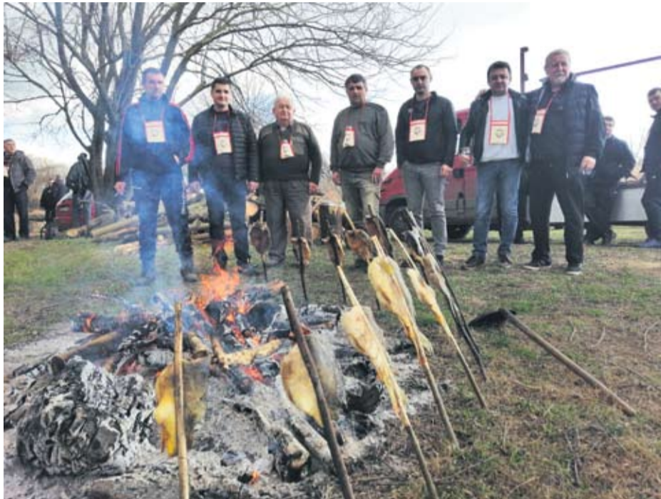
Tradicionalno druženje ribiča na desnoj obali rijeke Drave pod nazivom „Danji manjića“ održava se svake godine u Terezinom Polju

● Ovaj popularni događaj organizirali su Športsko-ribolovni klub Drava iz Terezinog polja uz pomoć MO Terezino polje i glavnog pokrovitelja, Općinu Lukač. Članovi Kluba još jednom su se pokazali kao pravi domaćini, koji su za sve posjetitelje manifestacije pripremili niz raznih delicija, tako da se tu mogla kušati pržena bijela riba, šaran na rašljama, ukusni paprikaš, ali i „plodovi tora“, svinjski odresci na žaru i nezaobilazno prase s ražnja.