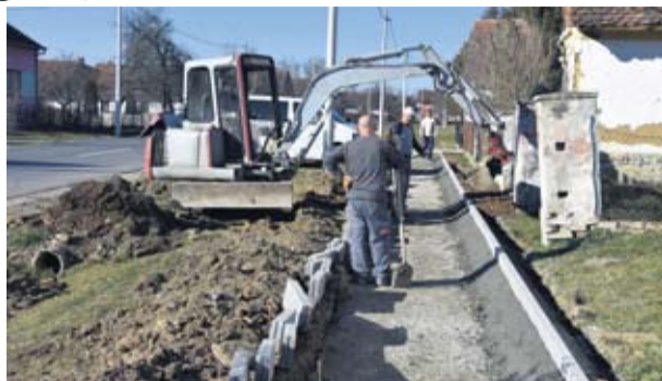
Nastavak izgradnje pješačkih staza po cijeloj općini