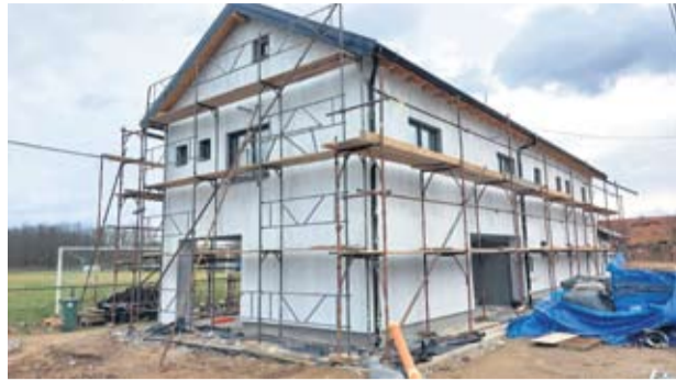
Uređenje mjesnog doma u Novoj Šarovki, završetak radova ožujak 2021.