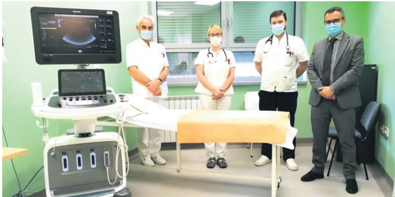
Novi ultrazvuk trebao bi pomoći da se i oni problemi koji su dosad bili oku nevidljivi, a tiču se neumornog organa (srca) i s njim povezanih krvnih žila u našem tijelu lakše uoče

najmome stanova liječničkog osoblja jedan su od načina privlačenja liječnika na područje Virovitičko-podravске županije i Virovitice. Mi im nudimo uvjete da njihov rad, zahvaljujući modernoj tehnologiji, bude iste kvalitete kao u Zagrebu, Osijeku ili ovdje Virovitici - poručio je župan.