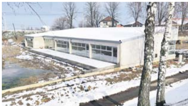
Izgradnja Dječjeg vrtića je najveći i najskuplji projekt