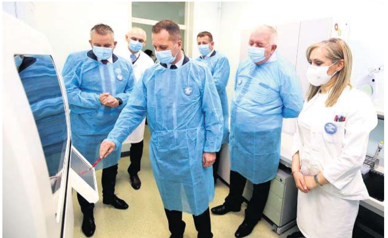
Novi, 860 tisuća kuna vrijedan PCR uređaj za testiranje na koronavirus pušten je u rad