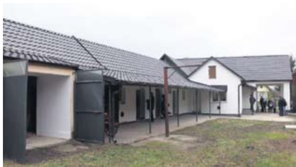
Mjesni dom u Starinu