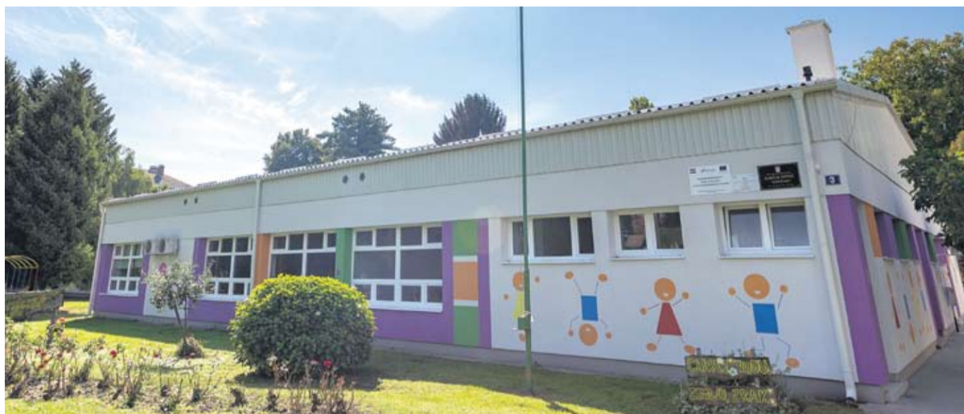
Vrtić je mjesto na kojem se odmah nakon obitelji stvaraju prve zdrave navike