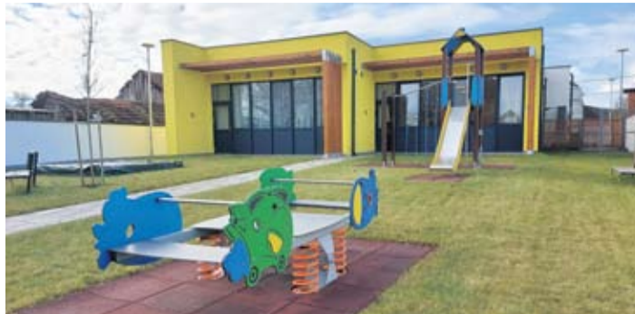
Dječji vrtić "Bambi" Sopje, projekt u 2020.