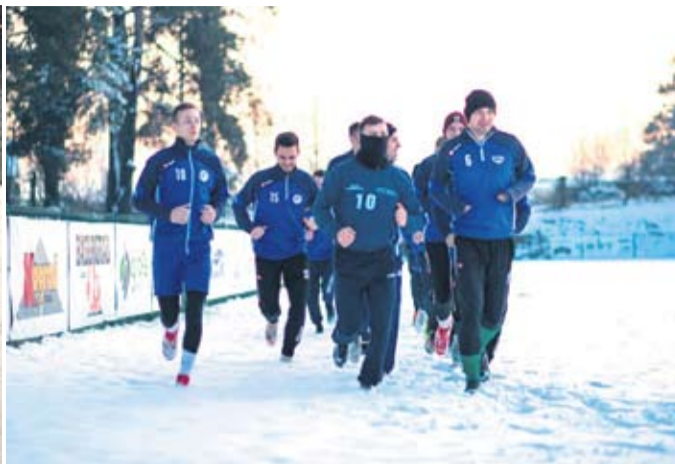
Nogometaši Pitomače jedva su dočekali da istrče na teren