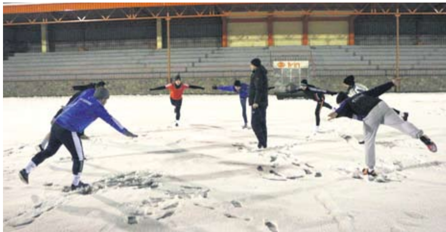
Ovog proljeća Rezovčani će svoje treninge i utakmice imati na terenima Sportskog centra Tvín