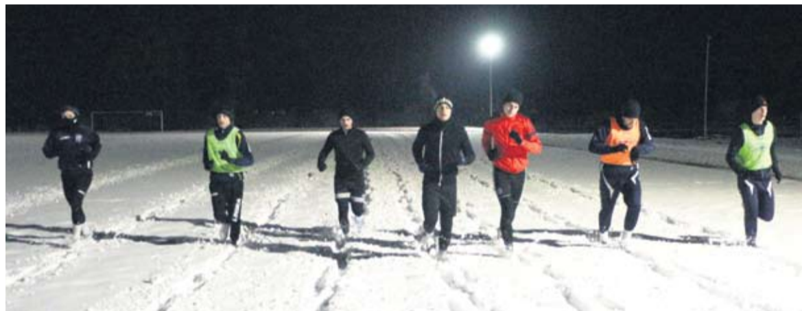
Duboki snijeg nije bio prepreka igračima Virovitice za trkačke dionice

● Za sada nema igračkih promjena, ali vode se pregovori s nekoliko potencijalnih prinova. Do kraja tjedan vidjet ćemo što će biti s odigravanjem pripremnih utakmica. Do predviđenog nastavka natjecanja ostala su četiri tjedna, objasnio je trener Bosilkovski.