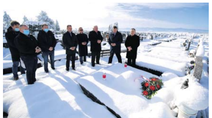
Počast preminulim članovima na virovitičkom Gradskom groblju