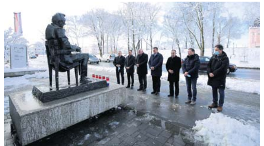
Lampioni pored spomenika prvog hrvatskog predsjednika dr. Franje Tuđmana