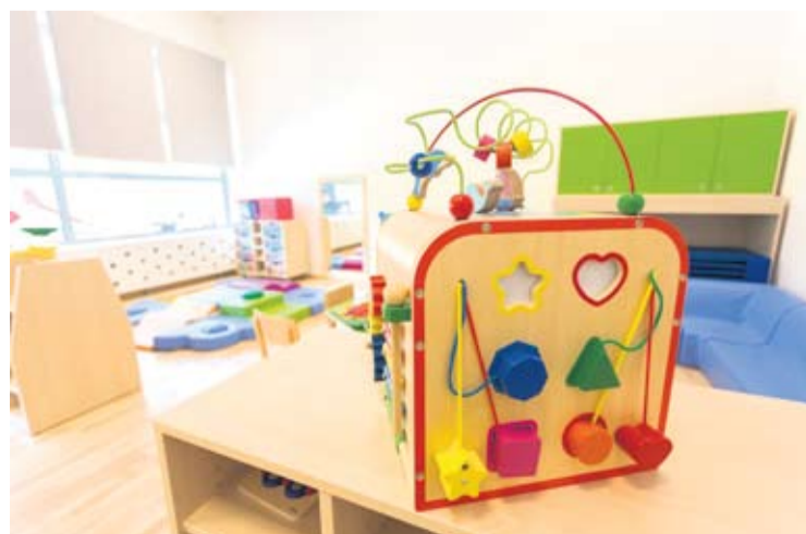
Virovitički vrtić održava visoku kvalitetu već duže vrijeme

- Kvaliteta odgojno-obrazovnog rada u vrtićima teško je mjerljiva, ali virovitički vrtić održava visoku kvalitetu već duže vrijeme. Ključ svega su zaposlenici, koji su svjesni kako kvaliteta odgojno-obrazovnog rada ovisi o svima u Cvrčku. Svatko od nas svjestan je da će dijete koje je danas kod nas, sutra biti aktivan član naše zajednice, grada ili županije i zato je svakome prioritet pridonijeti zadovoljenju potreba svakog djeteta i njegovom individualnom rastu i razvoju - kaže