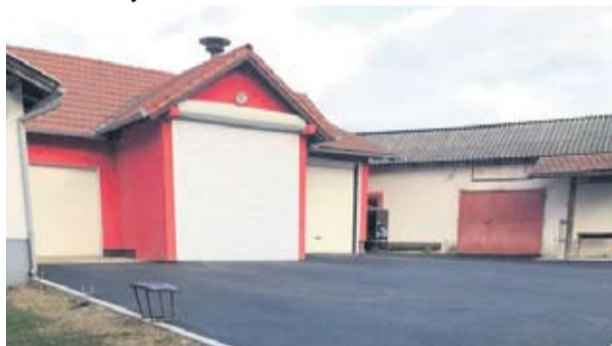
Proširenje vatrogasnih garaža i dvorišta DVD-a Četekovac