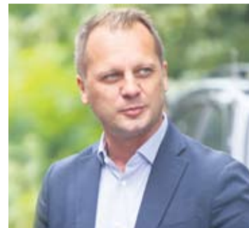
Župan Igor Andrović

- Svako ulaganje u opremu s ciljem da zdravstveni sustav bude brži, efikasniji i dostupniji stanovnicima Virovitičko-podravške, ali i susjednih županija nema cijenu. Koliko je zdravlje važno, ali i uvjeti za rad zdravstvenih djelatnika, liječnika i medicinskih sestara, tehničara, vidimo u ovim izazovnim vremenima. Sva ona ulaganja tijekom godina u brojne energetske obnove domova zdravlja, novu dnevnu bolnicu s opremom, magnetsku rezo-