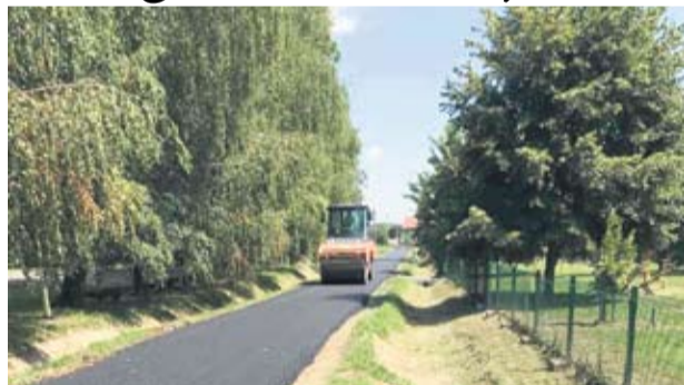
Cesta prema OŠ Mikleuš