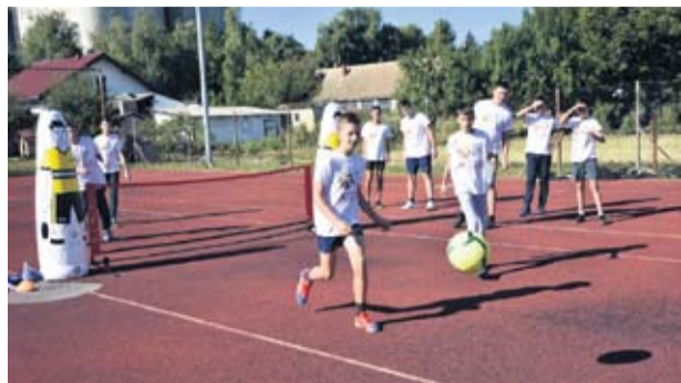
Kroz projekt "Sport4All" nabavljene su sprave za vanjsko vježbanje