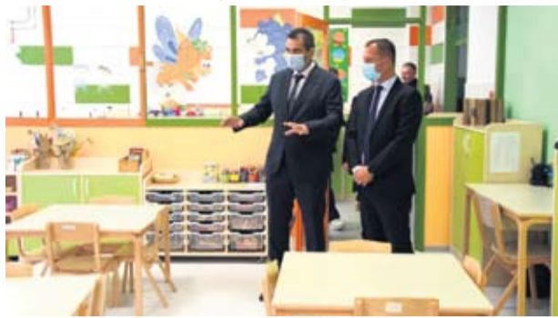
Jedan od najvažnijih projekata u 2020. obnova dječjeg vrtića