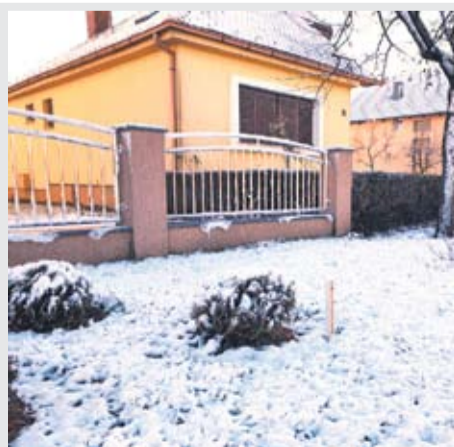
Pitomača, telefonski broj 033/ 782 202 - poručuju iz Vodakoma. V. L.

- Molimo sve koji su zaprimili obavijest o mogućnosti priključenja da nam što prije podnesu zahtjeve. Vodakom Pitomača je za vas na adresi Vinogradska 41,