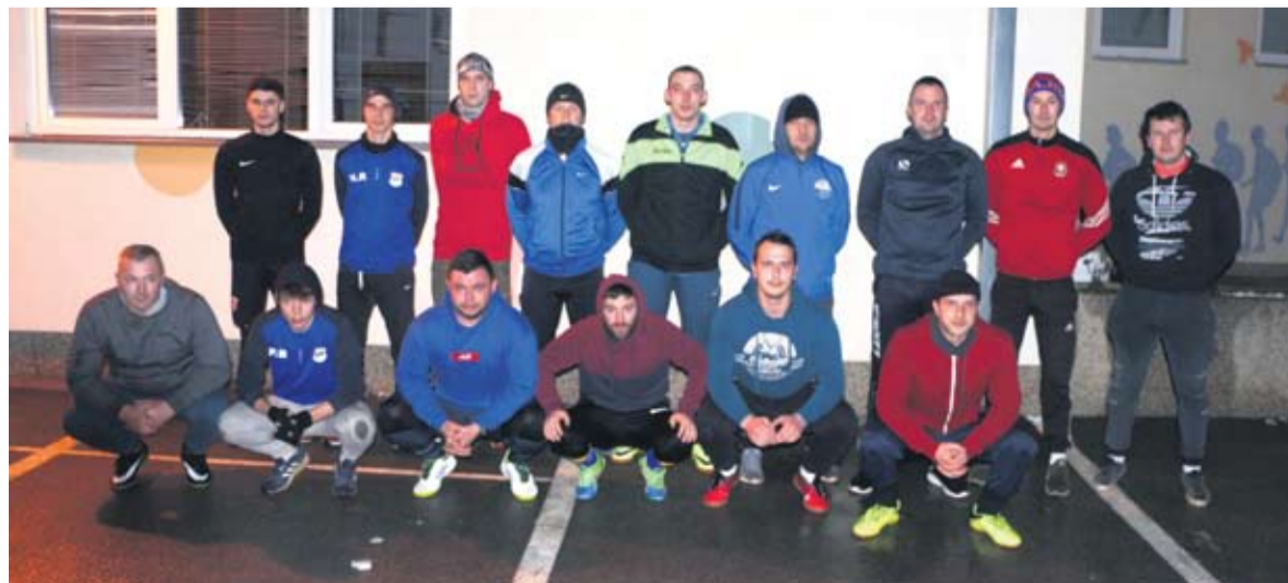
Nogometaši Podgorja za vrijeme kratke pauze tijekom prvog treninga

S treninzima su počeli i nogometaši županijskog drugoligaša Sokola iz Milanovca. Prvih dana imaju trkačke dionice po industrijskoj zoni. Trener Ante Mikulić očekuje da će nakon dobro odradenih priprema u nastavku ligaškog natjecanja biti puno konkurentniji momčadima s vrha tablice.