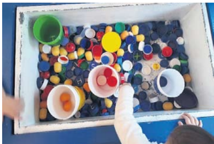
Dječji vrtić "Cvrčak" s ponosom nosi status Eko vrtića

ravnateljica, te ističe kako se zaposlenici trajno educiraju i zahvaljujući tome što je riječ o velikom kolektivu u kojem se lakše organizirati u odnosu na manje vrtiće. Prošle godine odgojno-obrazovni djelatnici prošli su tako edukacije pod na-