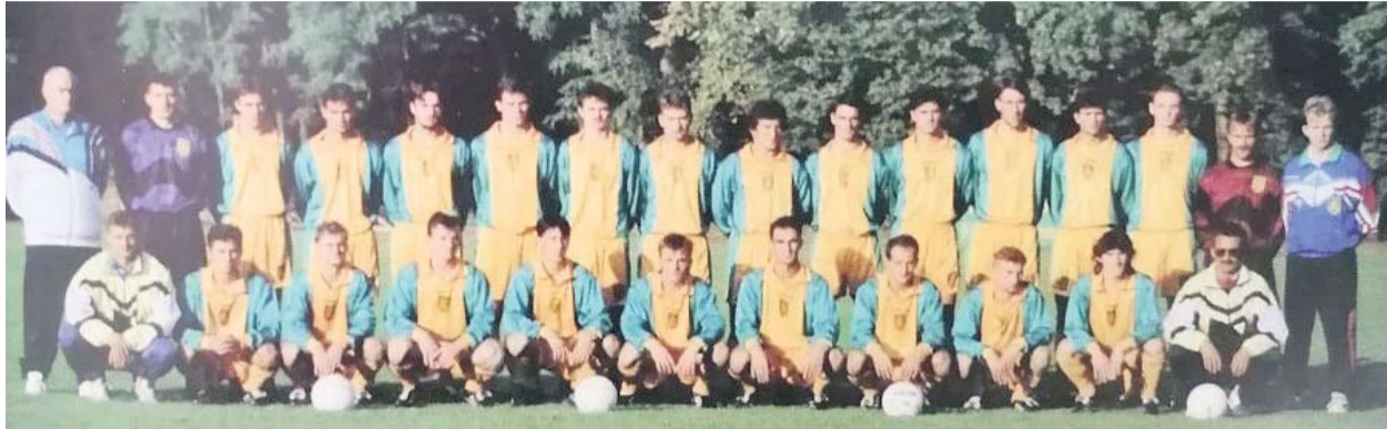
Igrači Mladosti 127

što se sada opravdavaju da nisu bili kompletni. Pa ni mi nijedan susret nismo odigrali kompletni, to je sudbina svih klubova, na to treba računati - izjavio je tada nakon susreta i velike pobjede trener Tonko Vukušić. Do nastavka prvenstva nije prošlo puno vremena, nove utakmice su na rasporedu bile već početkom studenog, a prvo kolo donijelo je i nekoliko iznenađenja i blage izmjene na prvenstvenoj ljestvici. Hrvatski dragovoljac upisao je novi poraz, Zadar je skočio na drugo mjesto, no Mladost nije iskoristila kiks najvećeg konkurenta budući da su osvojili "tek" jedan protiv Slavonije iz Požege. Uspjeh kluba i njegovo prerastanje općinskih granica dovelo je do izmjene dotadašnjeg znaka, novi amblem krasio je dresove suhopoljskog prvligaša. Amblem je konstruiran od vertikalno postavljenog pravokutnika preko kojeg se u donjoj polovici nalazi elipsa. Vertikalni pravokutnik daje