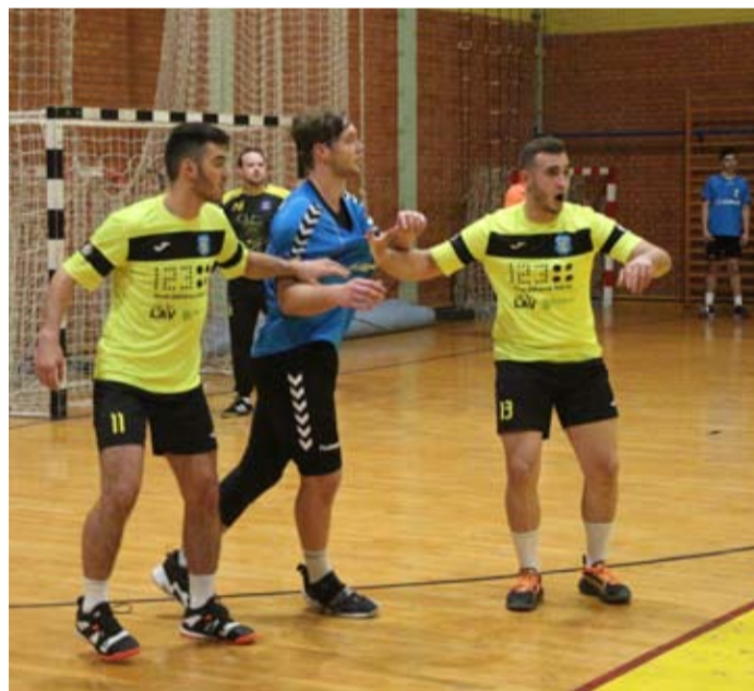
Rukometaši Viro Virovitice ove sezone se bore za opstanak u 1. HRL Sjever