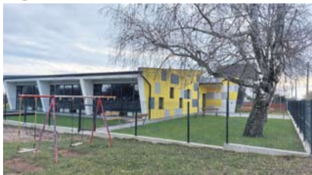
Dječji vrtić "Lipa"