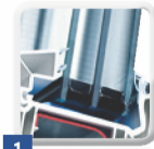
1 2- oder 3-fache Isolierverglasungen in verschiedenen Stärken

Auf den ersten Blick unterscheiden sich die Fenster vieler Anbieter kaum voneinander. Entscheidend für die Qualität sind jedoch die einzelnen Komponenten, die verwendet werden: