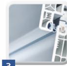
3 Profile für Rahmen, Flügel und andere Konstruktionselemente