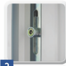
2 Beschläge für Funktion und Bedienung